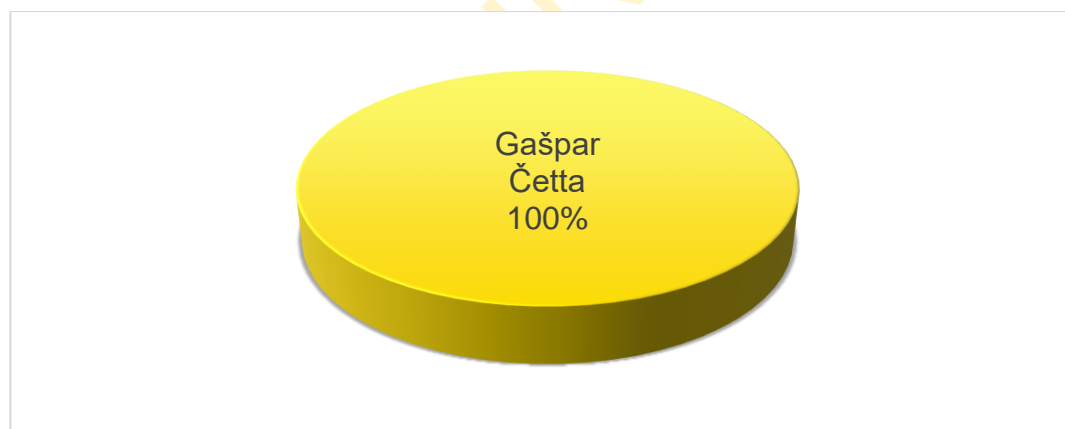
Vlasnička struktura prije i nakon mjera restrukturiranja

Tvrtka ZLATNA LINIJA d.o.o. je u 100%-tnom privatnom vlasništvu, a vlasnik je Gašpar Četta. Nakon restrukturiranja vlasnička struktura tvrtke neće se mijenjati. U nastavku se nalazi grafički prikaz vlasničke strukture prije i nakon mjera restrukturiranja.