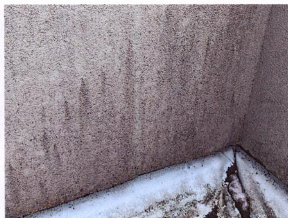
Neadekvatna sanacija – kratkoročno rješenje