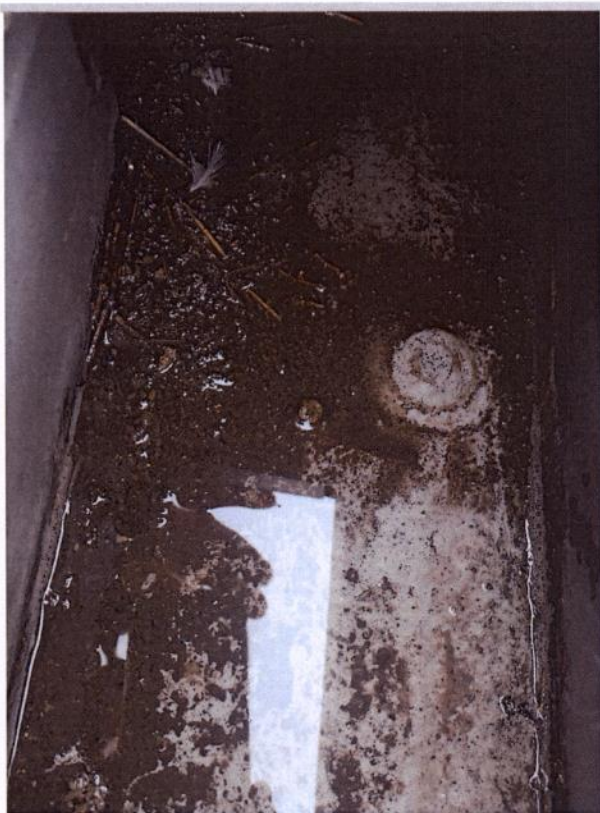
Uvala u kojoj stoji voda