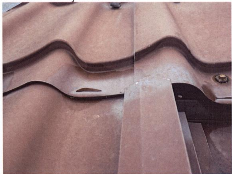
Zadržavanje vode na limu i potencijalno kapilarno mjesto prodiranja vode