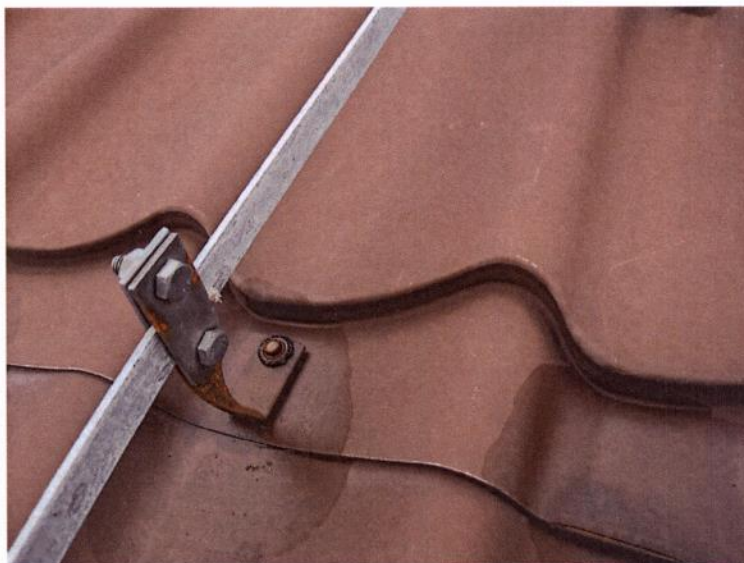
Potencionalno mjesto ulaza vode

Vizualnim pregledom uočeni su nedostaci u na u stanu na prvom katu i u stanu stečajnog dužnika koji je neuseljen (nedovršena terasa), nedostaci krovišta i elemenata pokrova koji su vidljivi sa terase stečajnog dužnika.