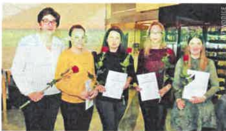
Mlade snage DDK vodice budućnost su Kluba

Protekla 2017. bila je najuspješnija u 42-godišnjoj povijesti Kluba DDK Vodiča, najuspješnijeg kluba darivatelja krvi i humane udruge na području šibensko-kninske županije.