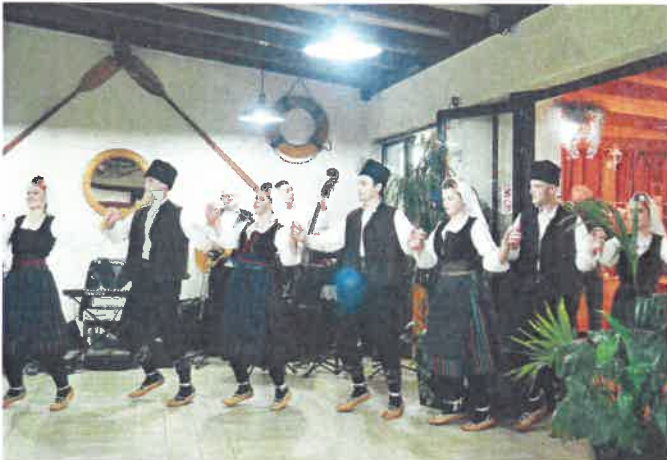
Srpska nacionalna manjina posebno slavi krsnu slavu sv. Vasilija