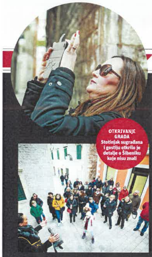
OTKRIVANJE GRADA Stotinjak sugrađana i gostiju otkrilo je detalje o Šibeniku koje nisu znali