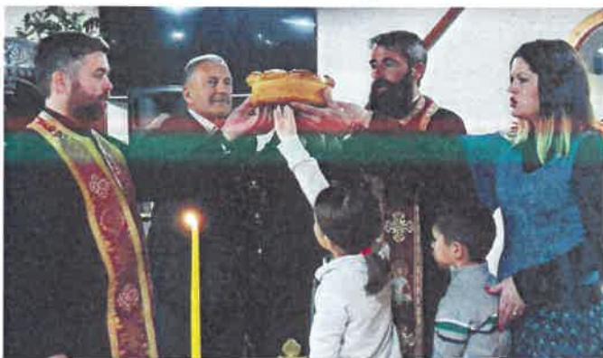
Tradicionalno lomljenje kolača

Vijeće srpske nacionalne manjine Grada Zadra ima savjetodavni ulogu, a fi-