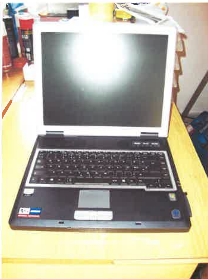
2. PRIJENOSNO RAČUNALO