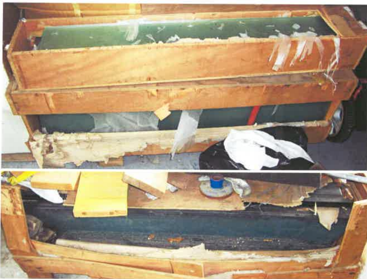
9. STAKLENI ELEMENTI, odradnih sustava i stepenica