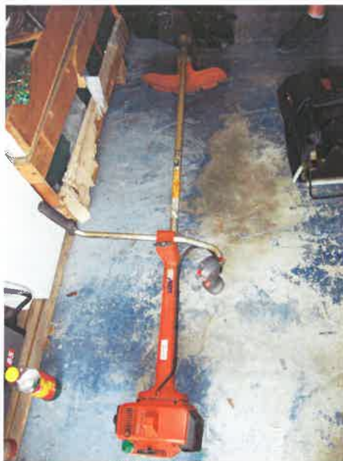
5. KOSILICA (Trimer) , m. Husqvama