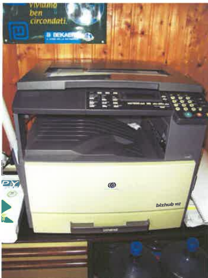
1. FOTOKOPIRNI APARAT, m. Konica Minolta