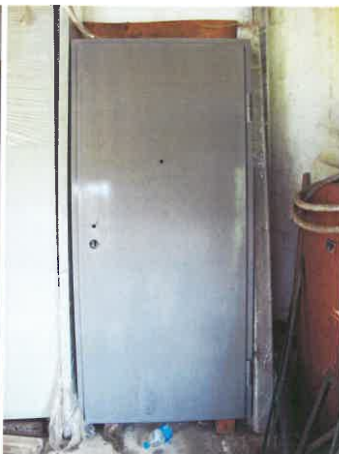
5. VRATA, protuprovalna, 2 kom.