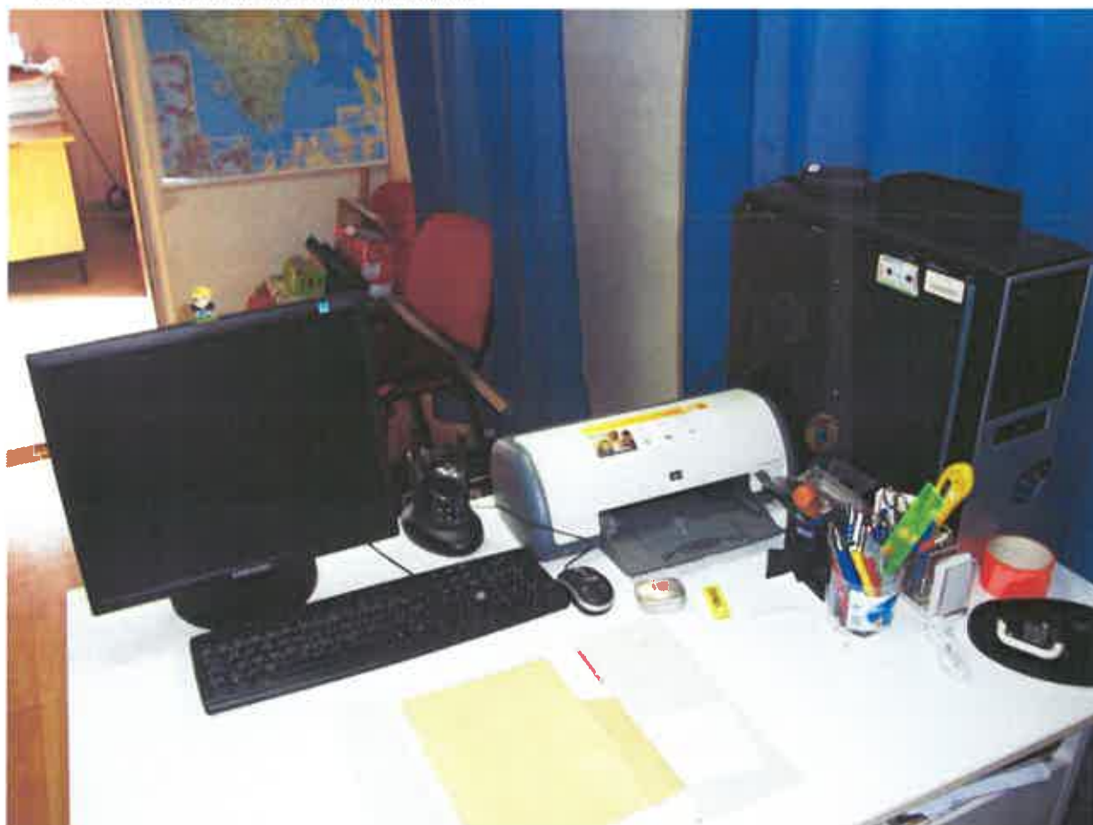
3. OSOBNO RAČUNALO, m. Samsung