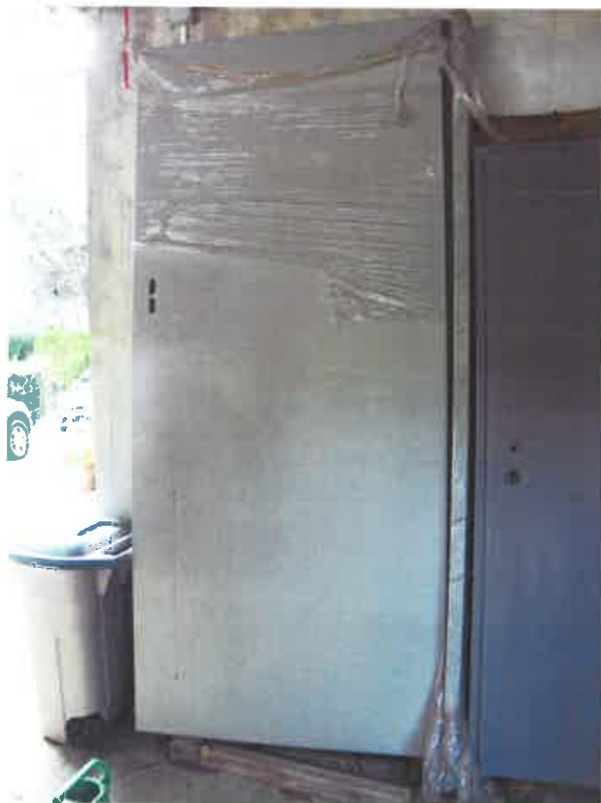
4. VRATA, protupožarna, 1 kom.