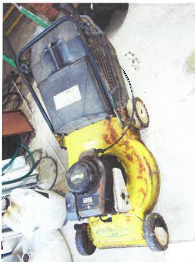
4. MOTORNA KOSILICA, m. Herby