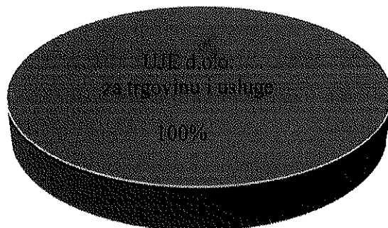
Vlasnička struktura prije i nakon mjera restrukturiranja

Tvrtka GALEB d.o.o. je u 100%-tnom vlasništvu, a u vlasništvu je tvrtke UJE d.o.o. za trgovinu i usluge. Nakon restrukturiranja vlasnička struktura tvrtke neće se mijenjati. U nastavku se nalazi grafički prikaz vlasničke strukture prije i nakon mjera restrukturiranja.