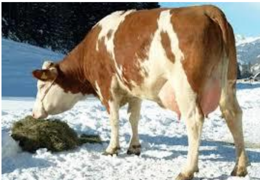
Tablica 4: Prioritetne tražbine Nema.