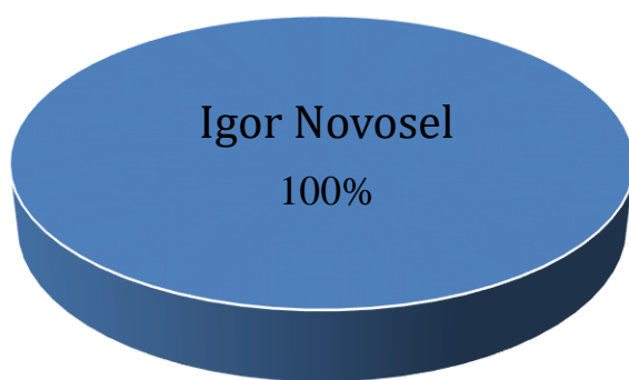
Vlasnička struktura prije i nakon mjera restrukturiranja

Tvrtka INAGRO d.o.o. je u 100%-tnom privatnom vlasništvu, a vlasnik je Igor Novosel. Nakon restrukturiranja vlasnička struktura tvrtke neće se mijenjati. U nastavku se nalazi grafički prikaz vlasničke strukture prije i nakon mjera restrukturiranja.