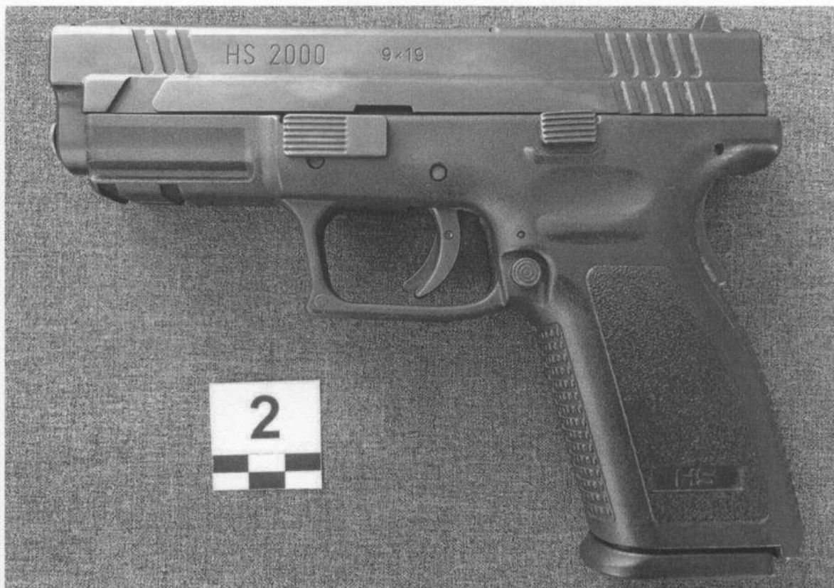
Slika 2-1. Lijeva strana oružja