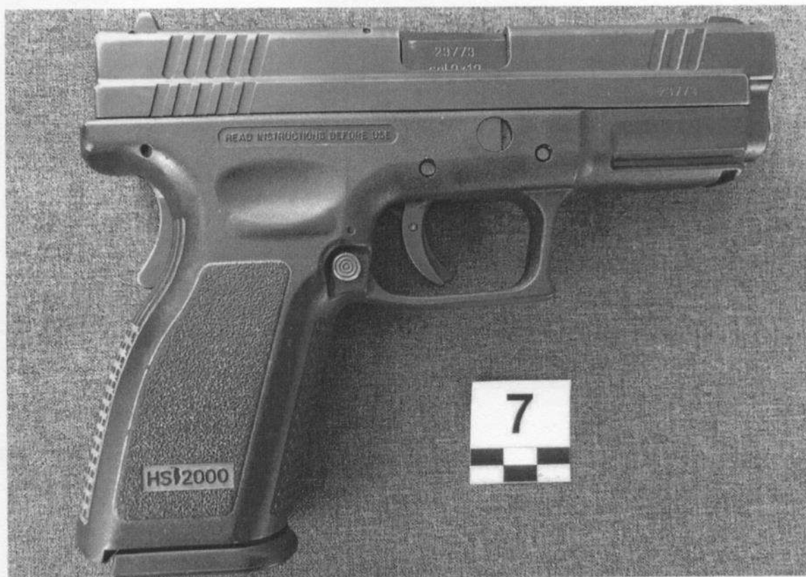
Slika 7-2. Desna strana oružja