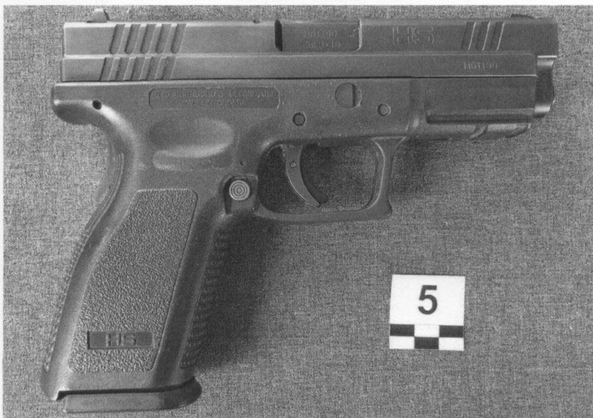
Slika 5-2. Desna strana oružja