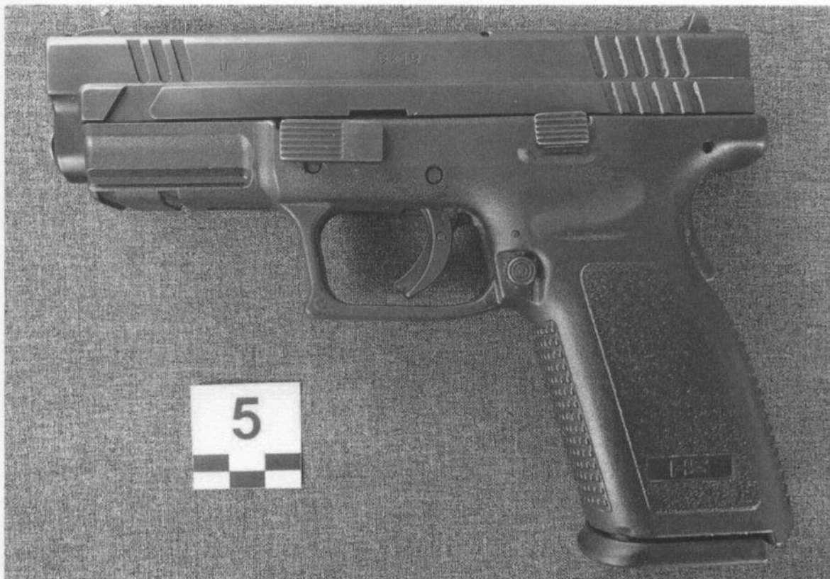
Slika 5-1. Lijeva strana oružja