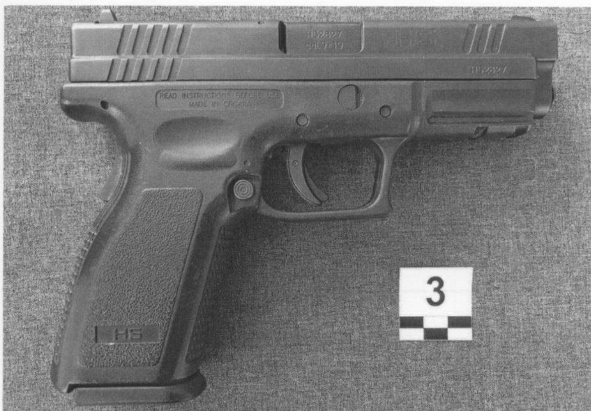
Slika 3-2. Desna strana oružja