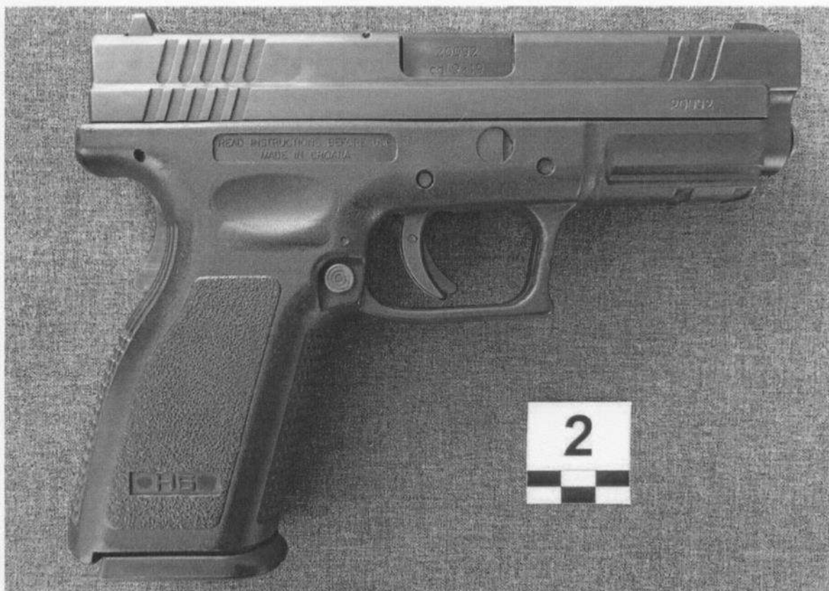
Slika 2-2. Desna strana oružja