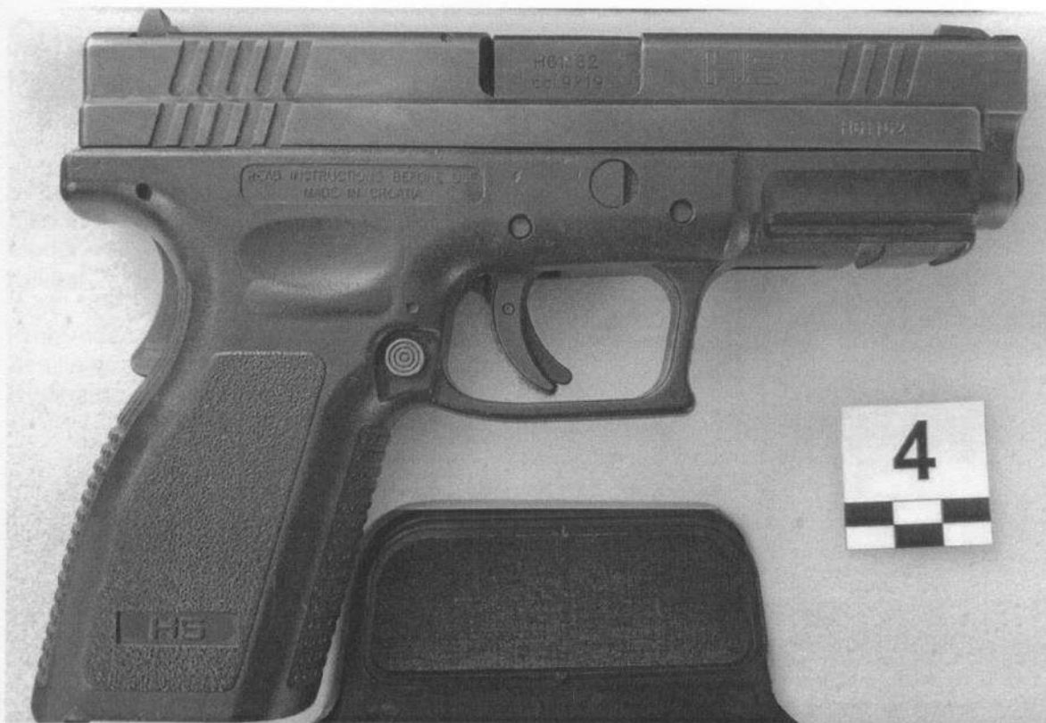
Slika 4-1. Desna strana oružja