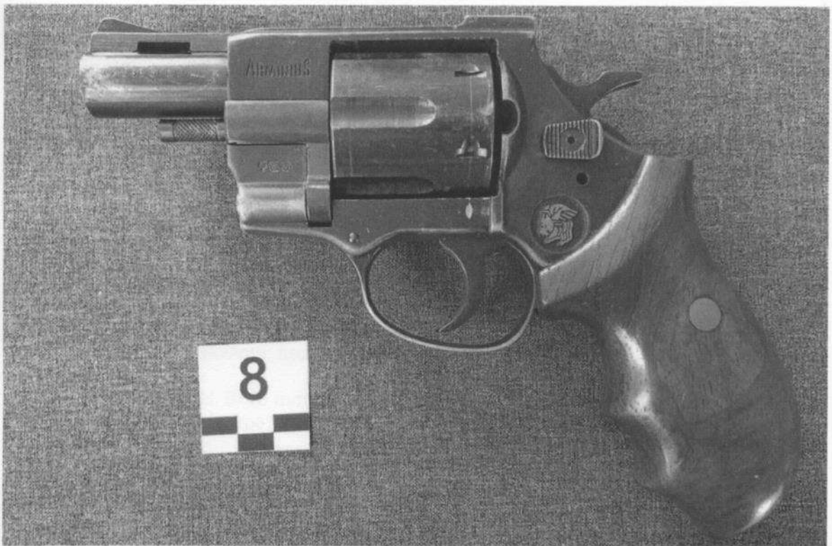
Slika 8-1. Lijeva strana oružja