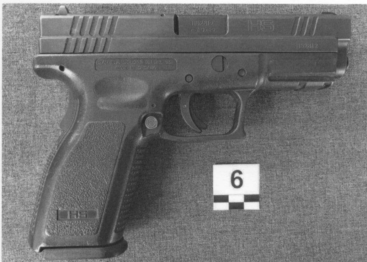
Slika 6-2. Desna strana oružja