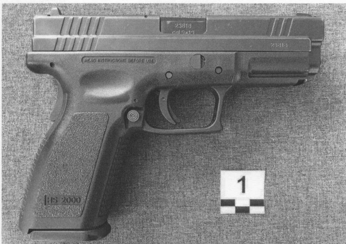
Slika 1-2. Desna strana oružja