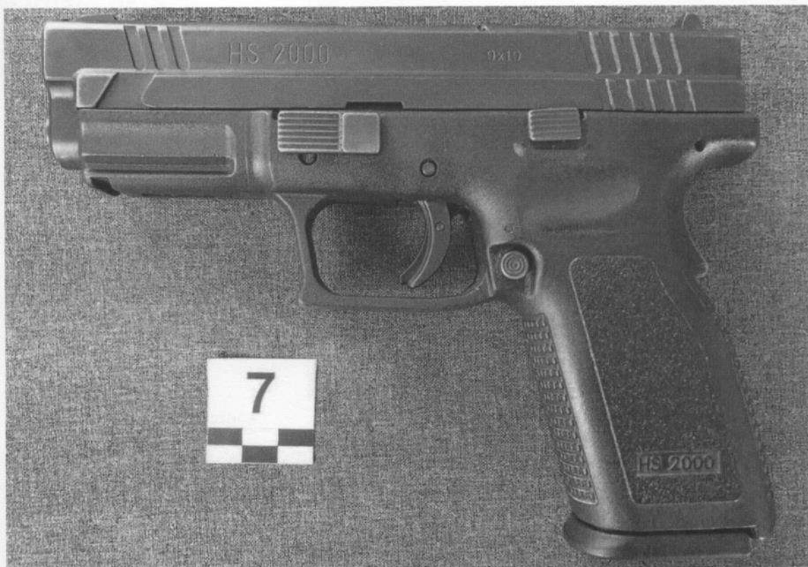
Slika 7-1. Lijeva strana oružja