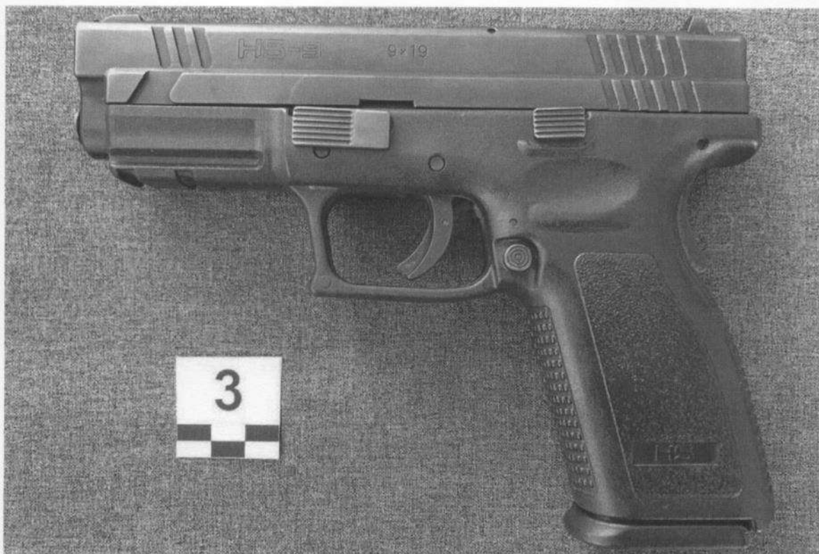
Slika 3-1. Lijeva strana oružja