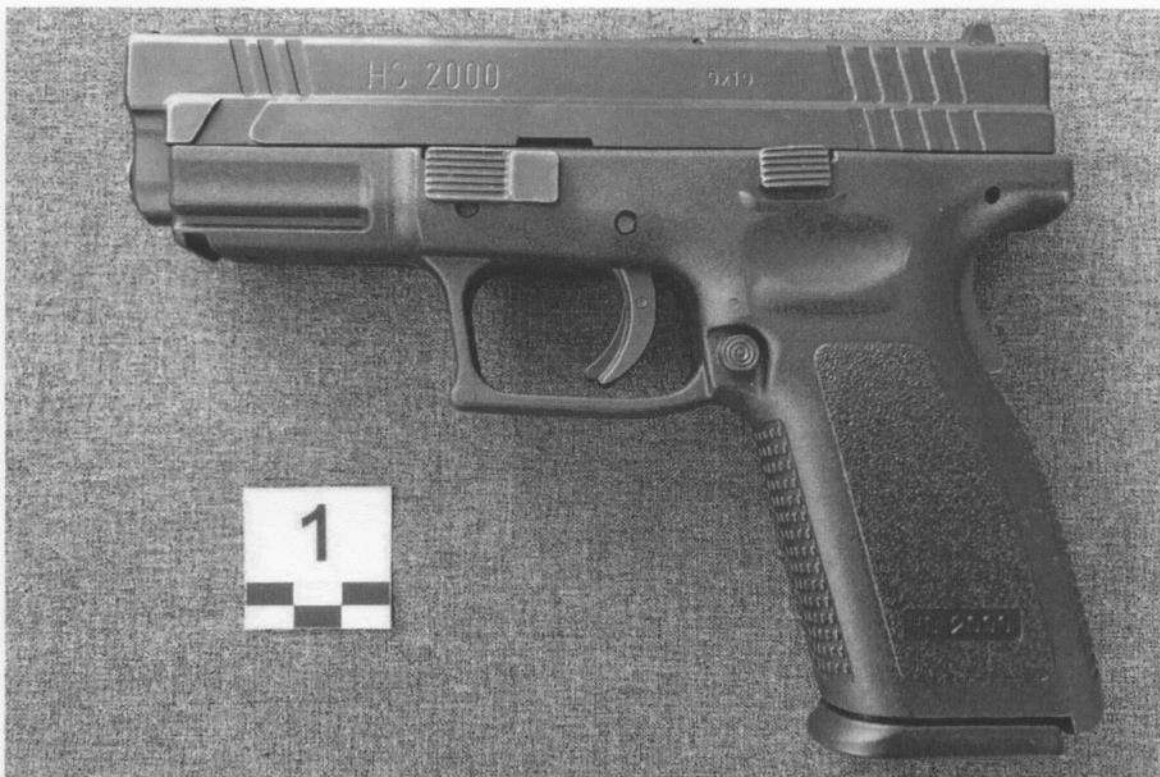
Slika 1-1. Lijeva strana oružja