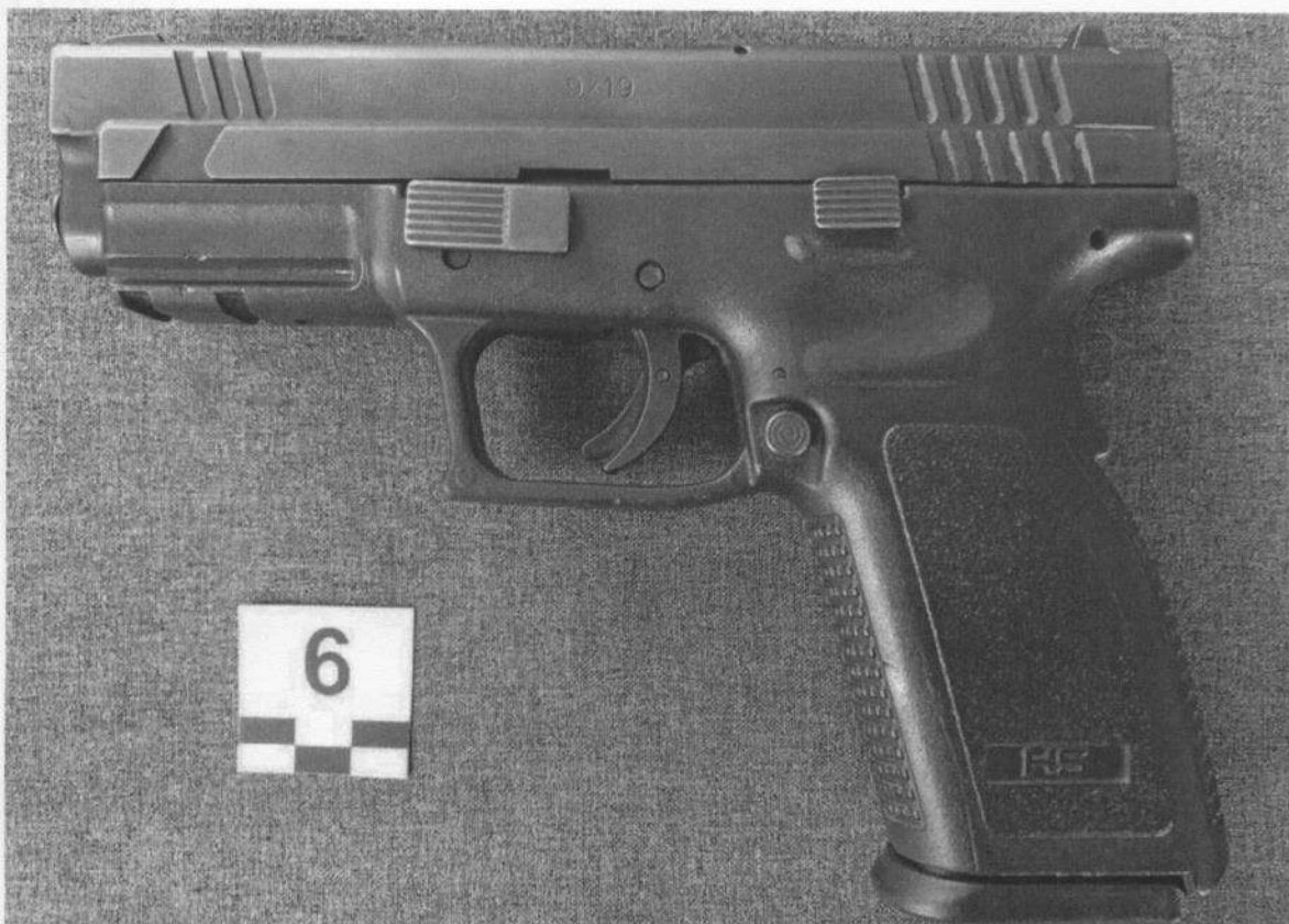
Slika 6-1. Lijeva strana oružja