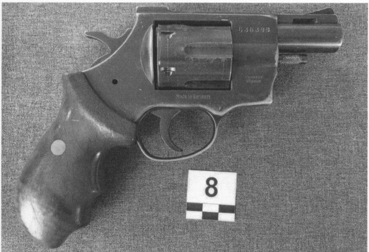
Slika 8-2. Desna strana oružja