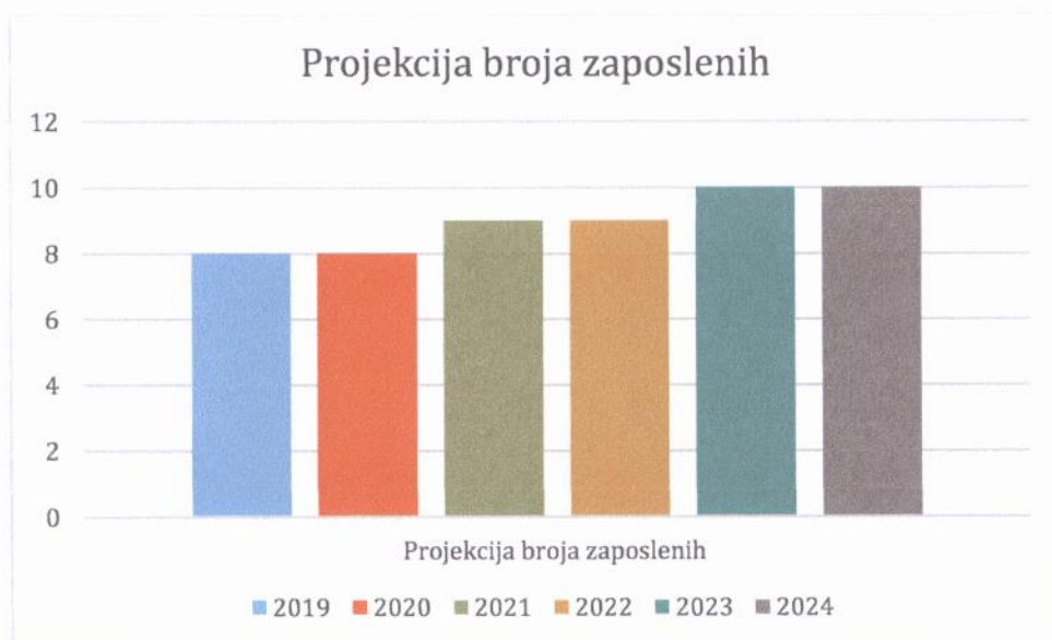
Grafički prikaz: Plan kretanja broja zaposlenih po godinama

Planirano kretanje broja zaposlenih prikazano je grafičkim prikazom u nastavku, a odnosi se na period od 2019. g. - 2024. g. Grafički prikaz prikazuje povećanje broja zaposlenih u odnosu na prethodne godine (prosječan broj zaposlenih) što je rezultat restrukturiranja tvrtke i povećanja prodaje do kojeg je došlo kroz projekciju budućeg poslovanja tvrtke.