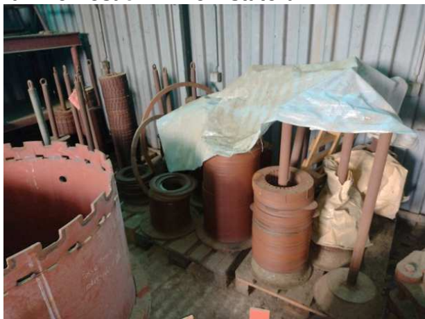
Ad 7 i 8 Nosači i Limovi statora