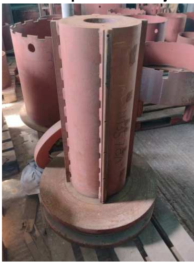
Ad 13 Kalup za namatanje 2