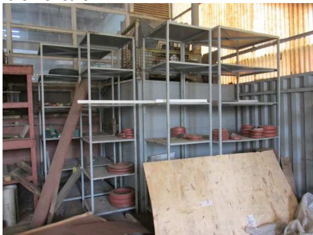
Ad 3 Polica 3