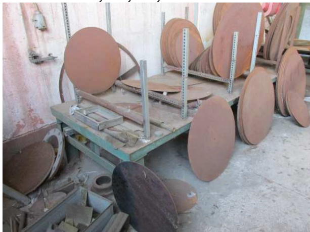
Ad 1 Stol 1 1,0x3,1x0,6 m