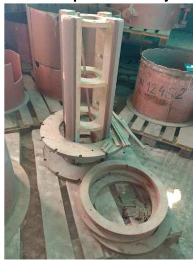
Ad 14 Kalup za namatanje 3