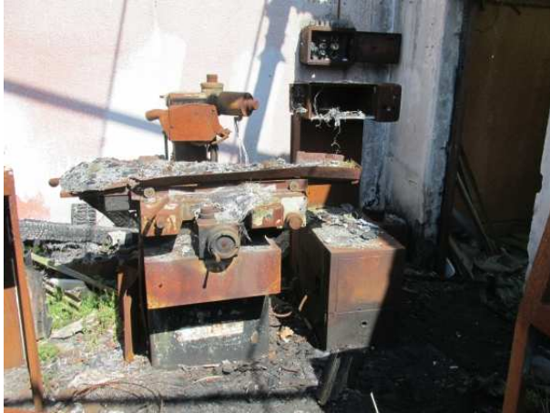
Ad 1 i 2 Uređaj za ispitivanje i Uređaj za brušenje