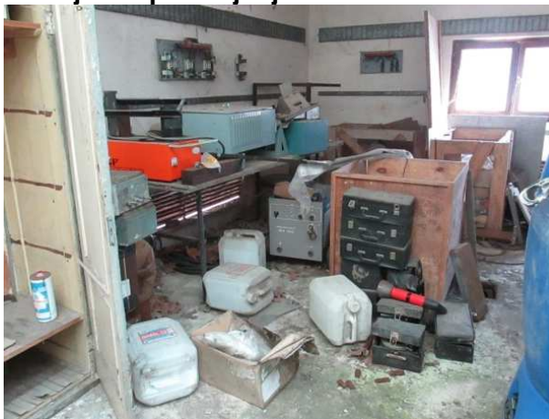
Ad 7 Djelovi postrojenja