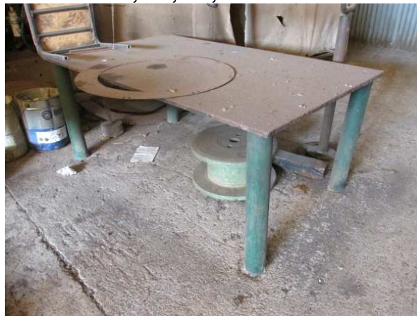
Ad 2 Stol 2 1,0x1,6x0,7 m