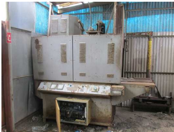
Ad 5 Peč za žarenje