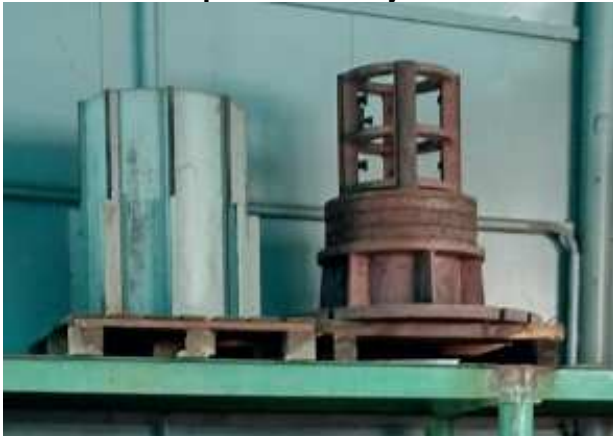
Ad 15 i 16 Kalup za namatanje 4 i 5