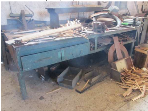
Ad 7 Stol 7 1,7x3,1x0,9 m