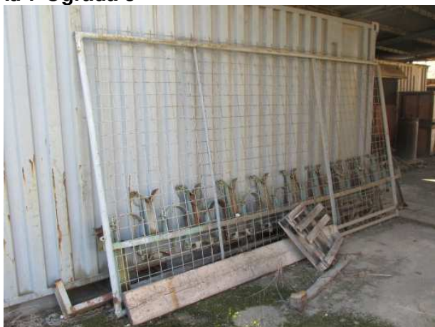
Ad 7 Ograda 3