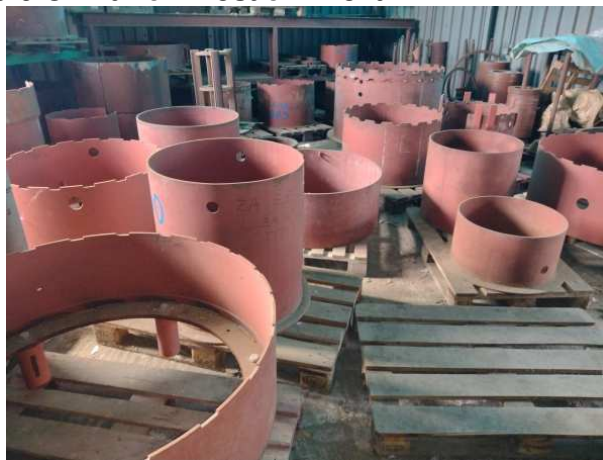
Ad 9 Cilindrični nosači limova