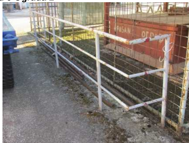
Ad 6 Ograda 2