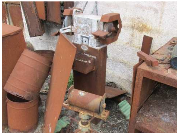
Ad 26 Brusilica mala