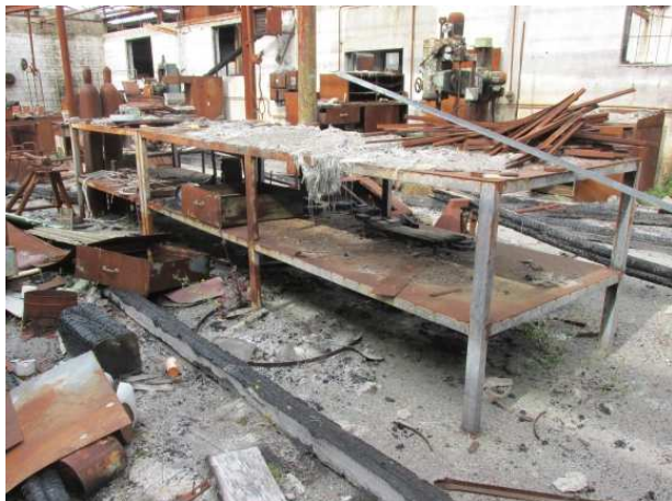
Ad 25 Stol u sredini hale