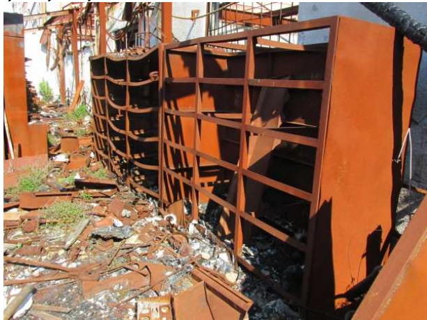
Ad 2 i 3 Ormar stalaža 2,0x0,7x1,8 mm i 3,0x0,7x1,8 mm