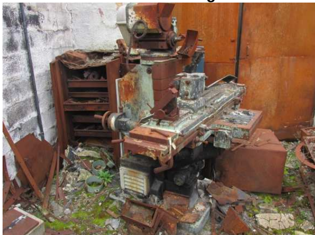
Ad 12 i 13 Glodalica i Ormari glodalice