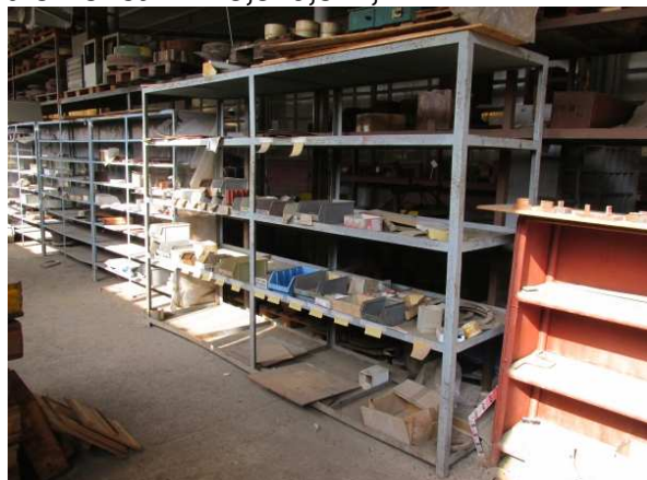
Ad 8 Polica 12 3,3x0,8x2,2 m