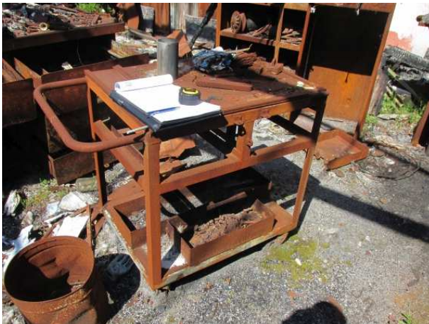
Ad 4 Kolica