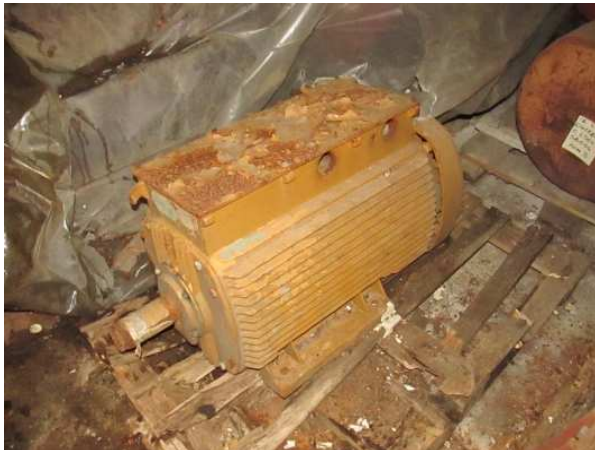
Ad 4 Elektromotor