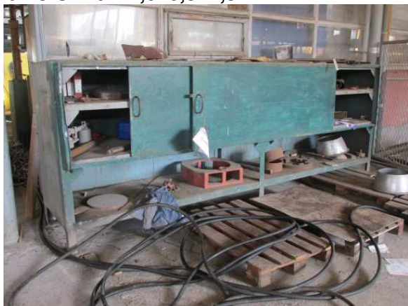
Ad 18 Ormar 4,0x0,8x1,5 m