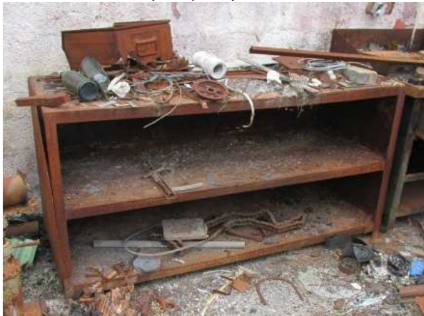
Ad 5 Ormar 1 1,8x0,7x0,9 mm