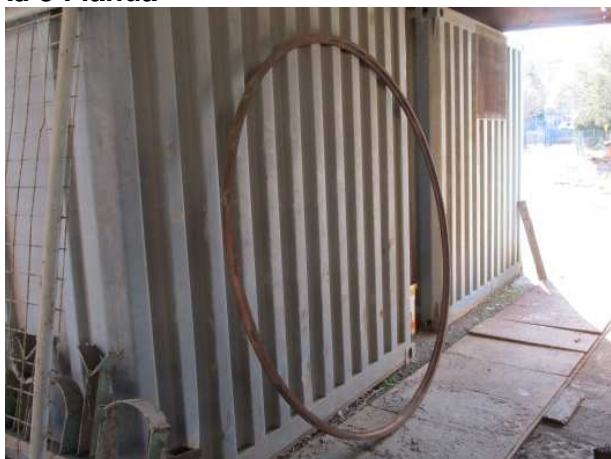
Ad 5 Flanda