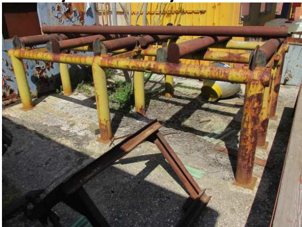
Ad 8 i 9 Valjčasta staza i Cijevni nosač NO100