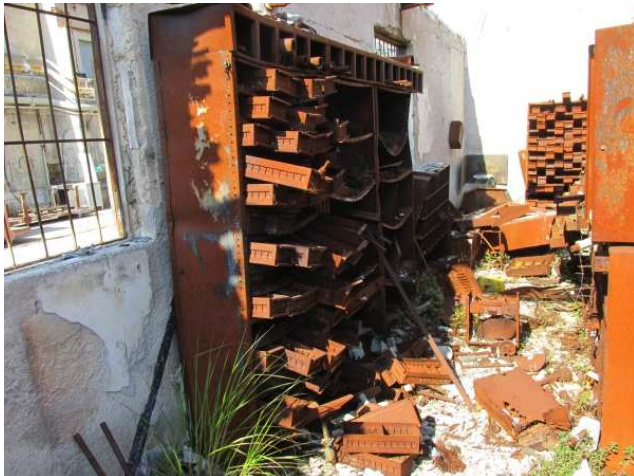
Ad 7 Ormar sa malim ladicama 0,9x0,4x1,9 mm