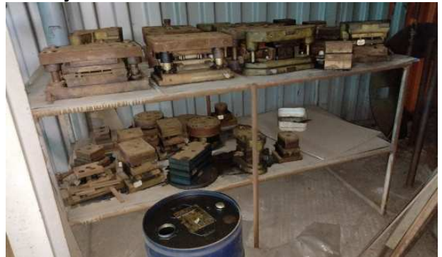
Ad 4 i 11 Stalaža 1,8x0,9x1,0 m i Alat za štancanje