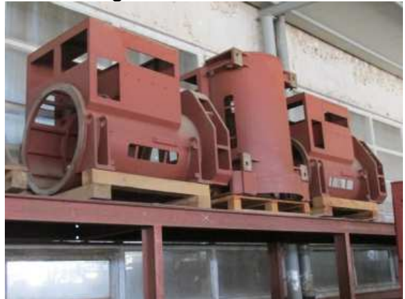
Ad 2 Kućište generatora