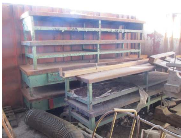
. Ad 3 i 4 Stol metalni 1 i 2