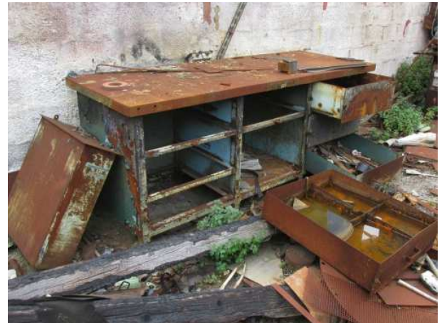
Ad 6 Stolovi radni zeleni