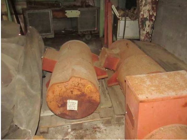
Ad 1 Generator S8034