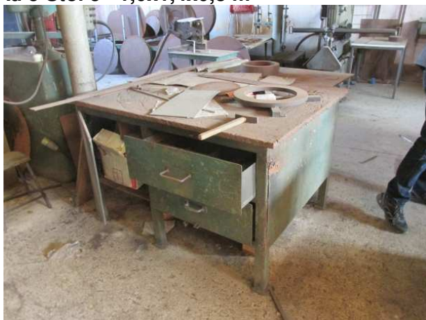
Ad 5 Stol 5 1,0x1,4x0,8 m