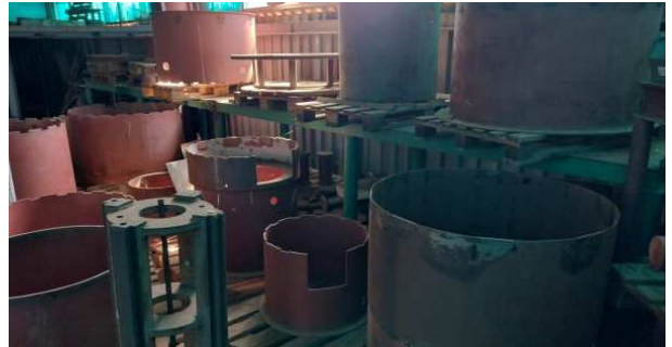
Ad 2 Stalaža 8,0x1,0x1,1 m