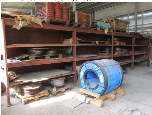
Ad 1 Polica 1 10,0x2,3x1,0 m