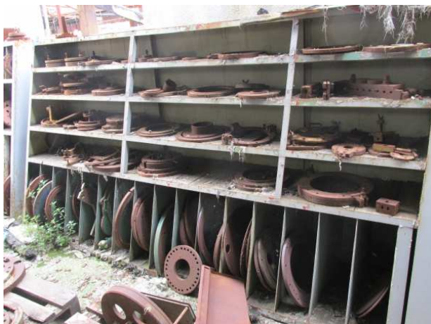
Ad 13 Ormar rozeta 3 4,0x0,5x1,9 mm