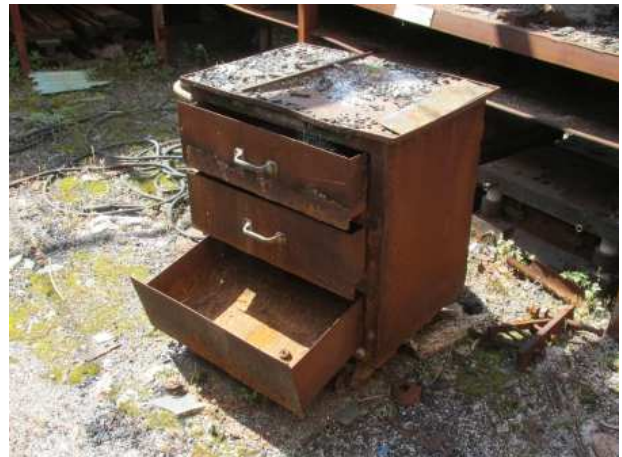
Ad 5 Ladičar sa kotačima