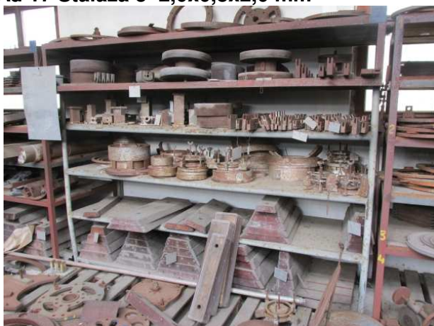
Ad 17 Stalaža 3 2,0x0,8x2,0 mm