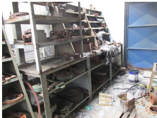
Ad 14 Radni stol sa stalažama 4,0x0,8x1,5 mm