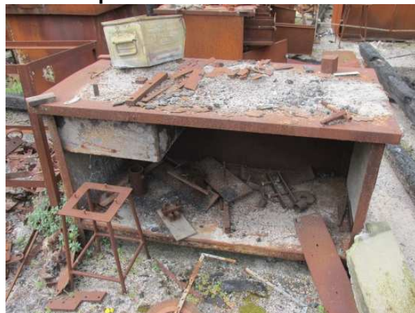
Ad 19 Stol priručni