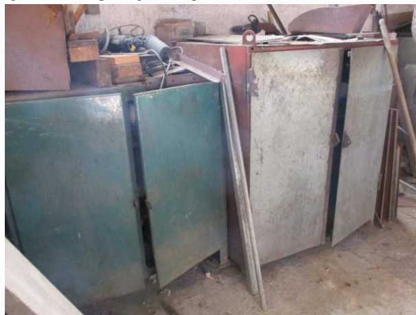
Ad 11 i 12 Ormar 2 i 3