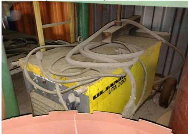
Ad 5 Uređaj za zavarivanje ULJANIK UTA 300