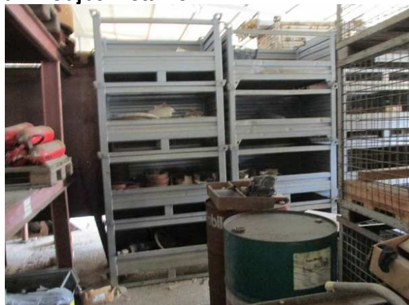
Ad 14 Gajbe metalne