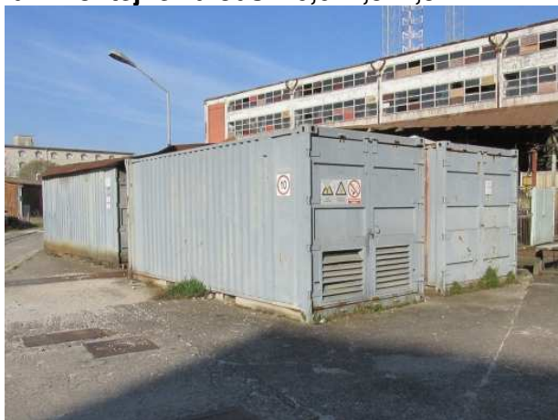
Ad 2 Kontejner brodski 6,0x2,5x2,5 m