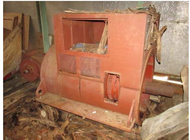
Ad 5 Generator S8144