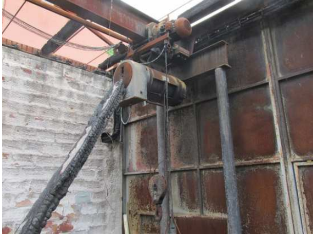
Ad 1 Dizalica bez staze