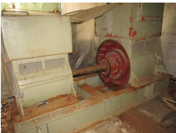
Ad 6 Dupli generator sa postoljem