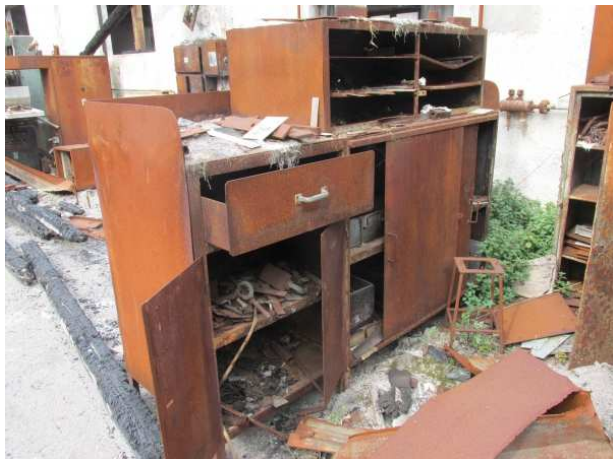
Ad 21 Ormar 4 visoki do velike bušilice