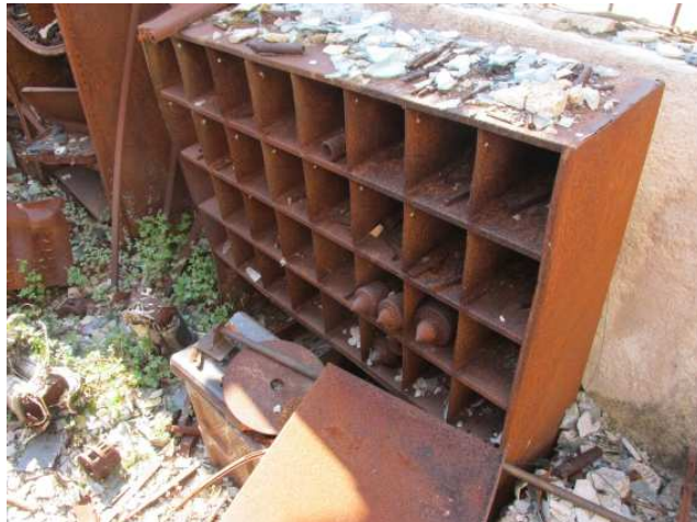
Ad 8 Ormar 1,2x0,3x1,2 mm