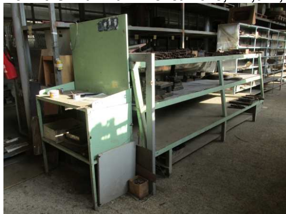
Ad 19 i 20 Ormar mali i Polica 10 3,7x1,0x1,4 m