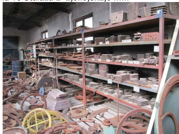
Ad 16 Stalaža 2 2,0x0,8x2,0 mm