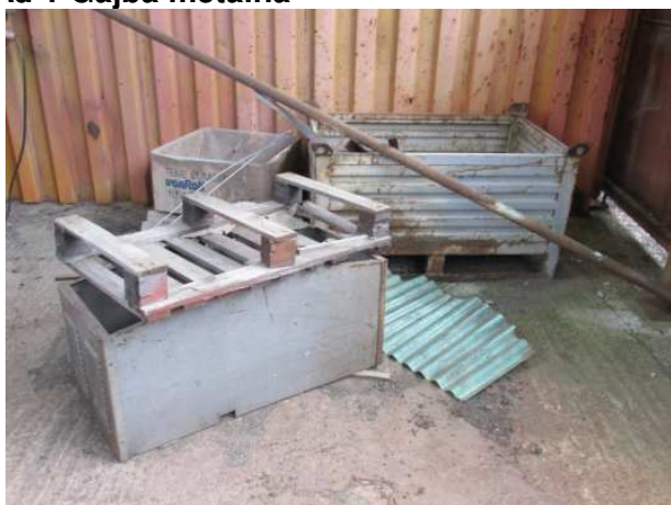
Ad 1 Gajba metalna