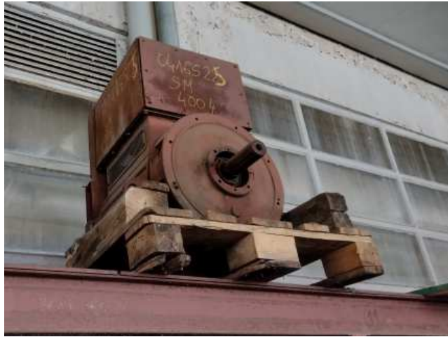
Ad 3 Generator mali