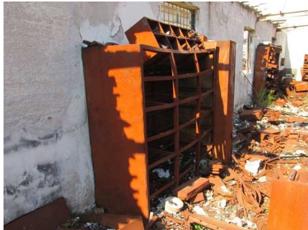
Ad 5, 6 i 9 Ormar sa pretincima 0,55(0,3)x2,0x2,0 mm, Gornji dodatak ormara 0,3x2,0x0,3 m i Ladice za 3 ormara