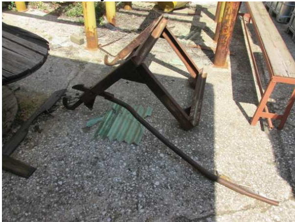
Ad 7 Nosač baja za viličar