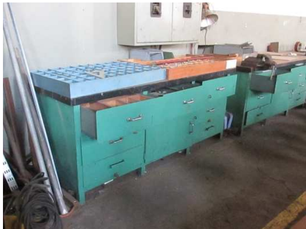
Ad 9 Stolovi radni zeleni