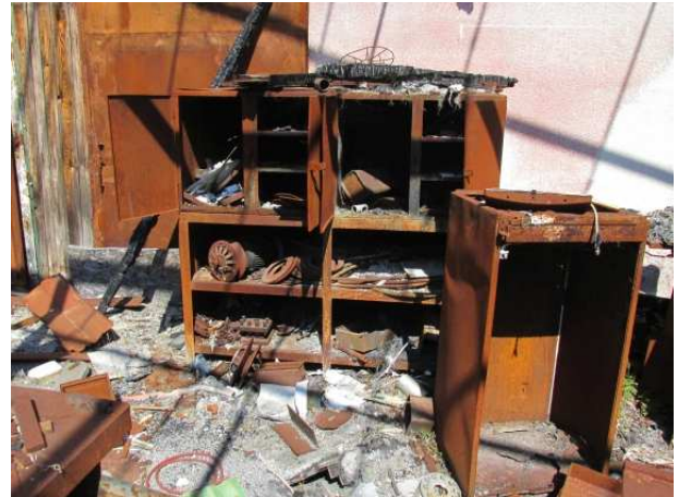
Ad 3 Ormar čelični 3djelni