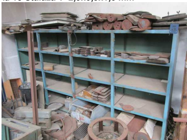
Ad 15 Stalaža 1 2,9x0,5x1,6 mm