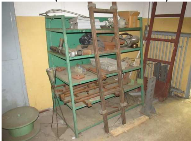
Ad 1 Stalaža (čelična zelena u hodniku)