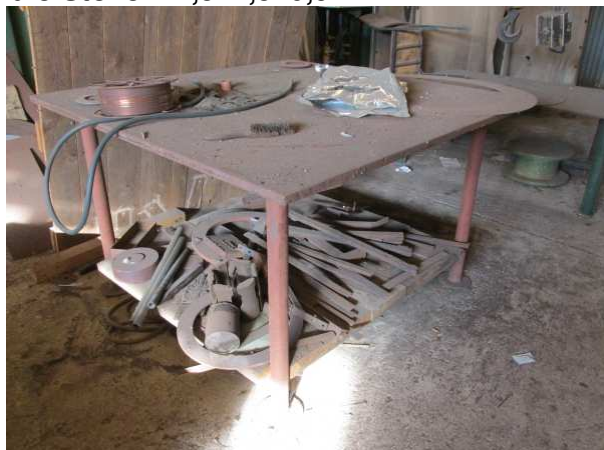
Ad 3 Stol 3 1,5x1,5x0,9 m