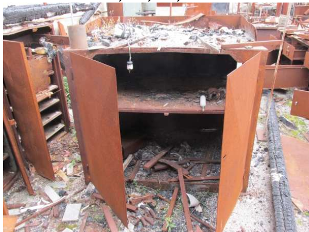
Ad 17 Ormar 4 1,3x0,9x1,1 m