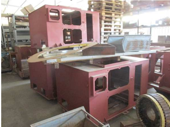
Ad 3 Kućište hladnjaka