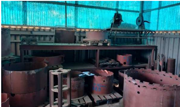
Ad 3 Stalaža 5,0x1,0x1,5 m