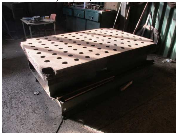
Ad 4 Stol 4 1,9x1,3x0,7 m