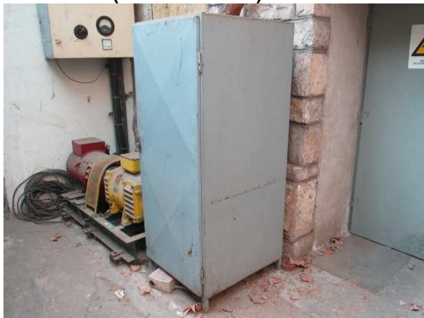
Ad 4 Ormar (čelični užu sivi)