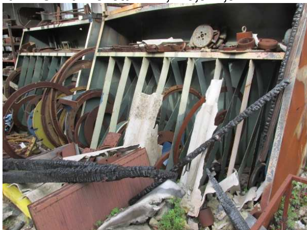
Ad 11 Ormar rozeta 1 2,4x0,9x1,9 mm