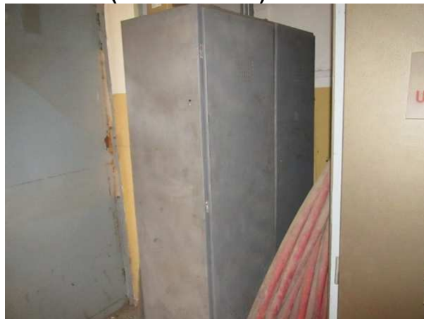
Ad 3 Ormar (čelični širi sivi)