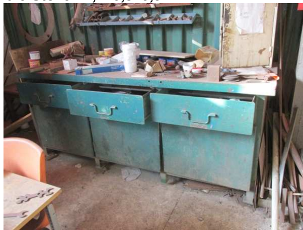
Ad 9 Stol 9 2,2x0,8x0,9 m