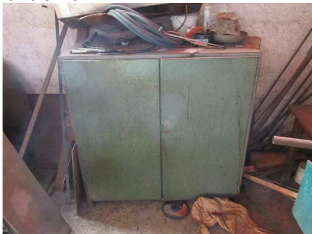
Ad 10 Ormar 1