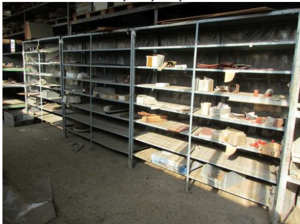
Ad 21 Polica 11 2,0x0,5x2,0 m