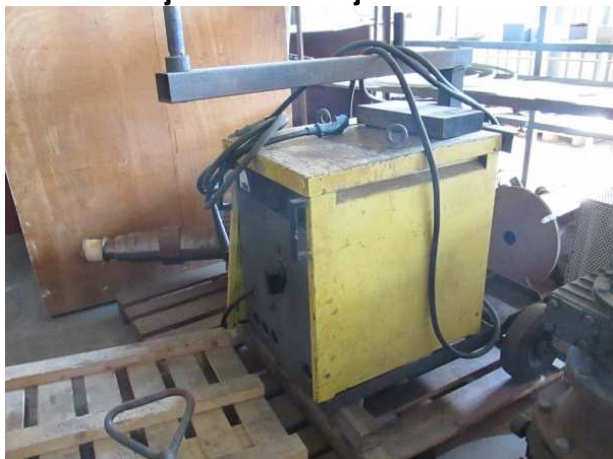
Ad 10 Uređaj za zavarivanje LDA 400