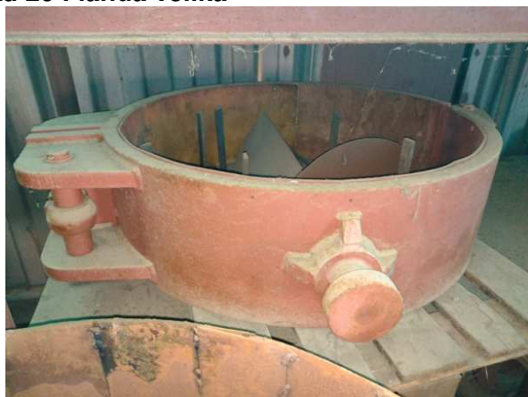
Ad 20 Flanda velika