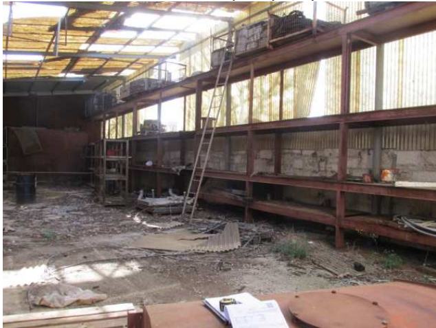
Ad 1 Stalaža metalna 25,0x1,0x3,8 m