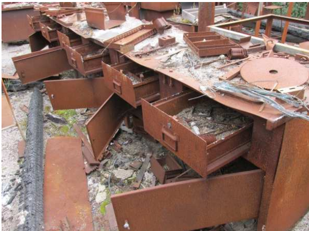
Ad 7 Stolovi radni sa ladicama