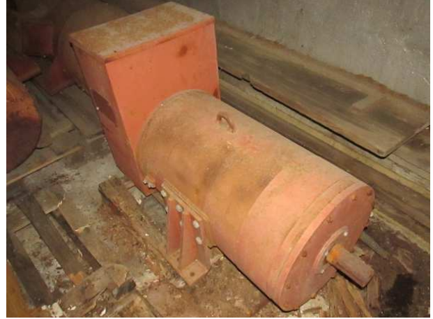
Ad 2 Generator S8054