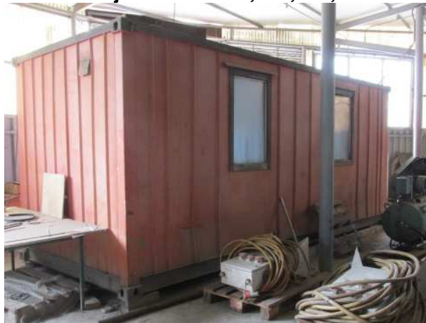
Ad 28 Kontejner brodski 6,0x2,5x2,5 m