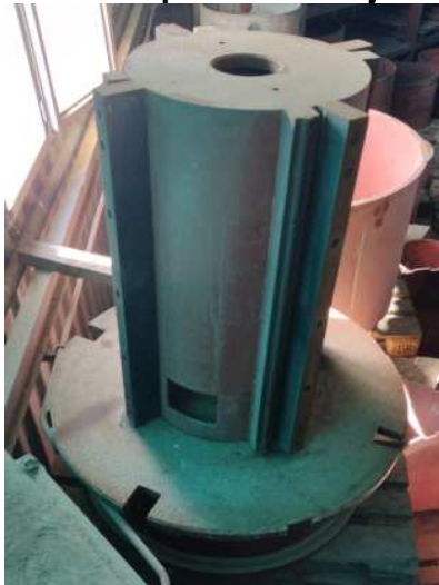
Ad 12 Kalup za namatanje 1