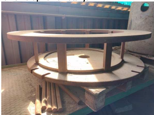
Ad 18 Kalup za namatanje 7