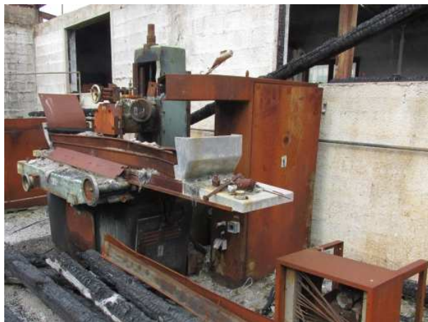
Ad 18 Brusilica velika