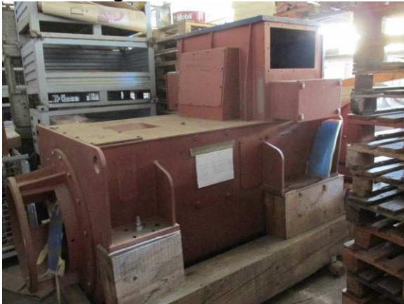
Ad 1 Kućište generatora WOODWARD