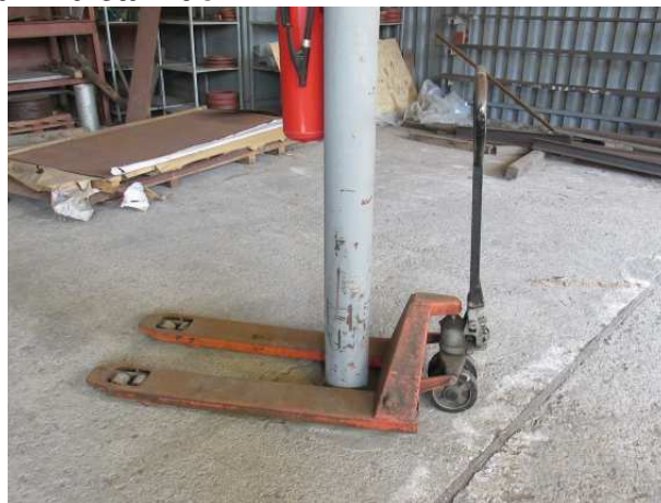
Ad 4 Paletar ručni