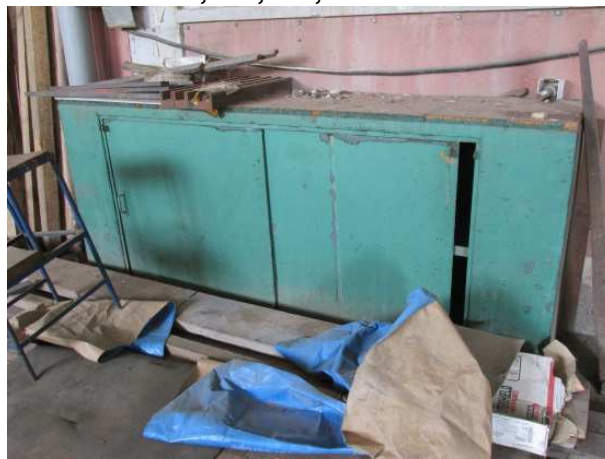
Ad 13 Ormar 2,5x0,6x1,1 m