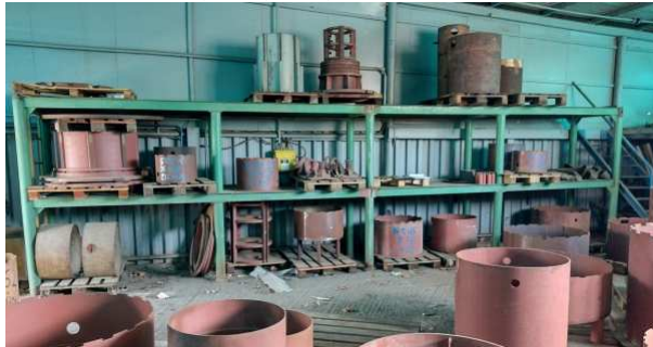
Ad 1 Stalaža 8,0x1,0x2,2 m