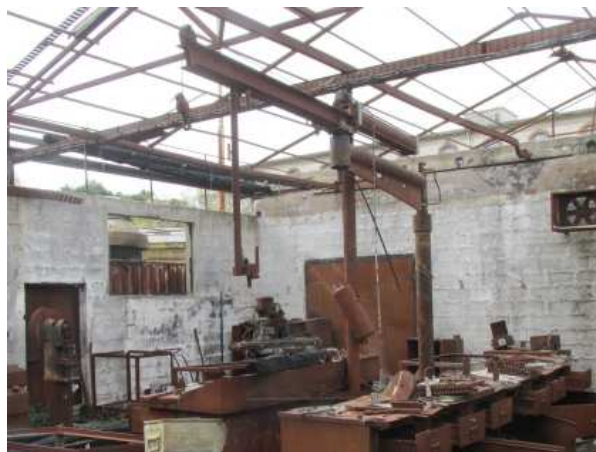
Ad 28 Razni dijelovi alata i naprava po podu