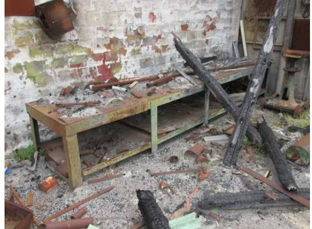
Ad 2 Stol niski 4,0x0,8x0,7 mm