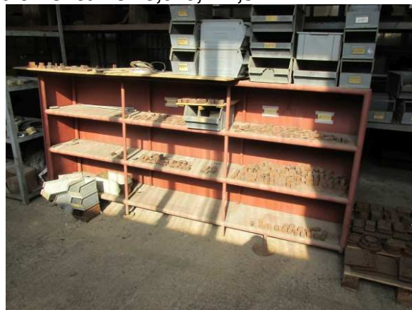
Ad 9 Polica 13 3,0x0,4x1,3 m