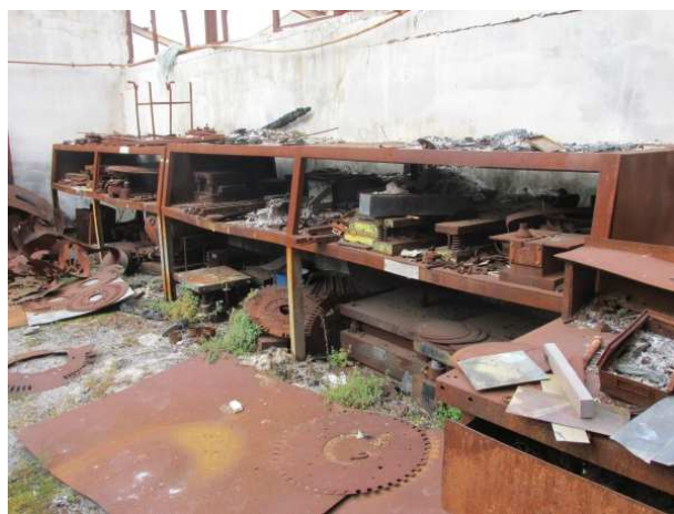
Ad 8 i 9 Ormar za spise 1,0x0,6x1,7 mm i Ormar na prolazu 2,0x0,7x2,0 mm