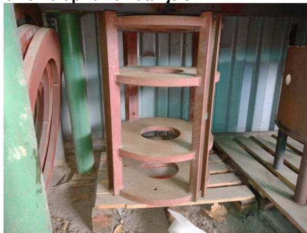
Ad 19 Kalup za namatanje 8