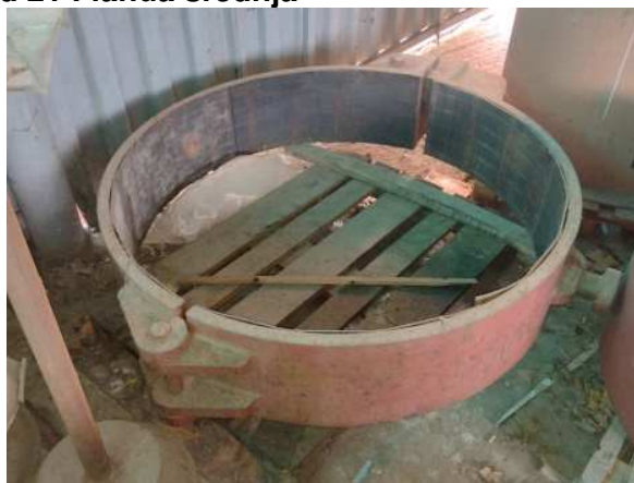
Ad 21 Flanda srednja