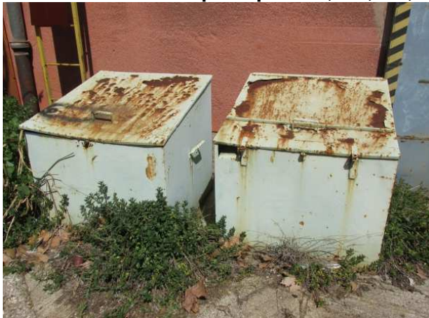
Ad 4 Čelični kasuni sa poklopcem 1,0x1,0x0,9 m