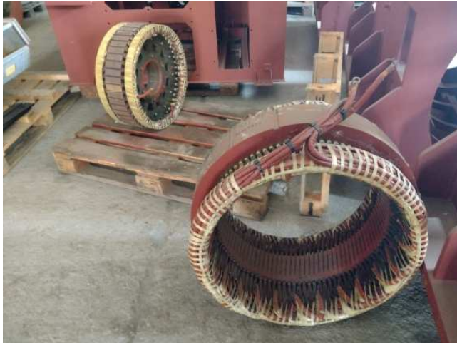
Ad 1 i 2 Stator mali i veliki