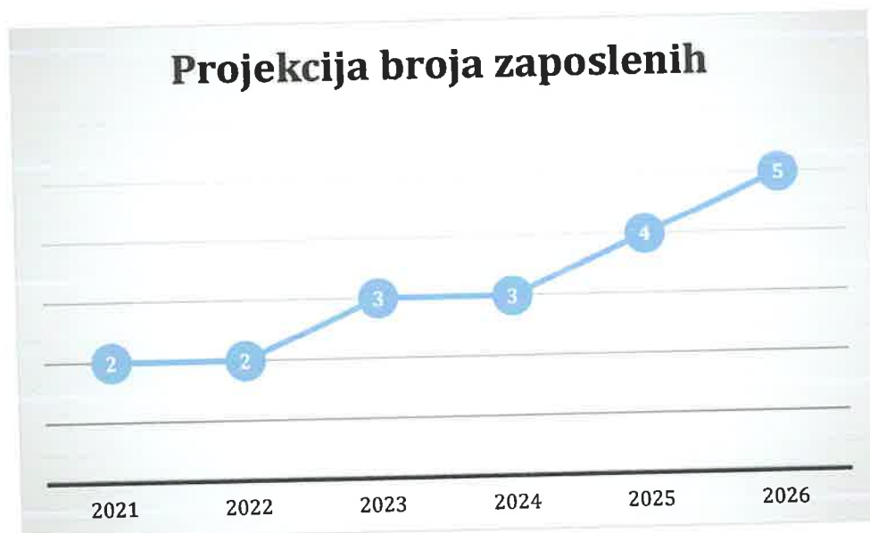
Grafički prikaz: Plan kretanja broja zaposlenih po godinama