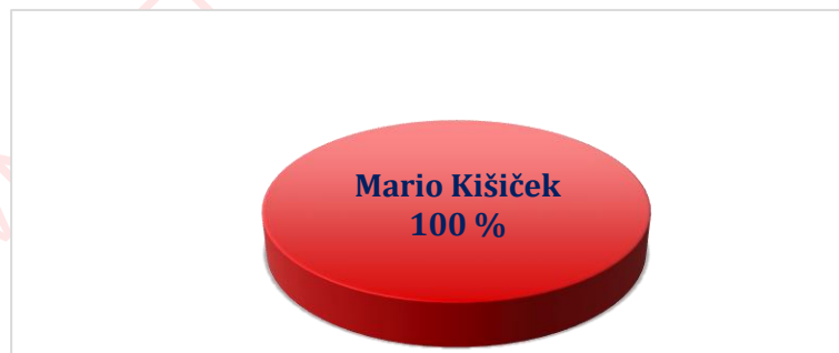
Vlasnička struktura prije i nakon mjera restrukturiranja

Tvrtka KROVNI CENTAR SUPER MARIO d.o.o. je u 100%-tnom privatnom vlasništvu, a vlasnik je Mario Kišiček. Nakon restrukturiranja vlasnička struktura tvrtke neće se mijenjati. U nastavku se nalazi grafički prikaz vlasničke strukture prije i nakon mjera restrukturiranja.