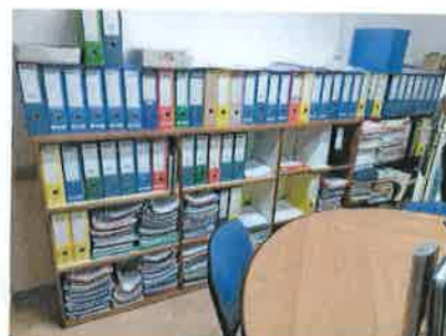
Ad 3 Stalaža drvena