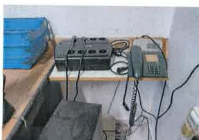
Ad 6 Stalak za telefon