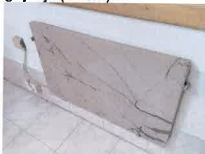
Ad 2 Mramorne ploce za grijanje (2 kom)