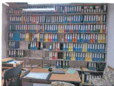
Ad 8 Polica I