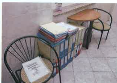
Ad 4 Namještaj za predsoblje