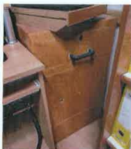
Ad 2 Kasa