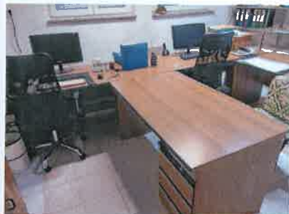
Ad 11 i 12 Uredske stolice i Stolovi