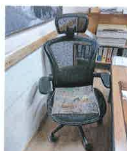
Ad 9 Stolica uredska