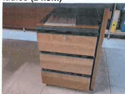
Ad 13 Uredski ladičar sa 3 ladice (2 kom)