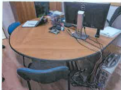
Ad 7, 15 i 16 Monitor LCD, Uredski stol i Stolica