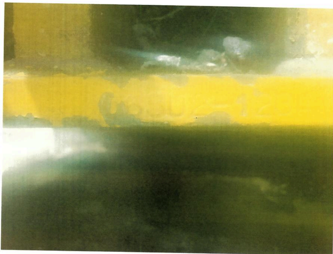
Slika br. 7