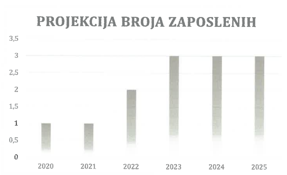
Grafički prikaz: Plan kretanja broja zaposlenih po godinama

Planirano kretanje broja zaposlenih prikazano je grafičkim prikazom u nastavku, a odnosi se na period od 2020. g. - 2025. g. Grafički prikaz prikazuje povećanje broja zaposlenih u odnosu na prethodne godine (prosječan broj zaposlenih) što je rezultat restrukturiranja tvrtke i povećanja prodaje do kojeg je došlo kroz projekciju budućeg poslovanja tvrtke.