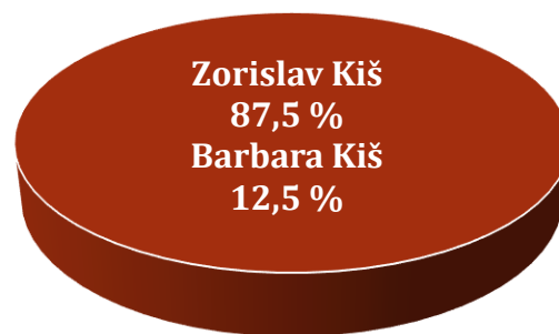
Vlasnička struktura prije i nakon mjera restrukturiranja

Tvrtka ABUNDAN d.o.o. je 87,5% u vlasništvu Zorislava Kiša i 12,5% u vlasništvu Barbare Kiš (maloljetna). Nakon restrukturiranja vlasnička struktura tvrtke neće se mijenjati. U nastavku se nalazi grafički prikaz vlasničke strukture prije i nakon mjera restrukturiranja.