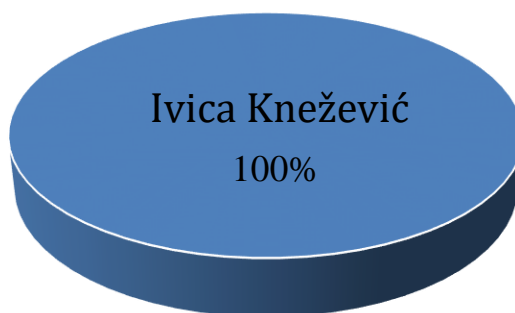
Vlasnička struktura prije i nakon mjera restrukturiranja

Tvrtka I.G.K. RECIKLAŽA d.o.o. je u 100%-tnom privatnom vlasništvu, a vlasnik je Ivica Knežević. Nakon restrukturiranja vlasnička struktura tvrtke neće se mijenjati. U nastavku se nalazi grafički prikaz vlasničke strukture prije i nakon mjera restrukturiranja.