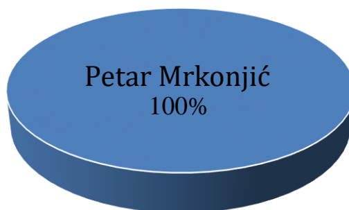
Vlasnička struktura prije i nakon mjera restrukturiranja

Tvrtka M-PACK d.o.o. je u 100%-tnom privatnom vlasništvu, a vlasnik je Petar Mrkonjić. Nakon restrukturiranja vlasnička struktura tvrtke neće se mijenjati. U nastavku se nalazi grafički prikaz vlasničke strukture prije i nakon mjera restrukturiranja.