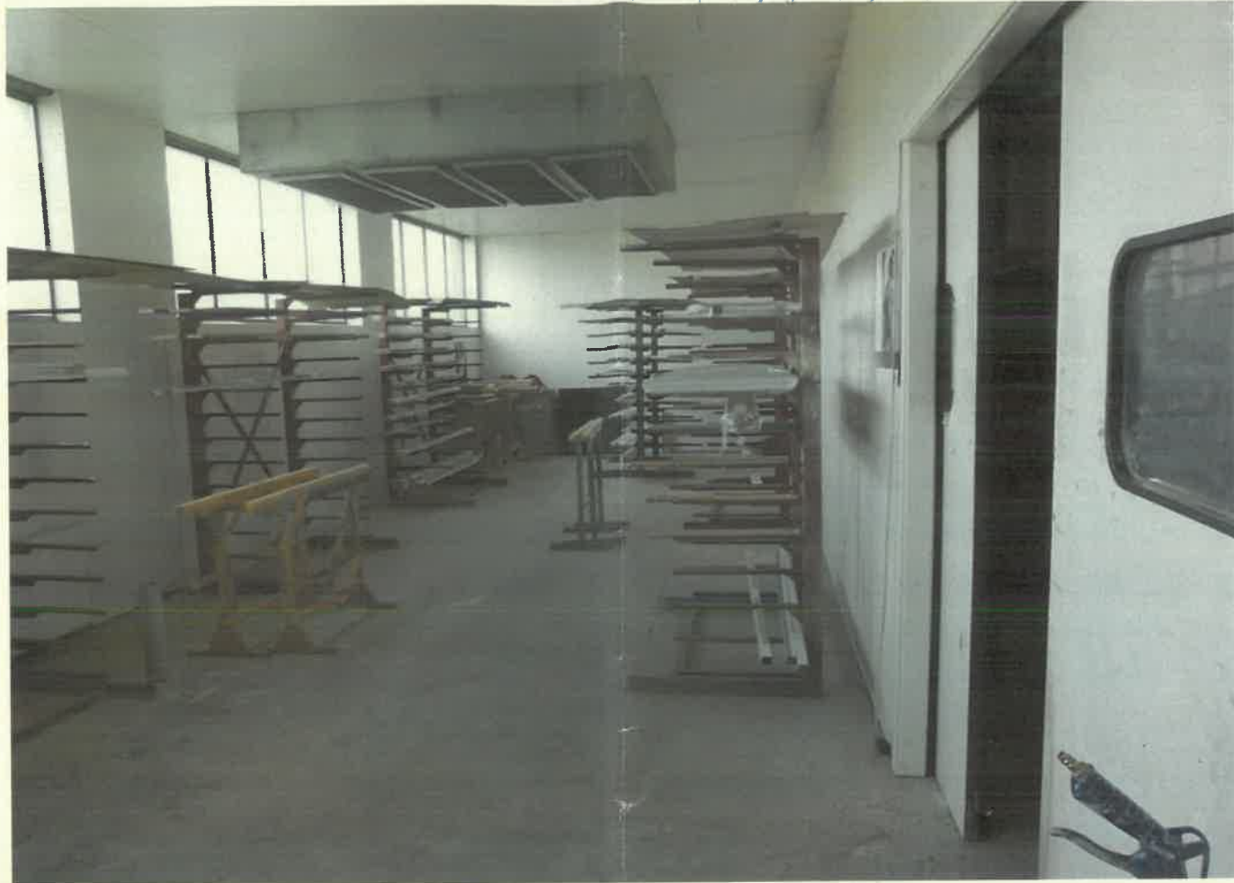
Prehoda od panela s desne strane 5446