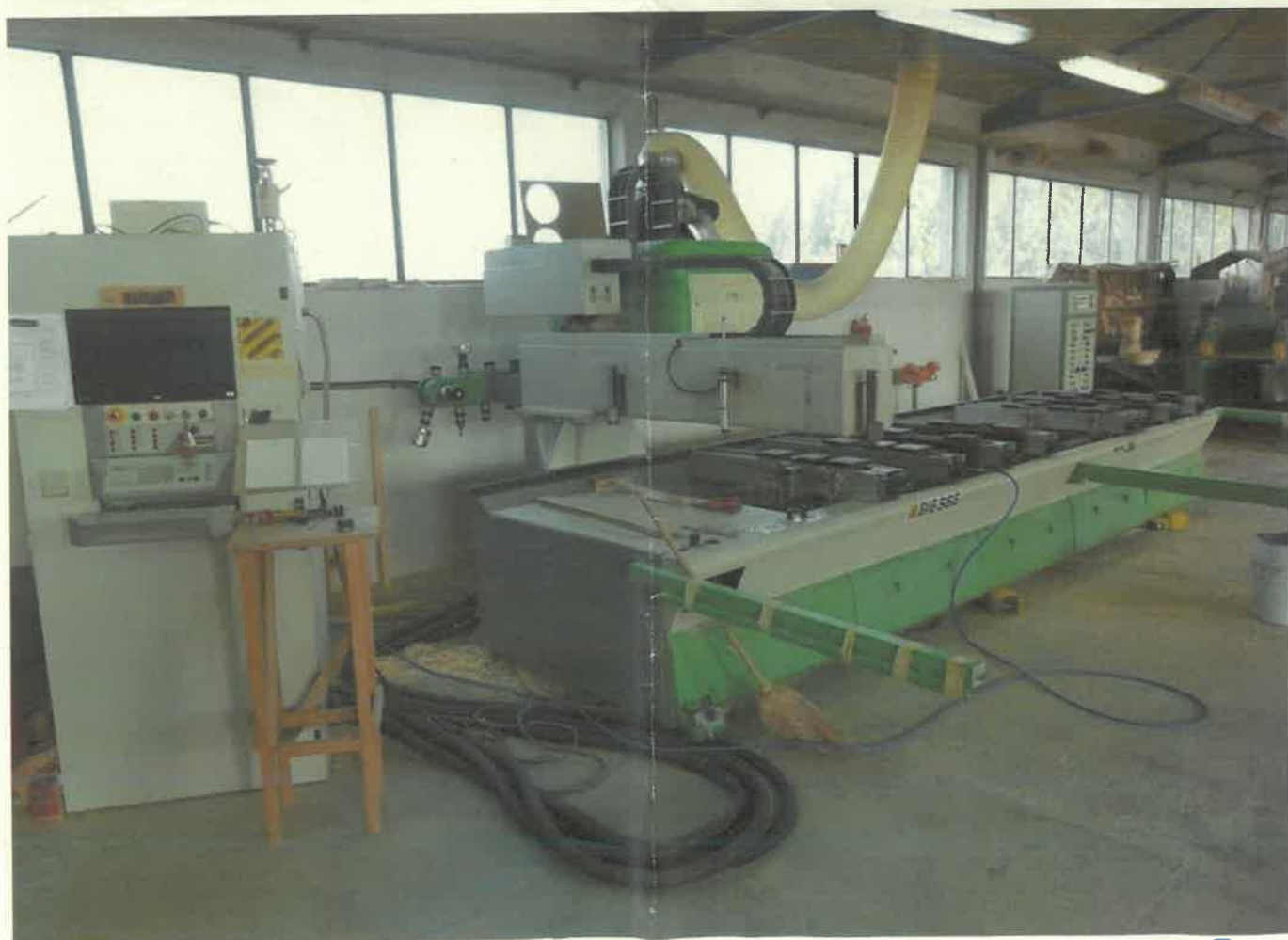
CNC DIESE ITALY ROVER