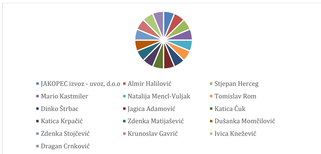
Vlasnička struktura prije i nakon mjera restrukturiranja

Momčilović, Zdenka Stojčević, Krunoslav Gavrić, Ivica Knežević i Dragan Crnković. Nakon restrukturiranja vlasnička struktura tvrtke neće se mijenjati. U nastavku se nalazi grafički prikaz vlasničke strukture prije i nakon mjera restrukturiranja.