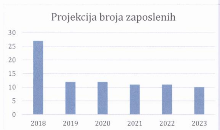
Grafički prikaz: Plan kretanja broja zaposlenih po godinama

Planirano kretanje broja zaposlenih prikazano je grafičkim prikazom u nastavku, a odnosi se na period od 2018. g. - 2023. g. Grafički prikaz prikazuje povećanje broja zaposlenih u odnosu na prethodne godine (prosječan broj zaposlenih) što je rezultat restrukturiranja tvrtke i povećanja prodaje do kojeg je došlo kroz projekciju budućeg poslovanja tvrtke.