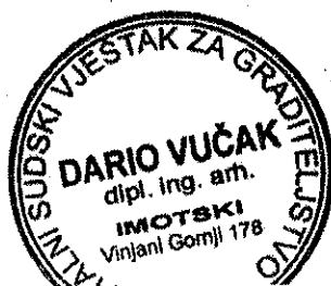
Dario Vučak dipl. ing. arh. i stalni sudski vještak 4 Su-885/2016