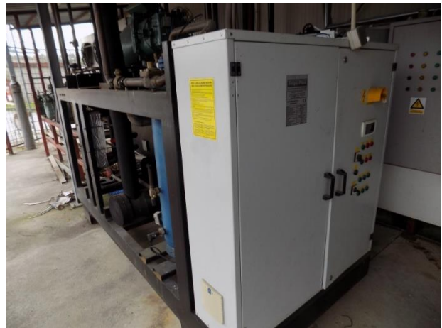
2. Kompresor Frigokor komplet