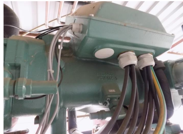
6. Instalacija grigokor kompresor

Rješenjem Županijskog suda u Bjelovaru o imenovanju br. 4 Su-406/98, od 14.veljače 2017. godine, imenovan za: „Stalnog sudskog vještaka strojarске struke“