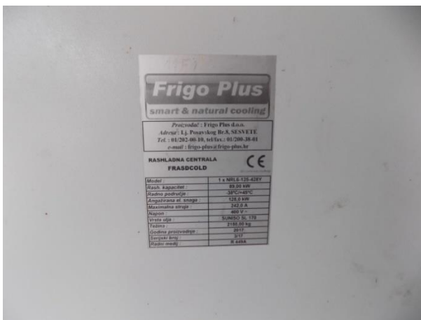
5. Tehnički podaci kompresora