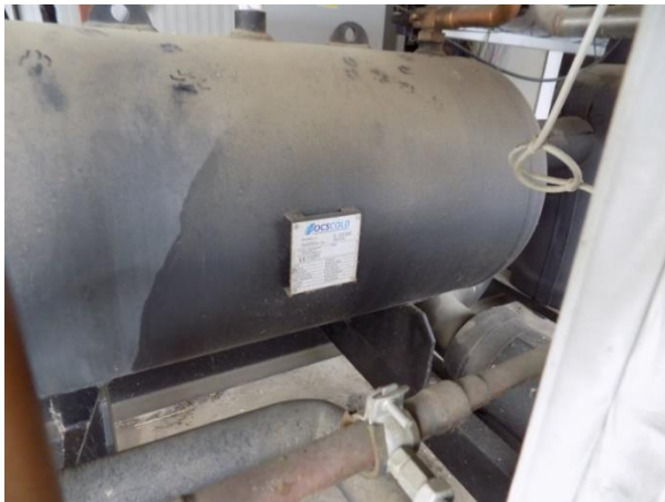
3. Rezervoar kompresora