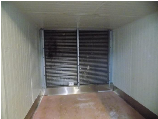
1. Rashladna komora