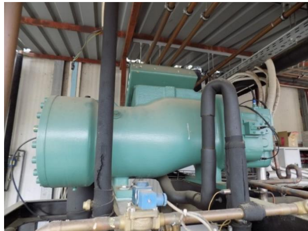
4. Frigokor kompresor