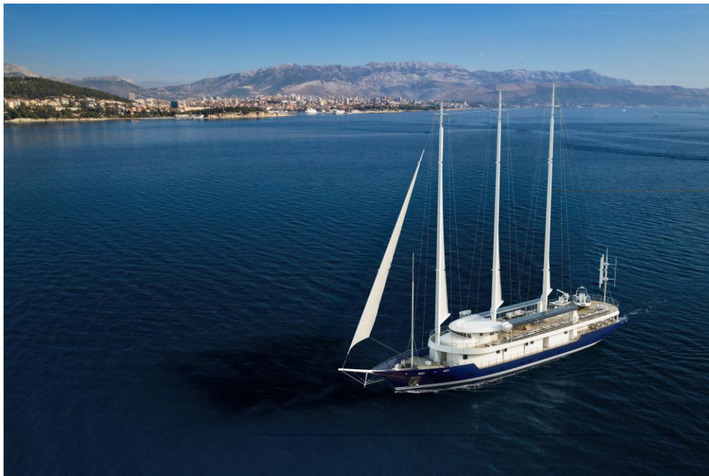
Slika 8 – Zero emission jedrenjak

U području energetske učinkovitosti i čistije proizvodnje, provodimo sljedeće projekte sufinancirane sredstvima EU: