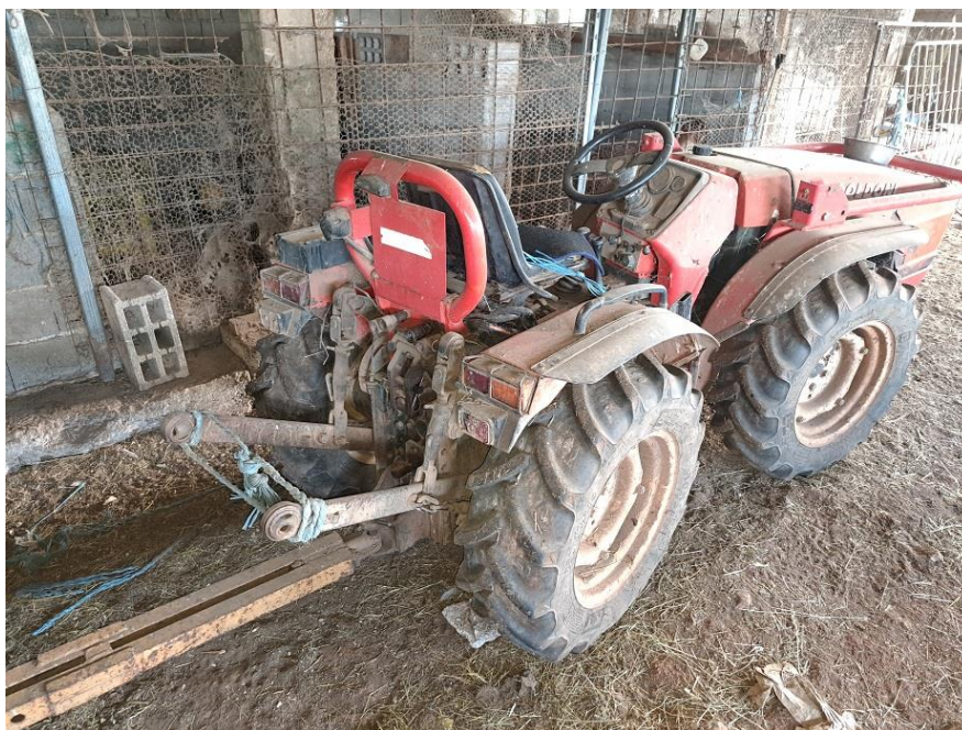
Sl. 71 Traktor GOLDONI MAXTER 60 SN