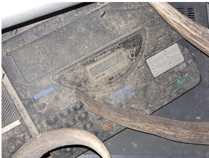
Sl. 58 HP laserski pišač, zatečen fax uređaj Panasonic