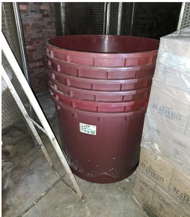
Sl. 40 Mašteli za grožđe i vino