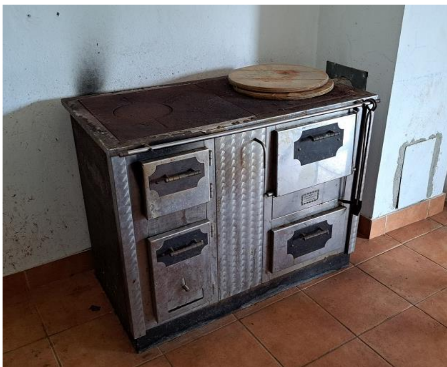
Sl. 41 Štednjak-šporet na drva