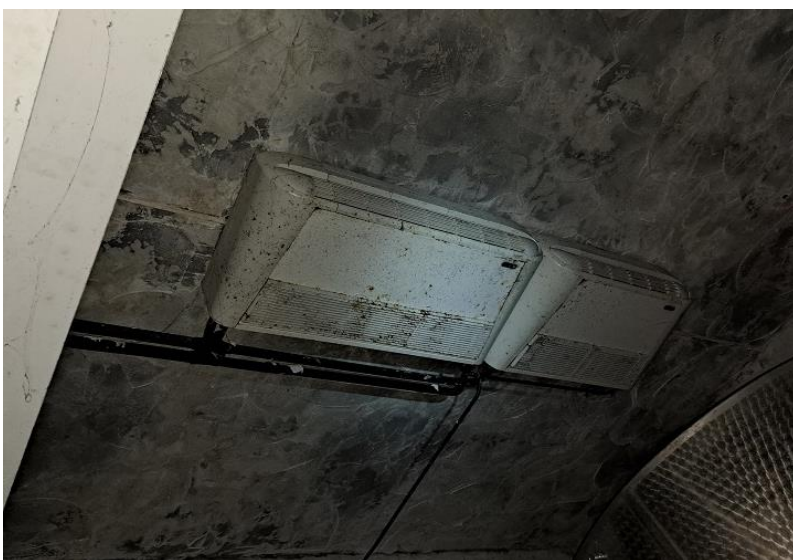
Sl. 10 Rashladni uređaj podruma i bačve, unutarnja jedinica