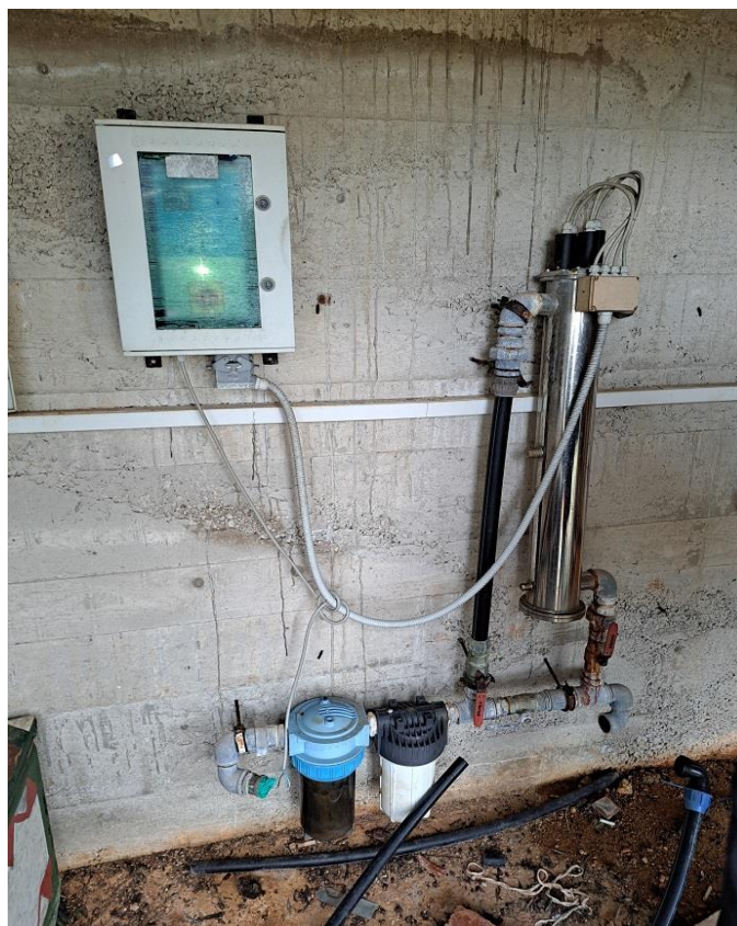
Sl. 30 Aparat za pročišćavanje vode