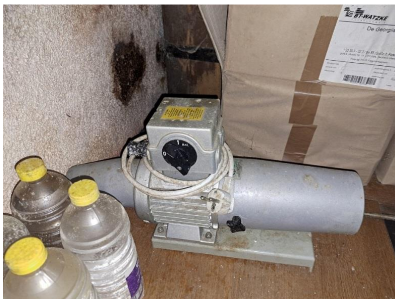
Sl. 22 Čepilica za Poly kapice