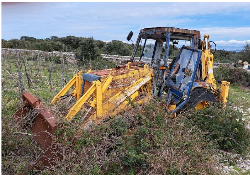
Sl. 77 Radni stroj CASE POCLAIN 580K Turbo, 1995.g.