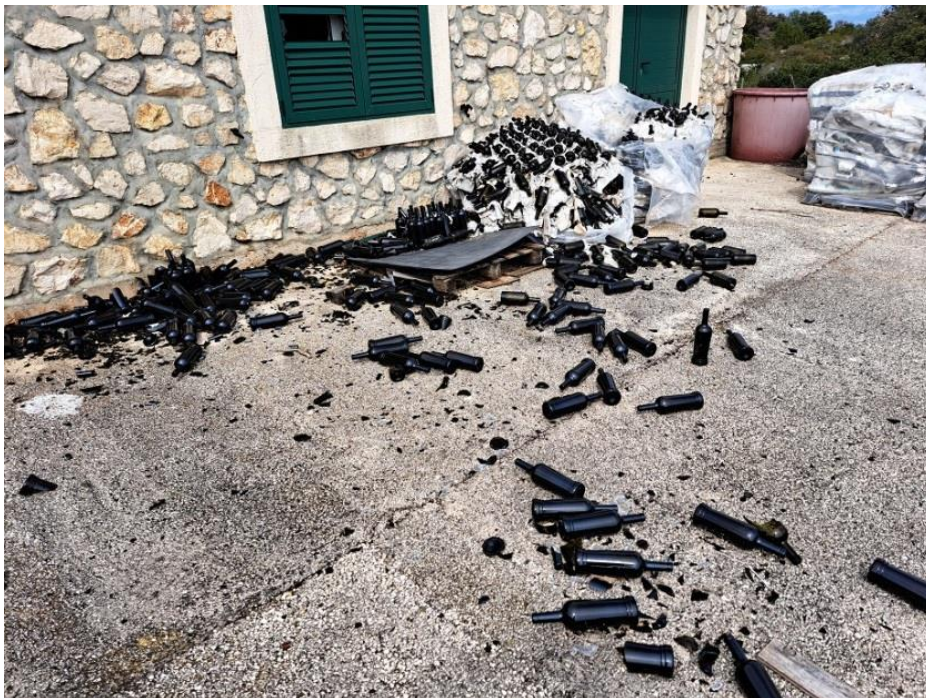
Sl. 46 Boce za vino 0,75 lit.