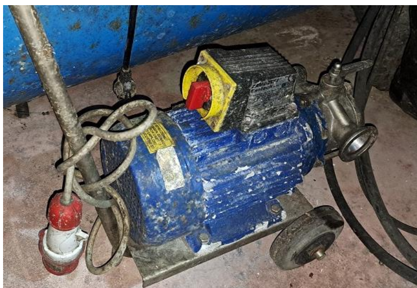
Sl. 24 Pumpa Zambelli T-40 električna