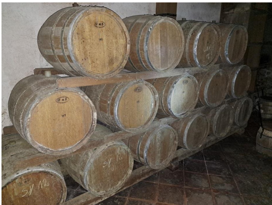
Sl. 19 Hrastove bačve za vino- Barrique