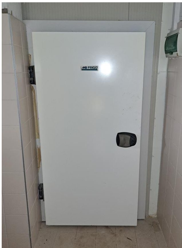
Sl. 31 Rashladna komora MB Frigo