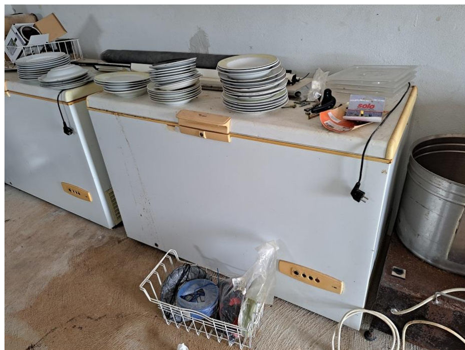
Sl. 36 Zamrzivači AFG5430