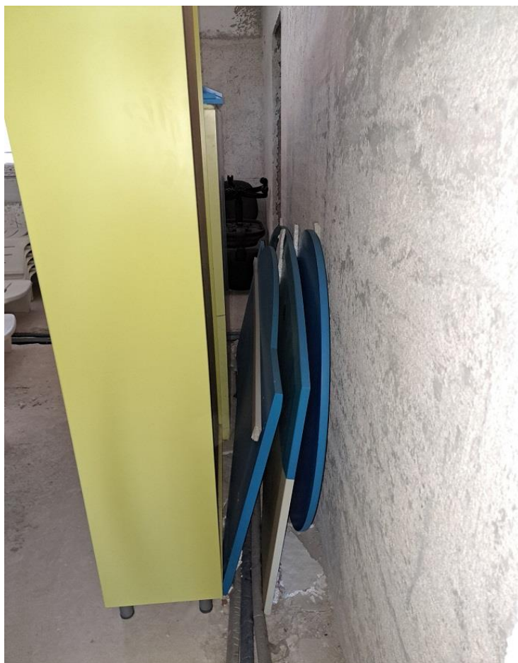
Sl. 59 Radni stol