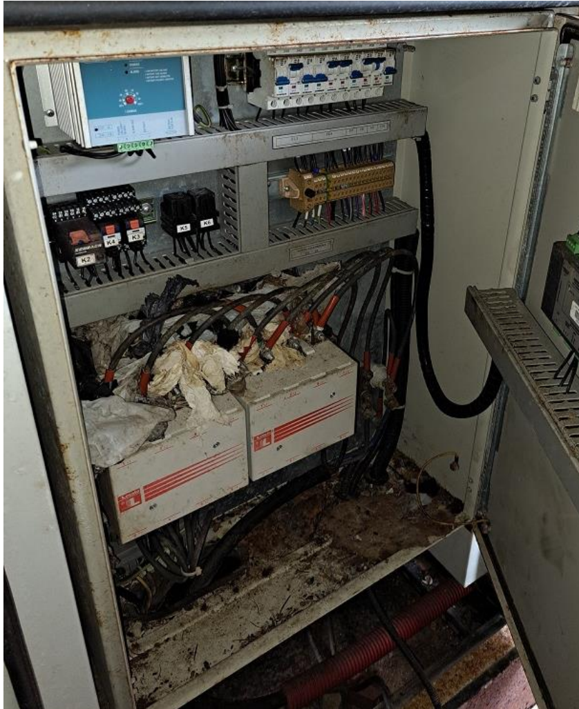
Sl. 3 Upravljački sklop Agregat Iveco EO 80162- ZPQ100.AQ1B, 80kW