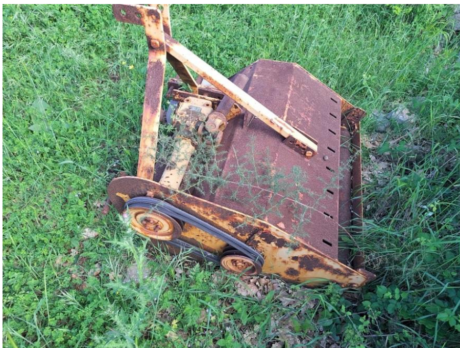
Sl. 75 Malčer Berti BF095