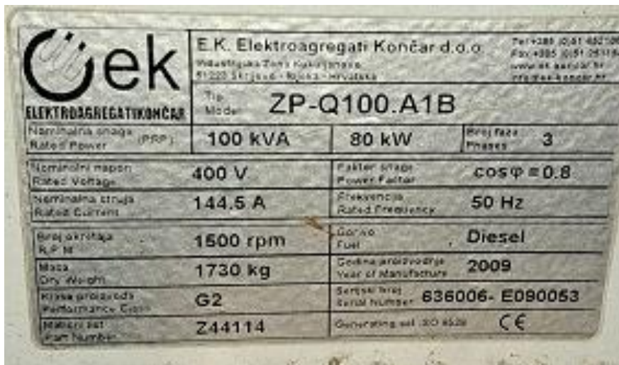
Sl. 2 Pločica, Agregat Iveco EO 80162- ZPQ100.AQ1B, 80kW