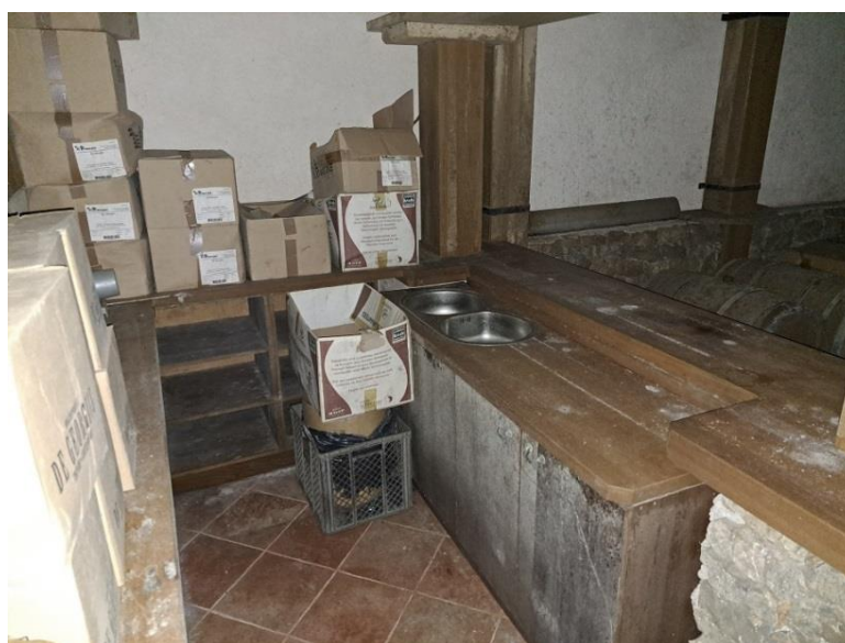
Sl. 16 Komplet oprema-kušaona vina, šank, unutarnji dio