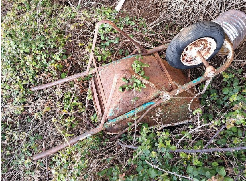
Sl. 27 Karijola