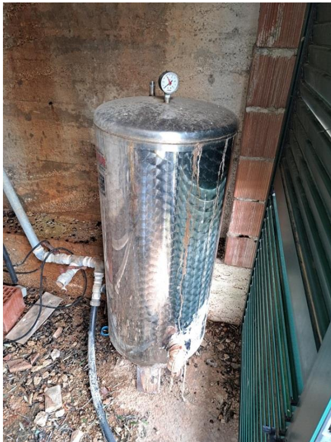
Sl. 29 Hidroforska posuda