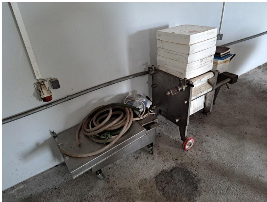
Sl. 35 Komplet postrojenje za uljaru