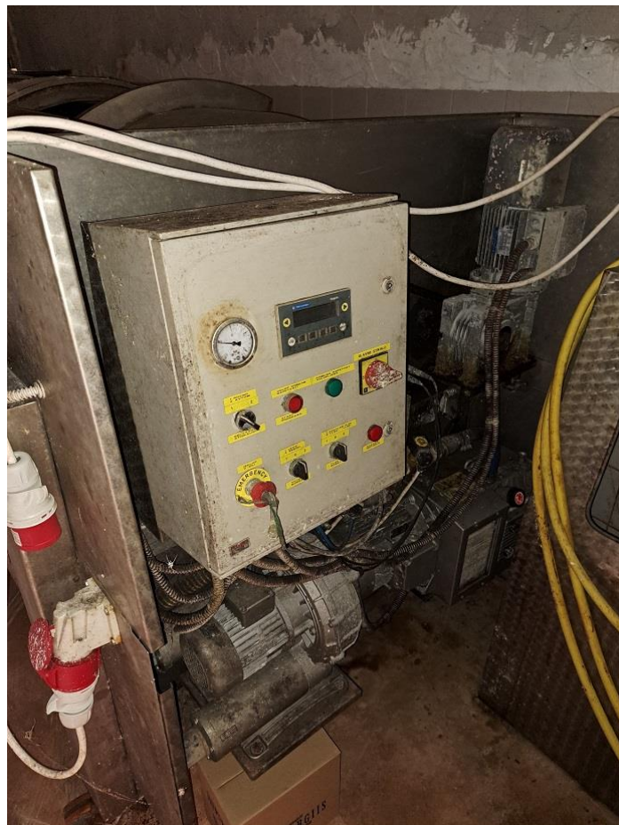
Sl. 8 Upravljačka ploča, Presa za grožđe 2200 lit. automatska