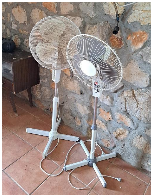
Sl. 43 Rashladni ventilator