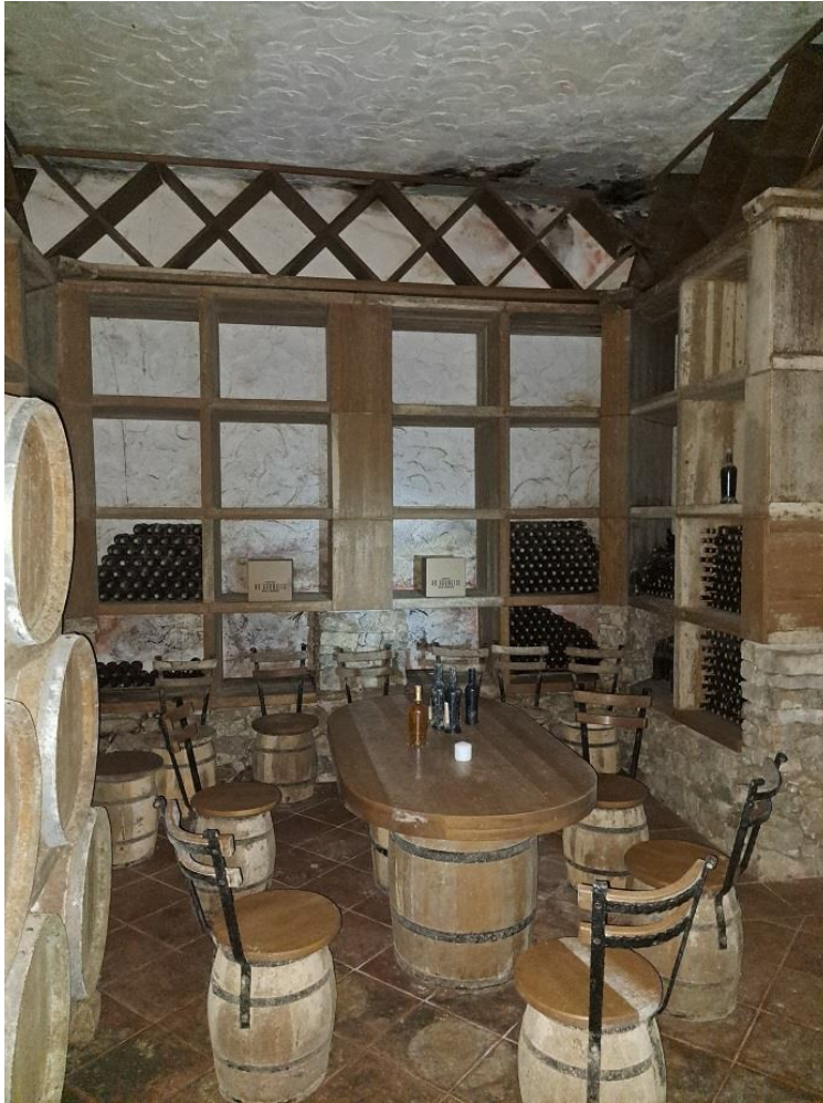
Sl. 17 Komplet oprema-kušaona vina, prostor za goste