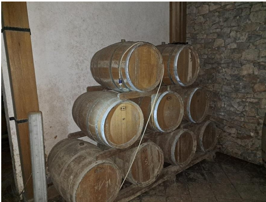
Sl. 18 Hrastove bačve za vino- Bariqqe