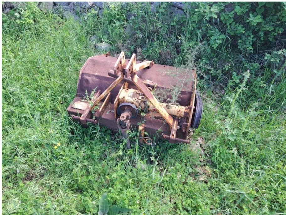
Sl. 76 Malčer Bertl BF095