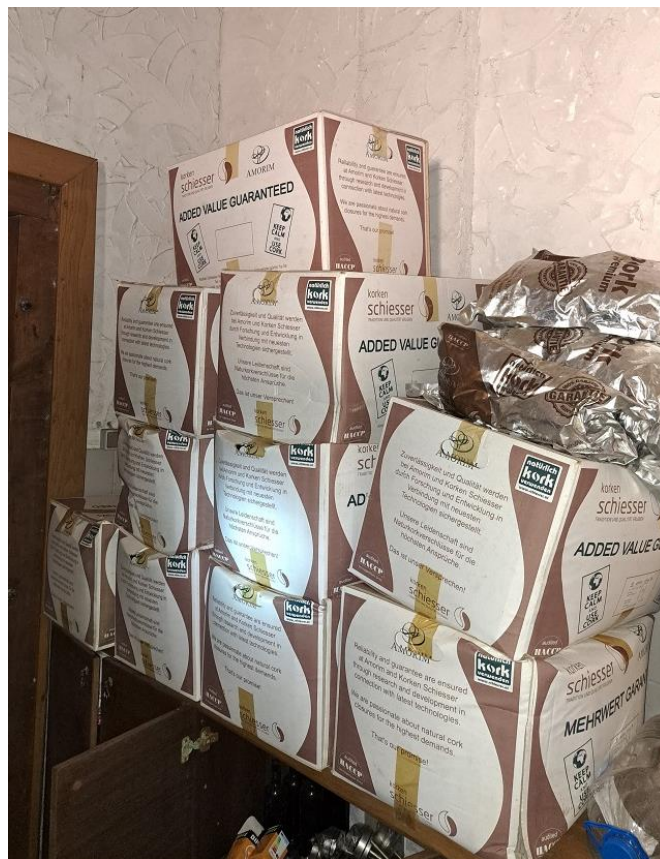
Sl. 49 Čepovi za boce 0,75 -pluto