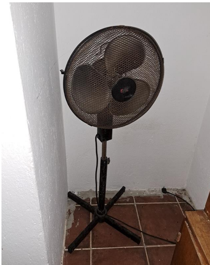
Sl. 42 Rashladni ventilator