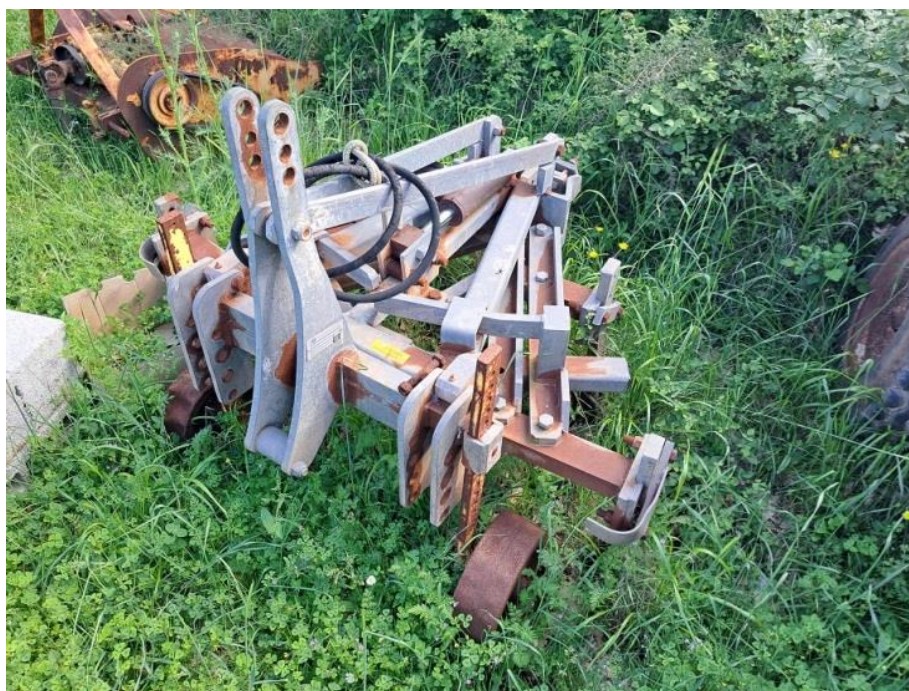
Sl. 73 Plug petoredni