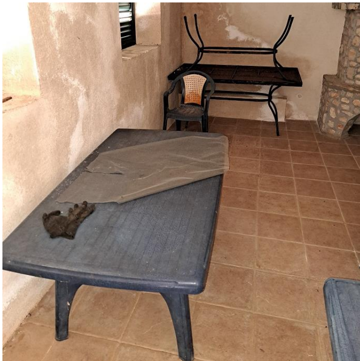
Sl. 54. Plastični i metalni stolovi