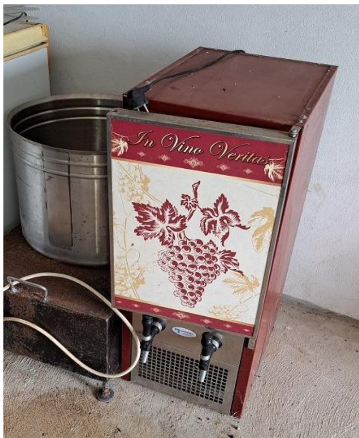
Sl. 20 Točionik vina Berg