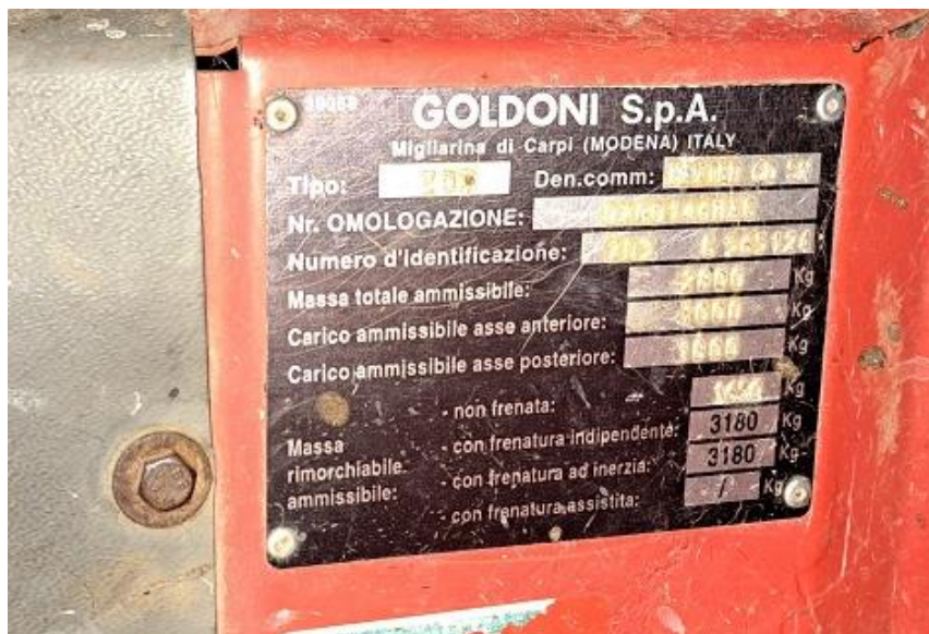
Sl. 72 Traktor GOLDONI MAXTER 60 SN, pločica sa serijskim brojem