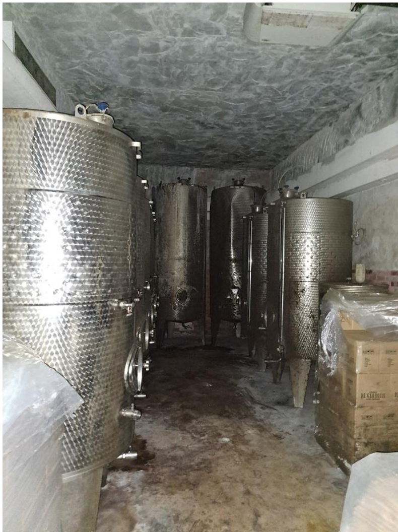
Sl. 12 Inox bačve za vino