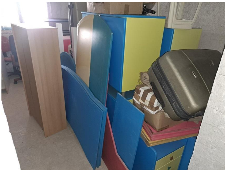
Sl. 61 Ormar za registratore te radne ploče za stolove