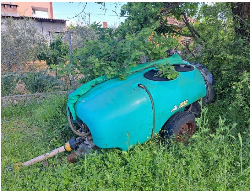
Sl. 66 Atomizer 1000 lit.