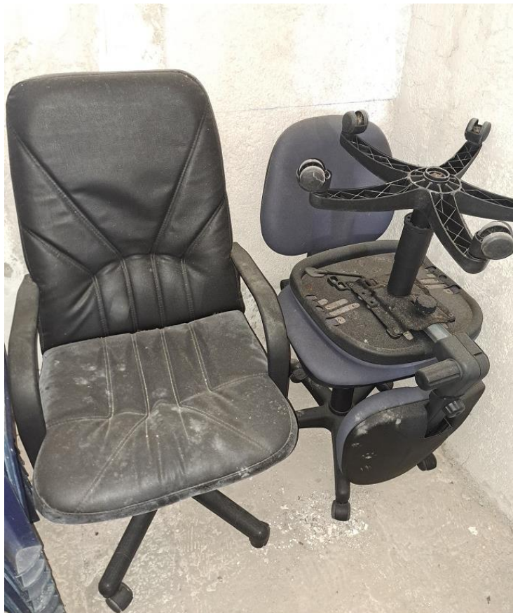
Sl. 64 Radna sjedalica