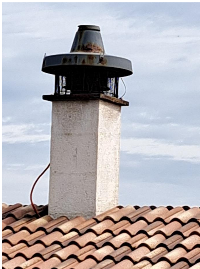
Sl. 37 Ventilator TORRETTE TRM 30 ED 4P