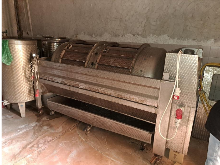
Sl. 7 Presa za grožđe 2200 lit. automatska