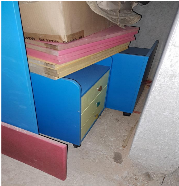
Sl. 62 Ormar za registratore