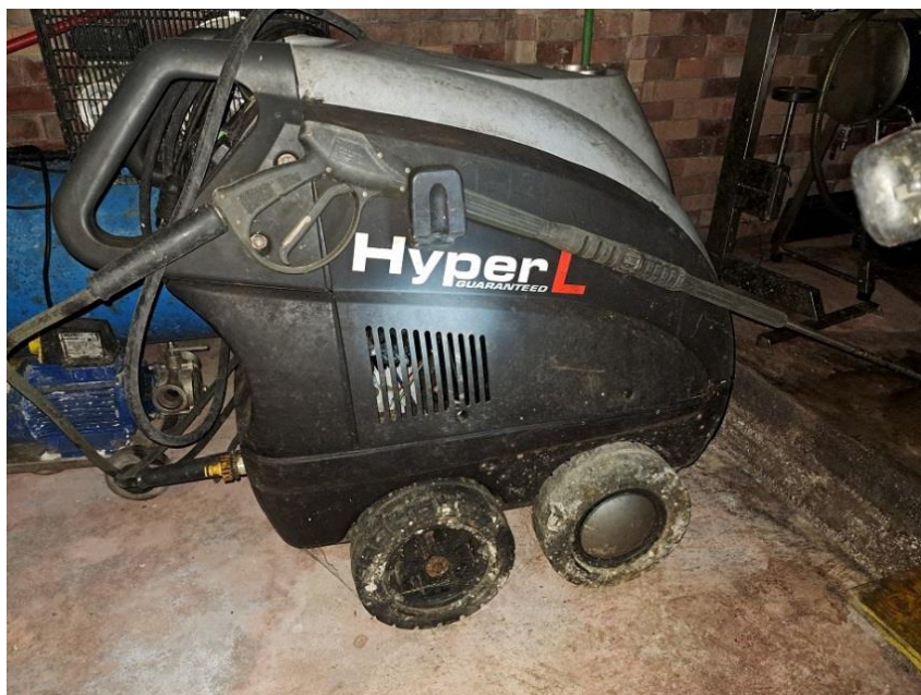
Sl. 23 Čistač Aquatik visokotlačni 1500, zatečen je čistač Hyper L