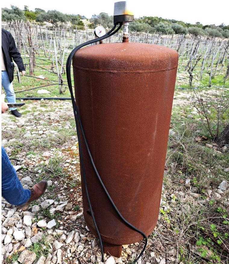
Sl. 28 Hidroforska posuda