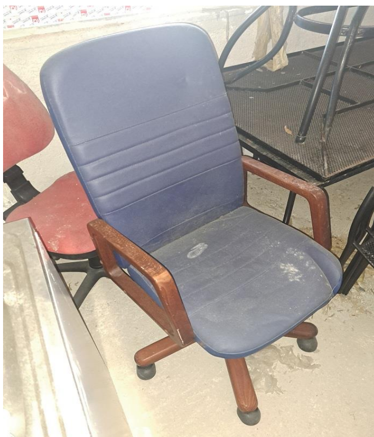
Sl. 65 Radna sjedalica