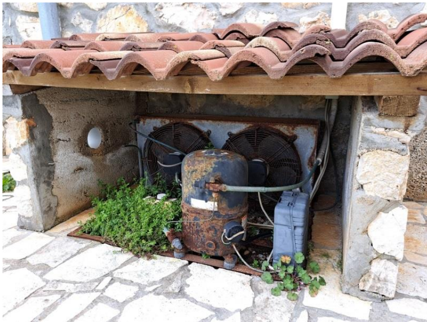
Sl. 33 Vanjska jedinica MB Frigo