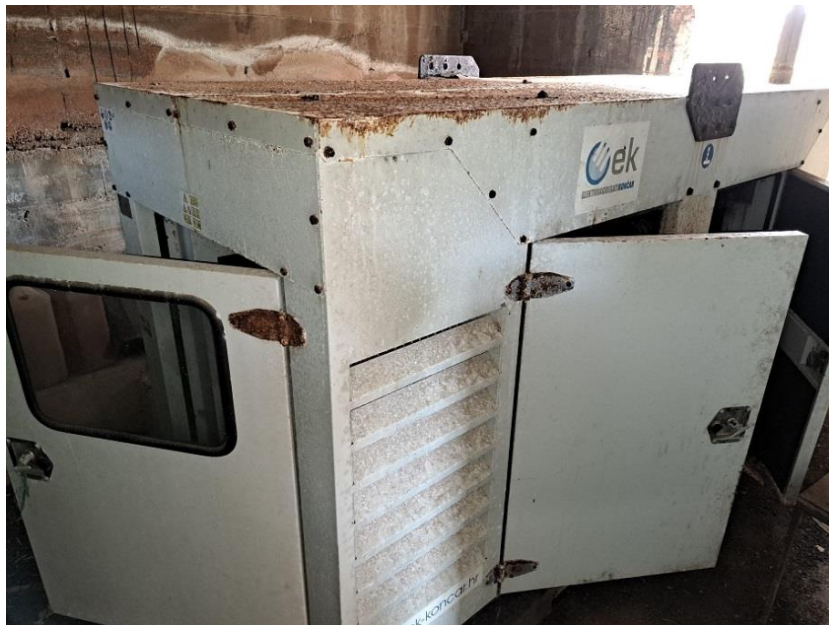
Sl. 4 Agregat Iveco EO 90053-ZP-Q60.B, 48kW, oštećen