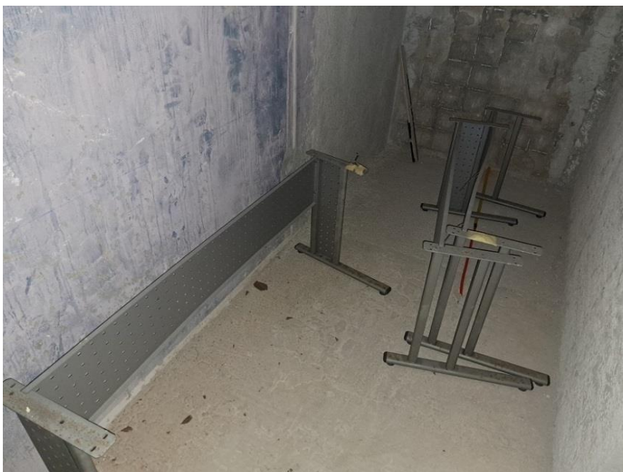
Sl. 60 Radni stol, dio metalne konstrukcije