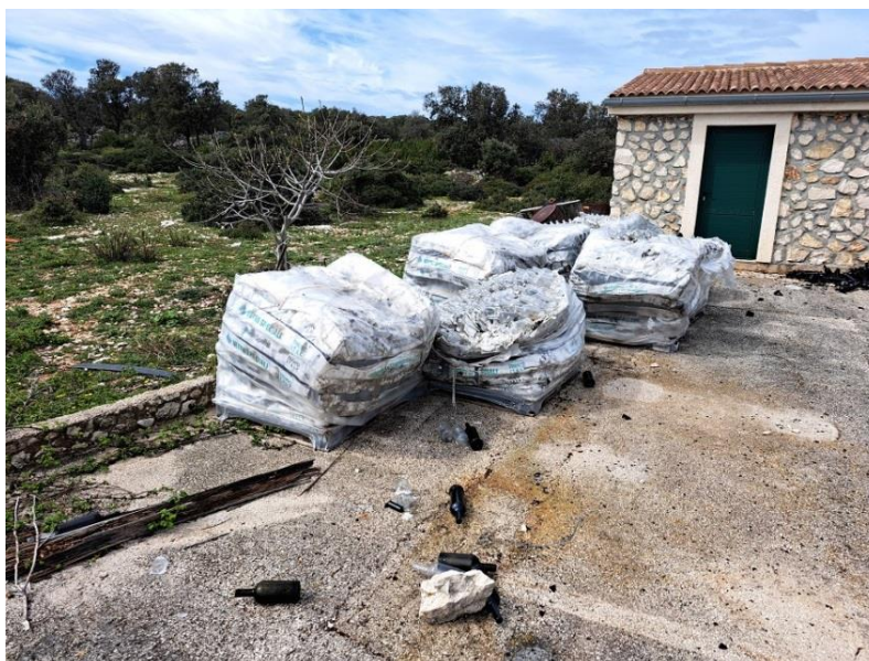
Sl. 45 Boce za vino 0,75 lit.