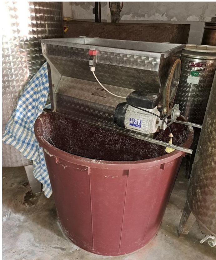
Sl. 38 Muljača za grožđe