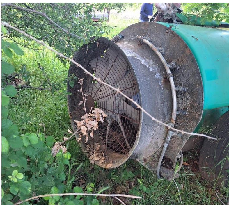
Sl. 67 Atomizer 1000 lit.