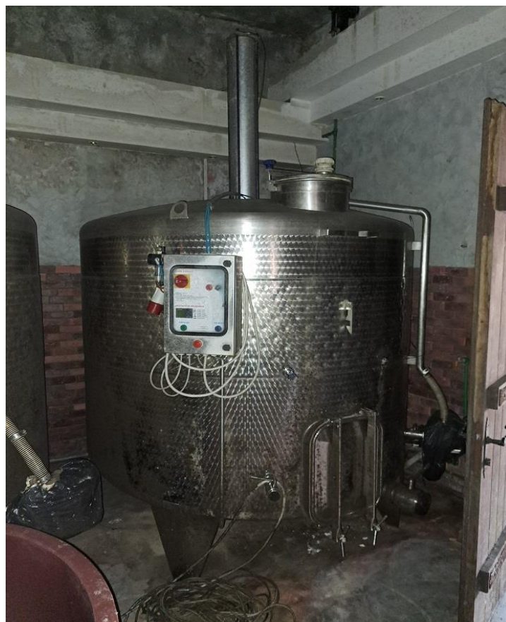
Sl. 14 Inox vinofikatori za vino, 5500 lit, okretni