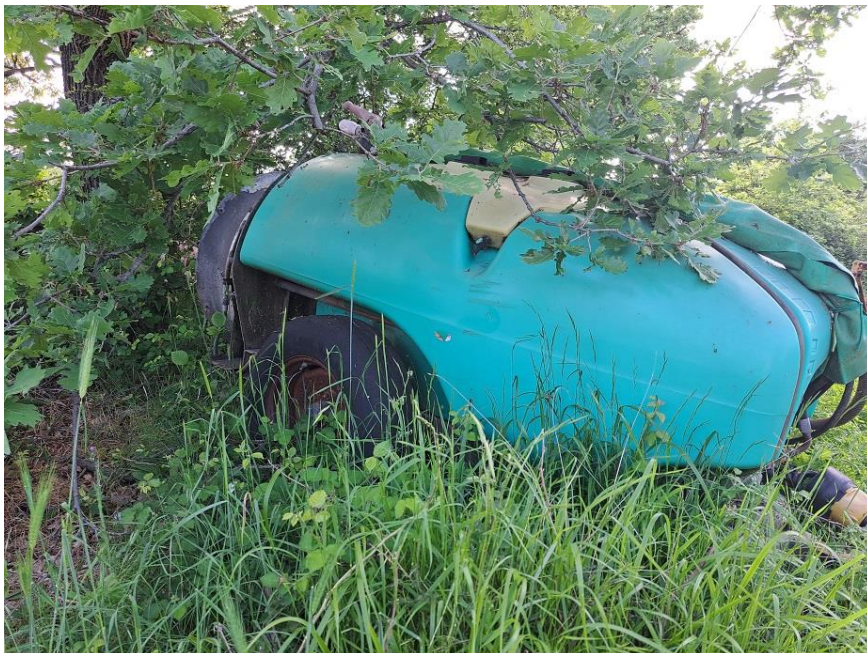
Sl. 68 Atomizer 1000 lit.