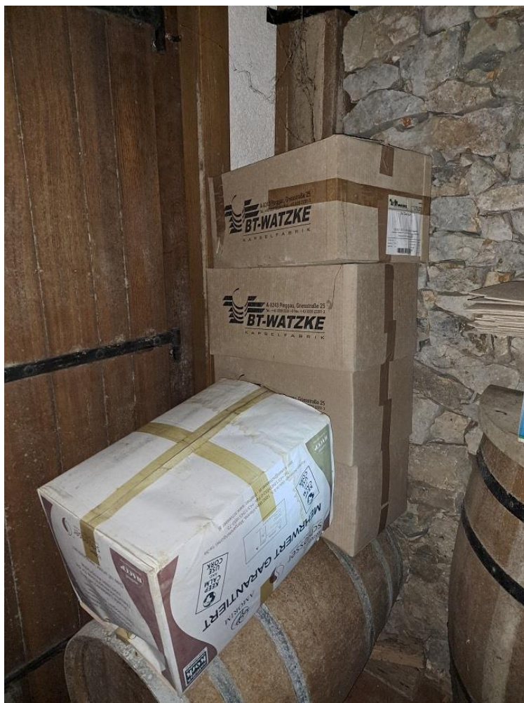
Sl. 50 Kapice za boce Poly