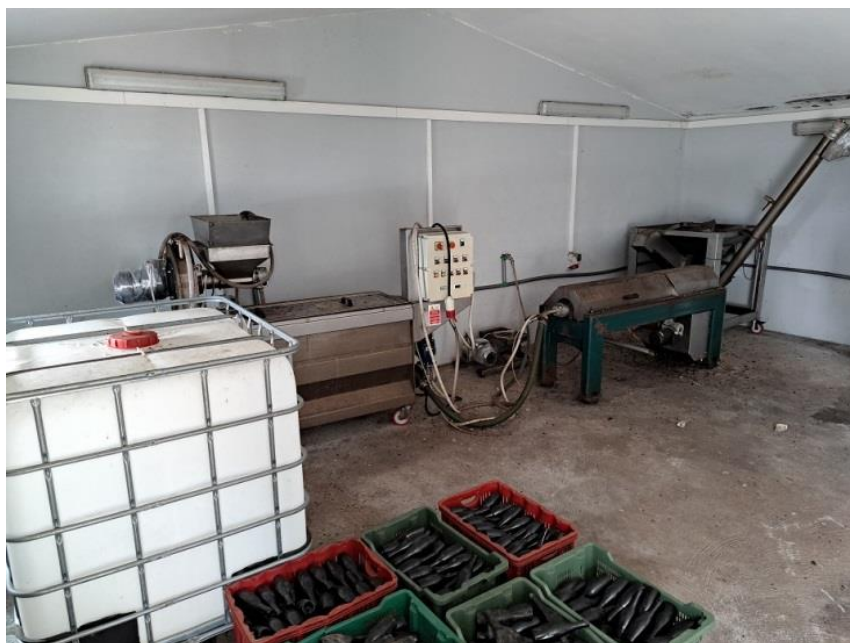
Sl. 34 Komplet postrojenje za uljaru