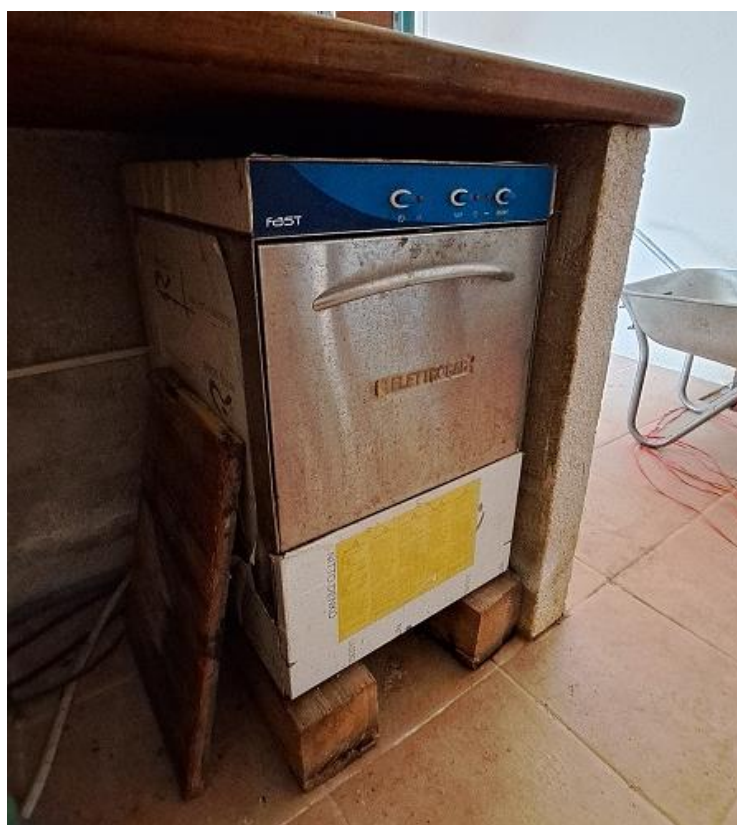
Sl. 37 Perilica čaša ELEKTROBAR F 135H