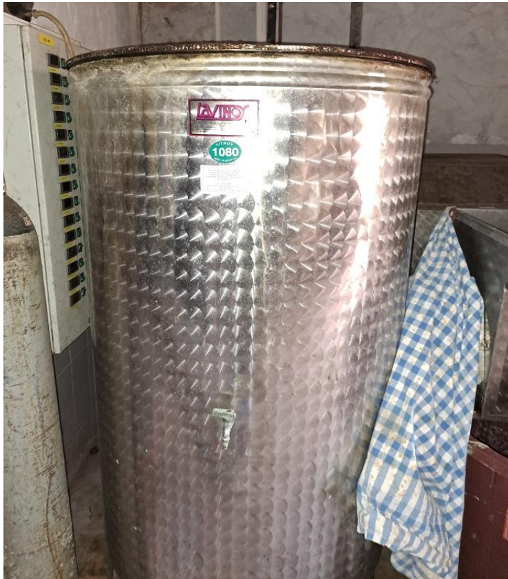
Sl. 13 Posude za vino