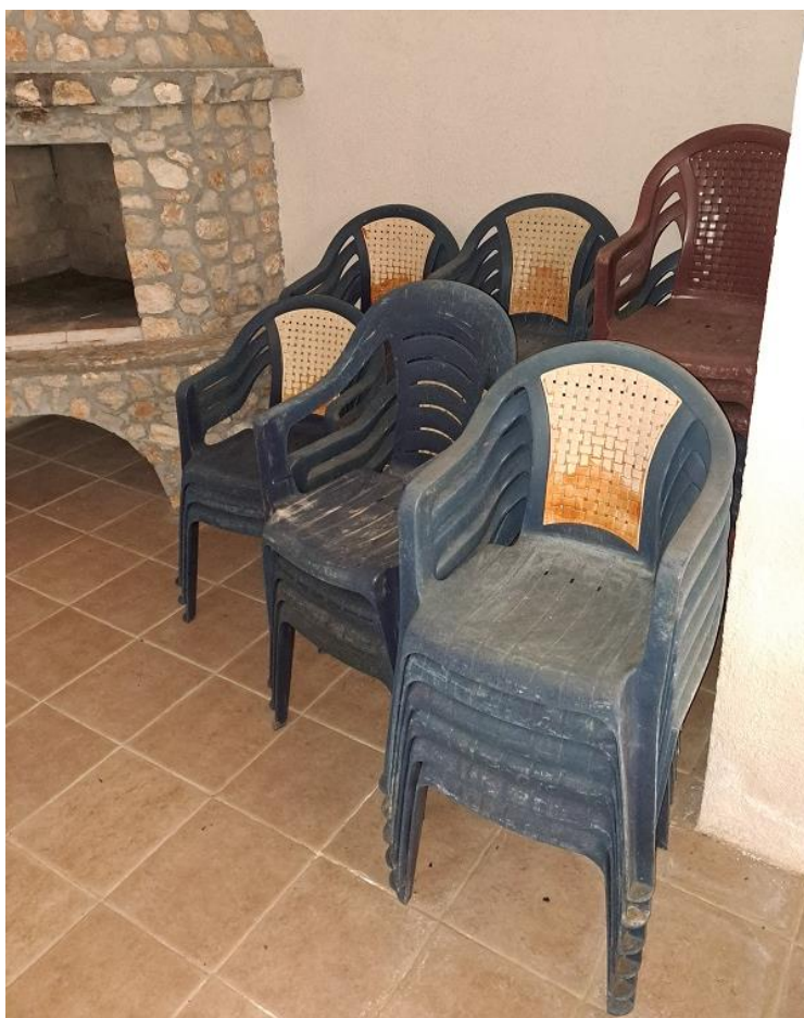
Sl. 55 Plastična sjedalica