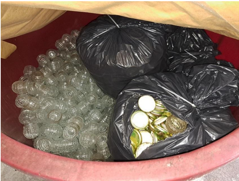
Sl. 48 Bočice za marmeladu