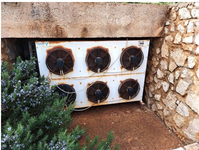
Sl. 9 Rashladni uređaj podruma i bačve, vanjska jedinica