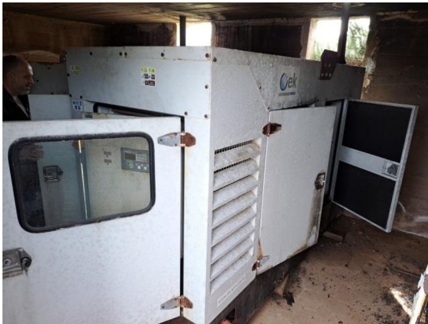
Sl.1 Agregat Iveco EO 80162- ZPQ100.AQ1B, 80kW