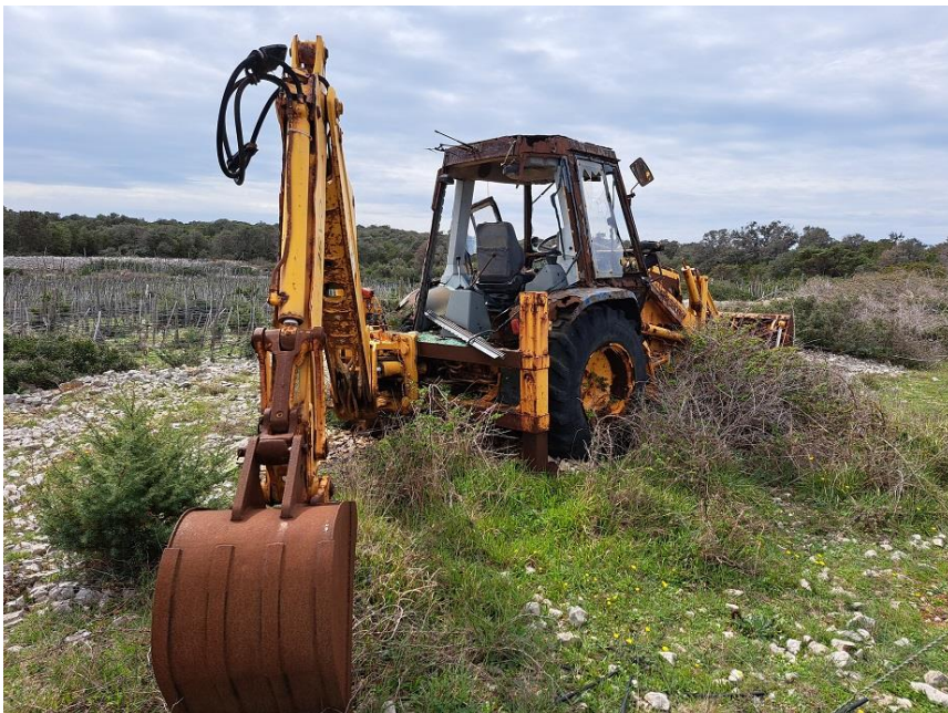
Sl. 78 Radni stroj CASE POCLAIN 580K Turbo, 1995.g.