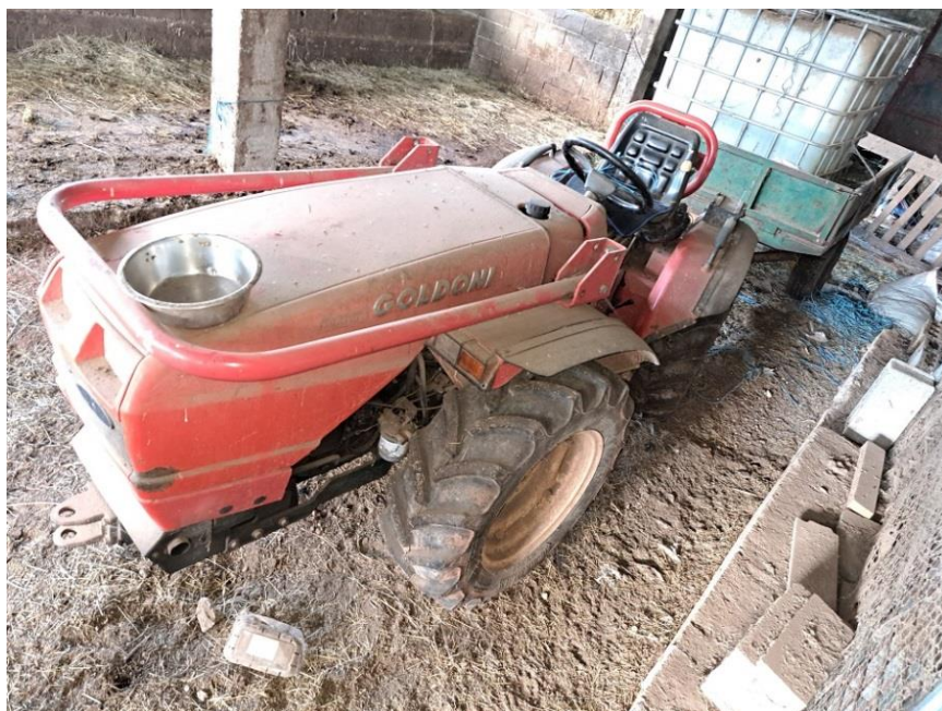
Sl. 69 Traktor GOLDONI MAXTER 60 SN