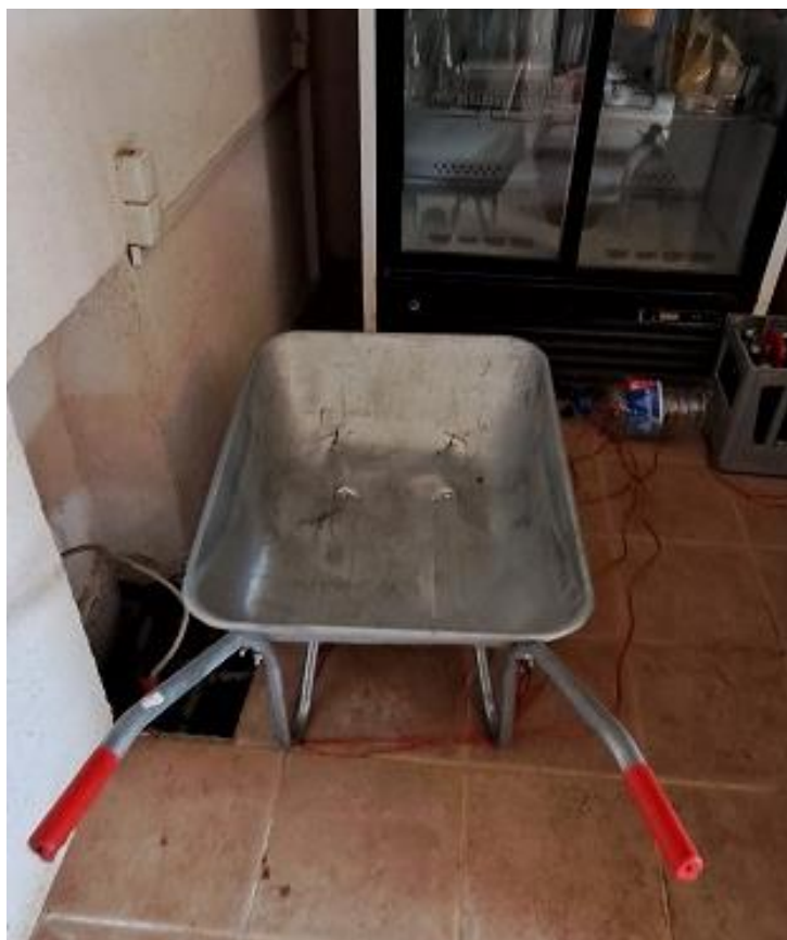
Sl. 26 Karijola