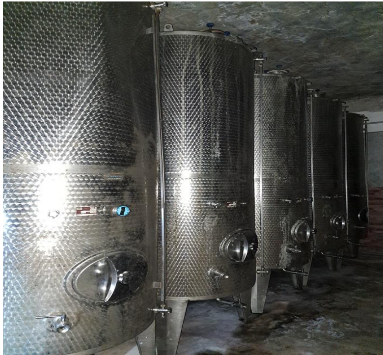
Sl. 11 Inox bačve za vino