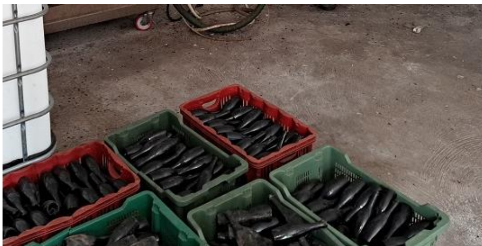
Sl. 47 Boca za ulje 0,,25 lit.