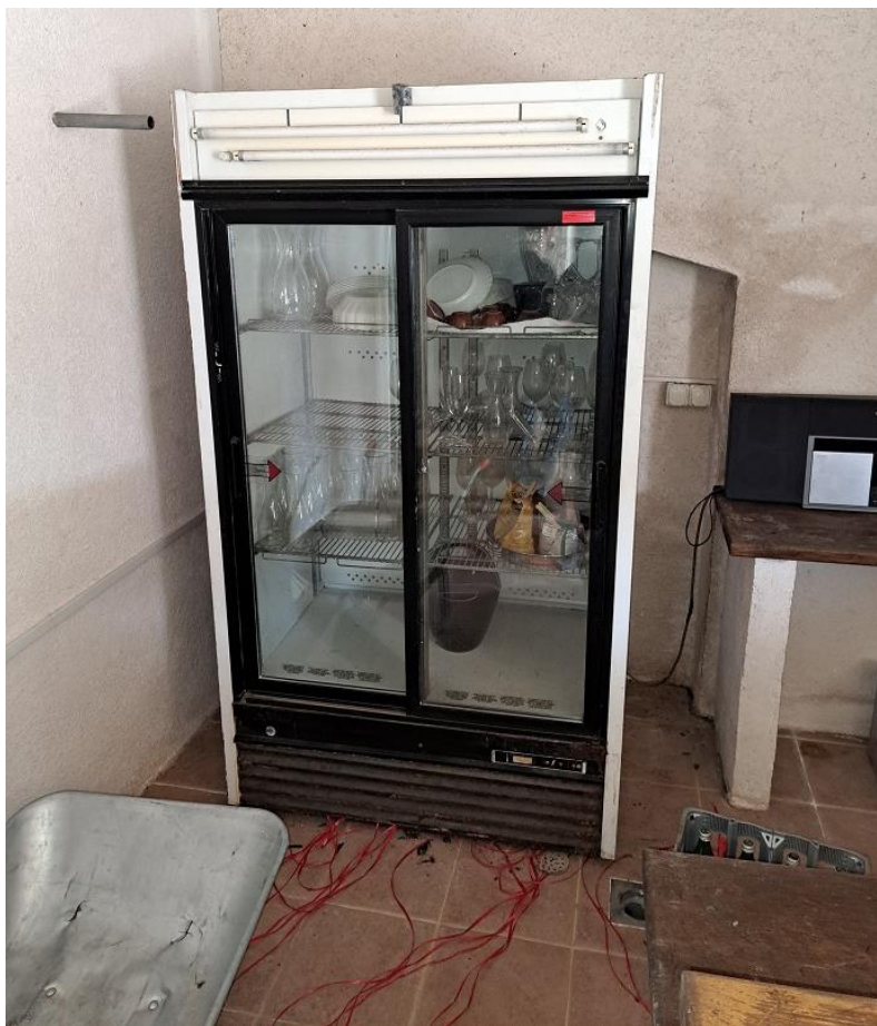
Sl. 44 Rashladni ormar COCA COLA