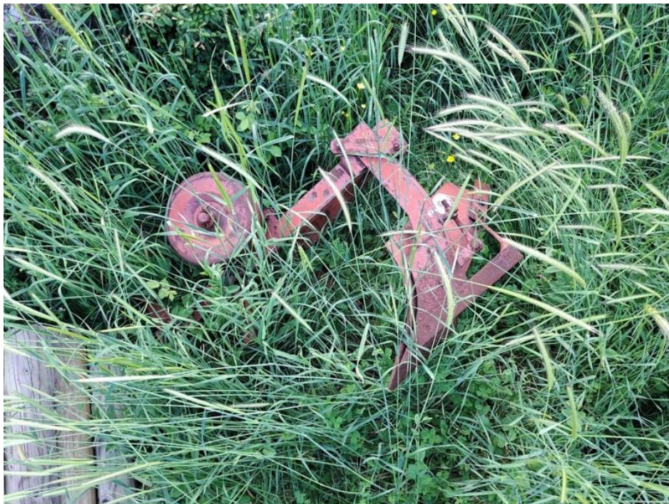
Sl. 74 Plug dvobrazdeni