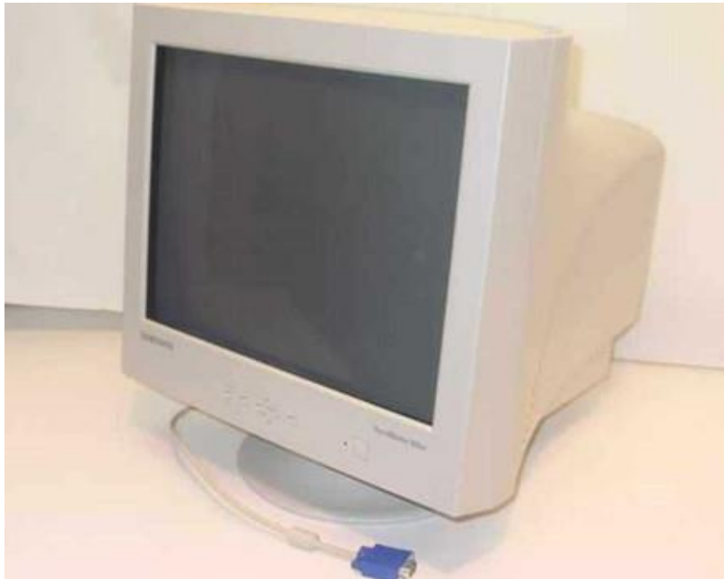
Sl. 56 Monitor Samsung Syncmaster 955DF