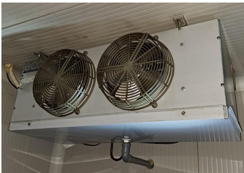
Sl. 32 Unutarnja jedinica, MB Frigo