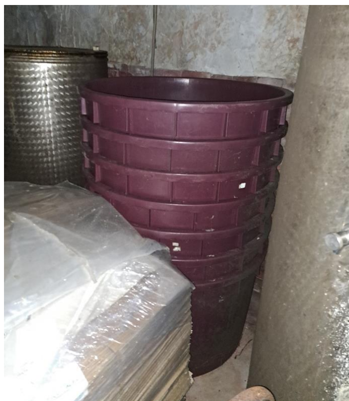
Sl. 39 Mašteli za grožđe i vino