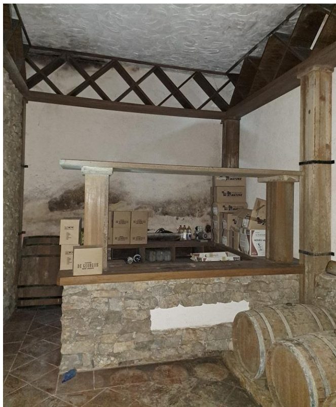
Sl. 15 Komplet oprema-kušaona vina, šank vanjski dio