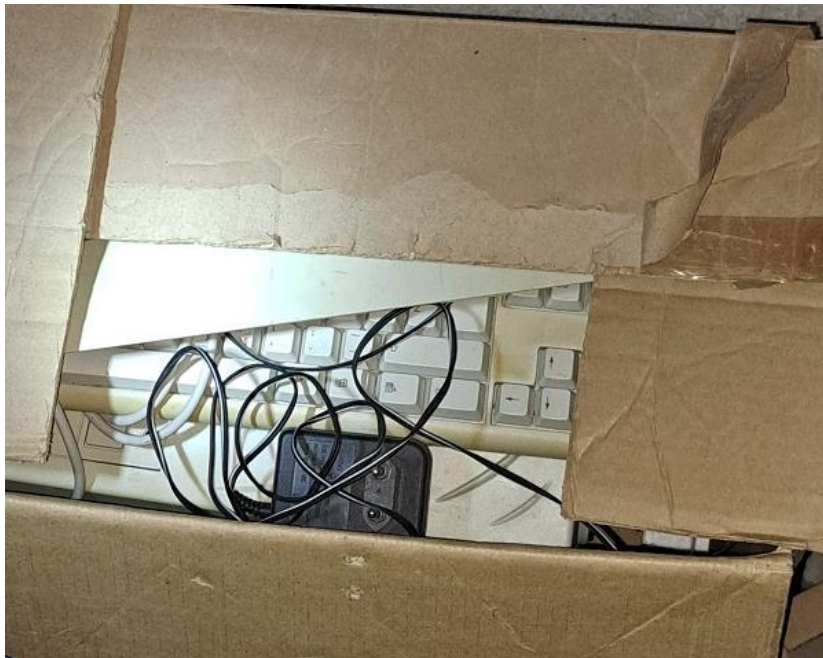
Sl. 57 Računalo kompjuter i tipkovnica