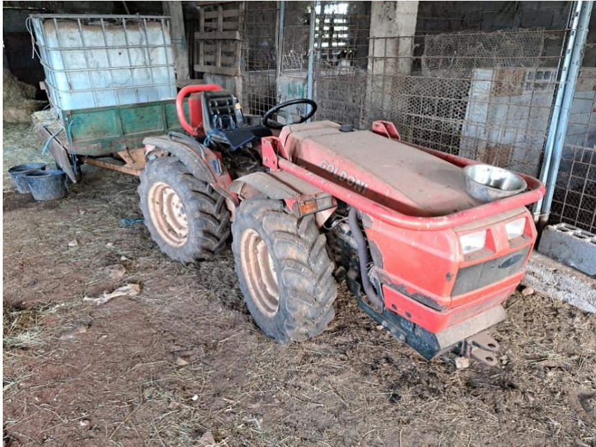
Sl. 70 Traktor GOLDONI MAXTER 60 SN