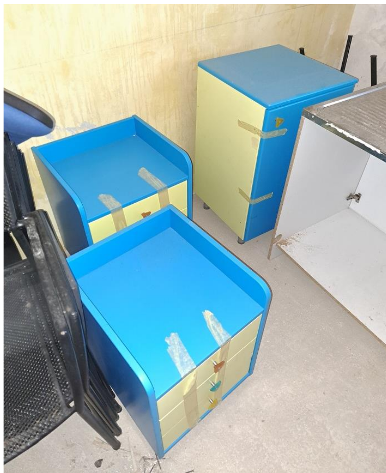
Sl. 63 Ormar za registratore