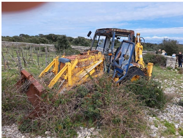
Sl. 51 Bager Poclair 580SK Turbo