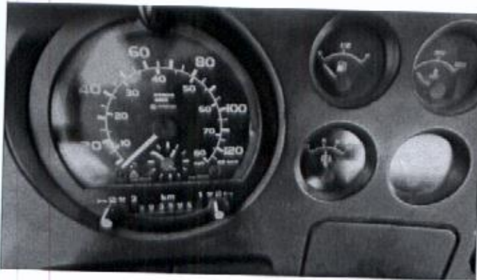
1. DAF – FA 45 – kilometar sat