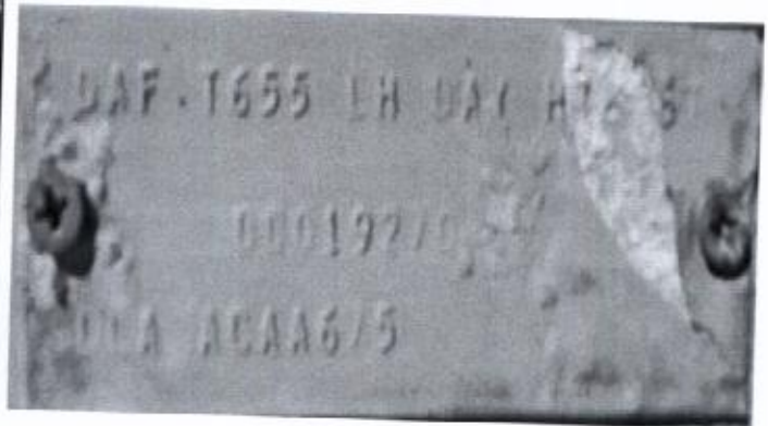
2. DAF – FA 45 – broj šasijske