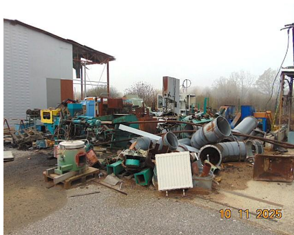
14.SMJEŠTAJ STROJEVA U DONJOJ BISTRU