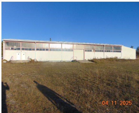
13.SMJEŠTAJ STROJEVA U UDBINI