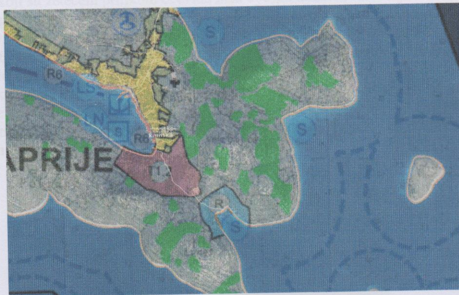
Slika 4: Prikaz dijela Prostornog plana uređenja Grada Šibenika

Sidreni sustav koji je predmet procjene ovog elaborata nalazi se u Nozdra Velika, koja je prema važećem prostornom planu namijenjena za postavljanje sidrišta.