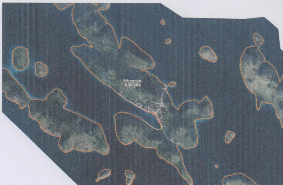
Slika 2: Otok Kaprije

Otok Kaprije predstavlja naseljeni otok šibenskog arhipelaga, udaljen cca 8nmi od administrativnog središta grada Šibenika.