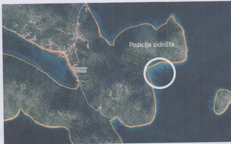
Slika 3: Lokacija sidrenog sustava

Sidreni sustav koji je predmet procjene ovog elaborata nalazi se u Nozdra Velika, koja je prema važećem prostornom planu namijenjena za postavljanje sidrišta.