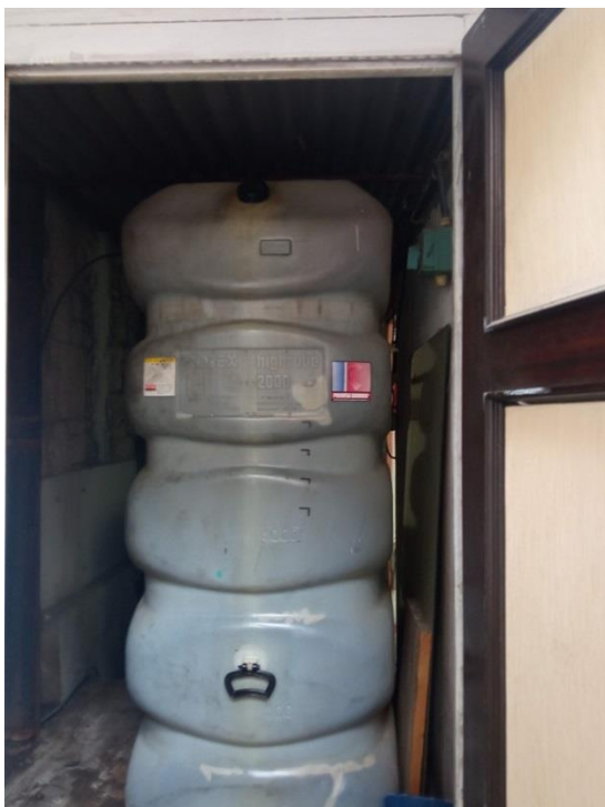
33. Tank lož ulja 2000 lit.