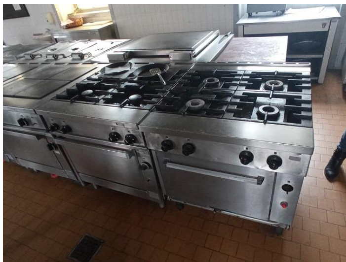
23. Plinska kuhala