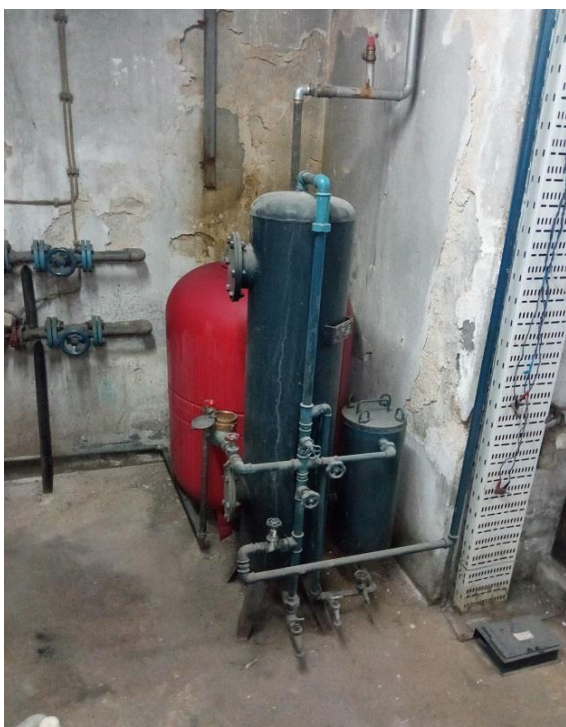
30. Ekspanzione posude