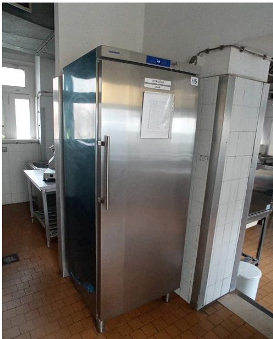
24. Liebherr haldnjak