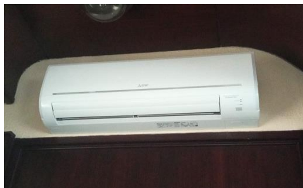
42. Klima uređaj Mitshubishi electric