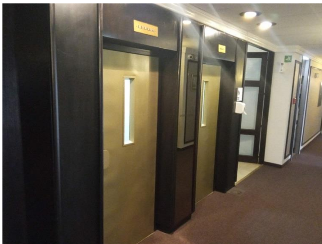
17. Ulazi u lift