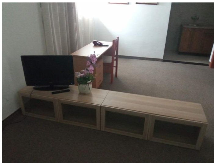
11. Komoda-boja drva