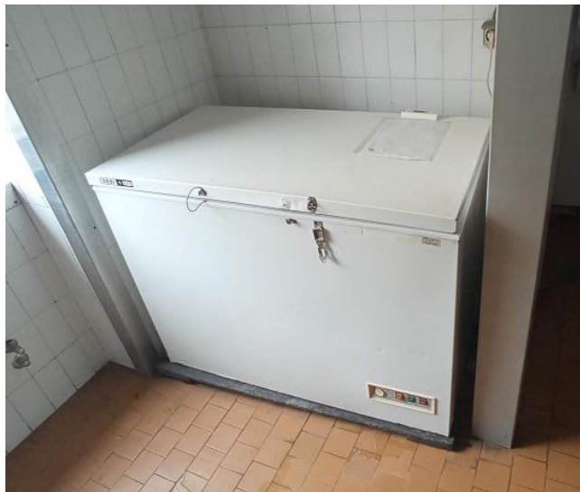
25. Gorenje zamrzivač