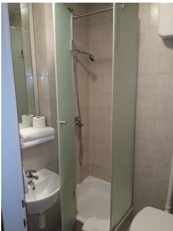
14. Tuš kabina