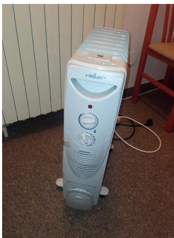
15. radijator Heller