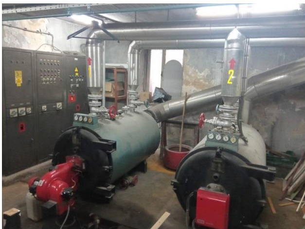
28. Kotlovi za grijanje vode