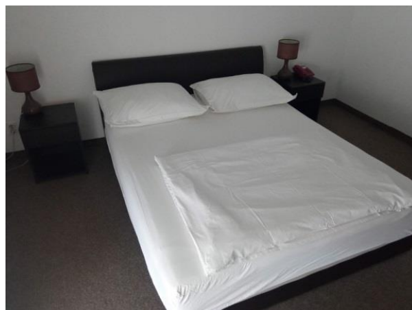
6. Dupli krevet-crni