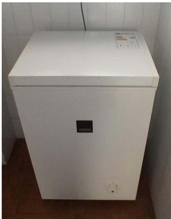
27. Zanussi zamrzivač