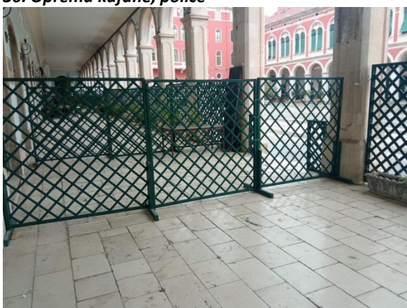
38. Drvena ograda, po mjeri