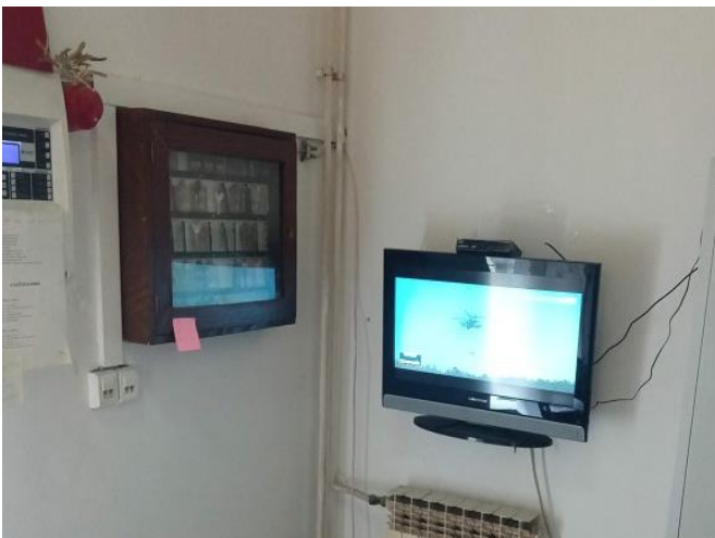
3. Sustav tehničke zaštite