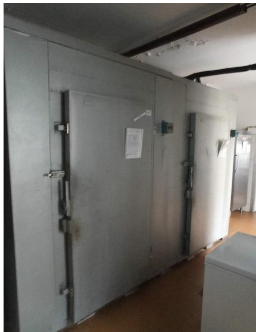
21. Rashladna komora