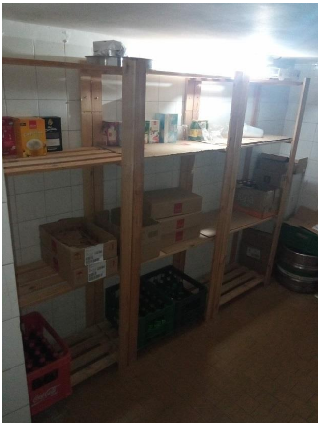
36. Oprema kafane, police