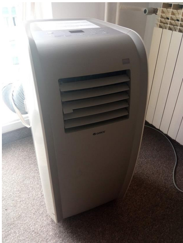
16. Mobilni klima uređaj Gree 3520 W