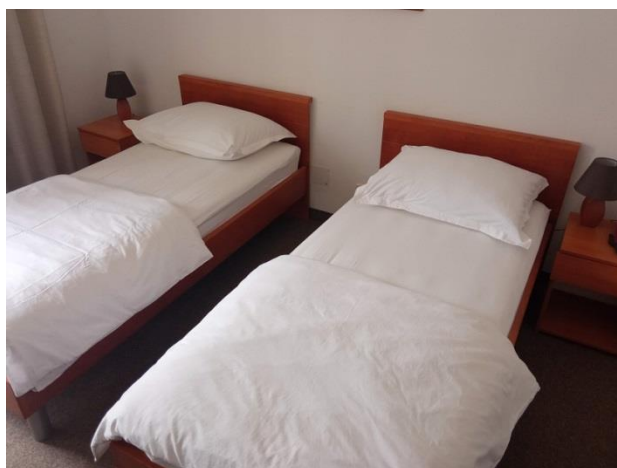
8. Odvojeni kreveti