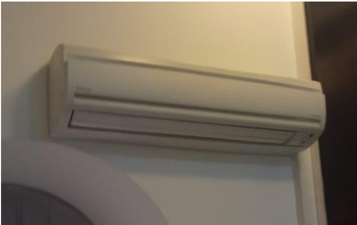
1. Klima uređaj Daikin FTX 50