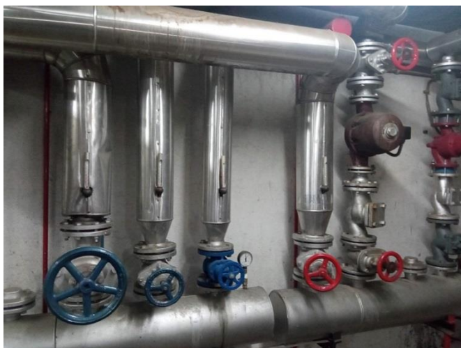
31. Razvodni ventili