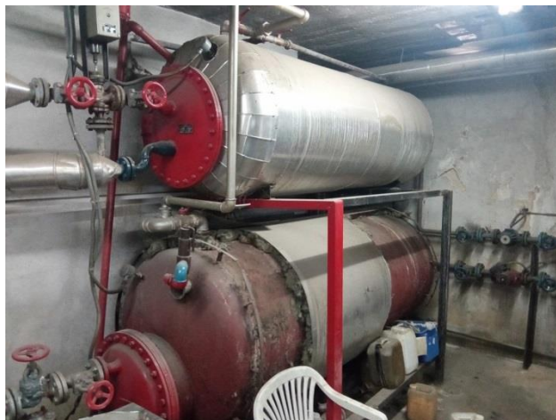
29. Bojleri vode u kotlovnici