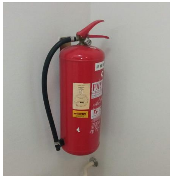
4. Vatragosni aparat