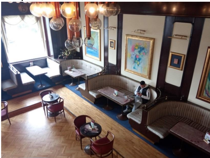
34. Separei i inventar