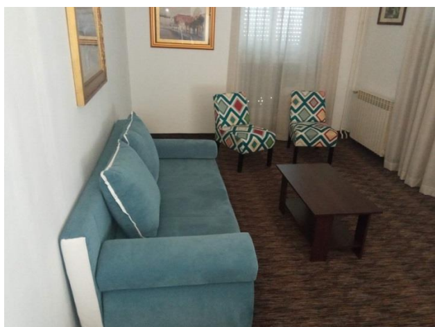
7. Kauč i sjedalice