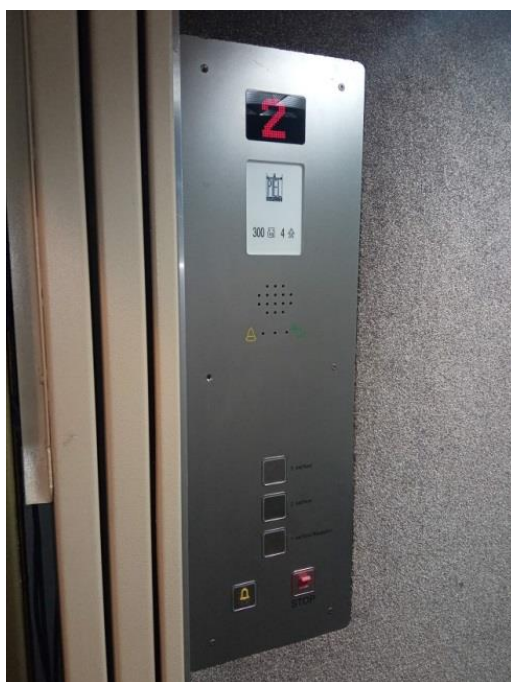
18. Elektronika Lifta