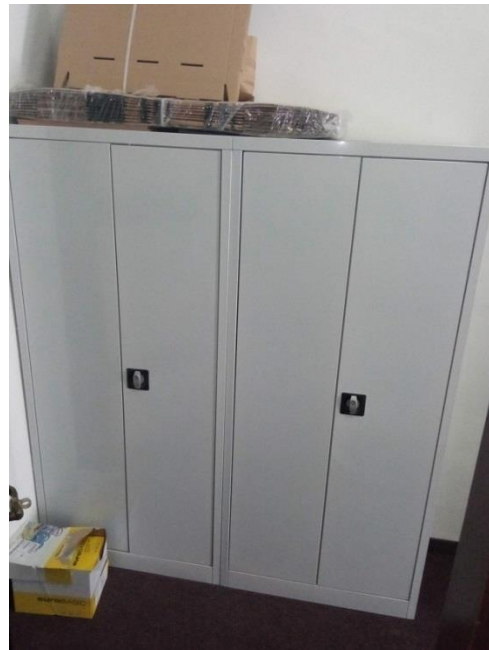
2. Ormari za osoblje