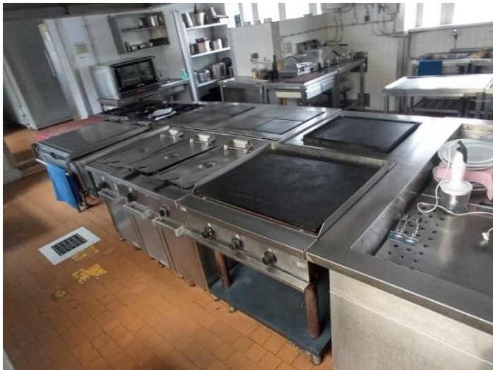
20. Aparati za kuhanje