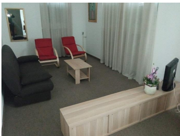
5. Kauč i sjedalice