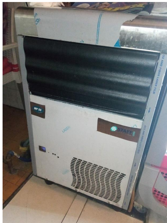
37. Ledomat Satff MP50