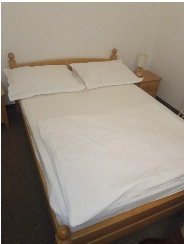
9. Dupli krevet-boja drva