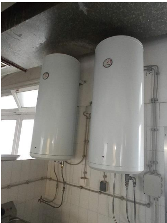
26. Bojlери za vodu