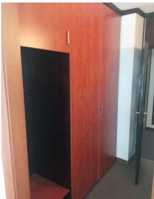
10. Ugradbeni ormari