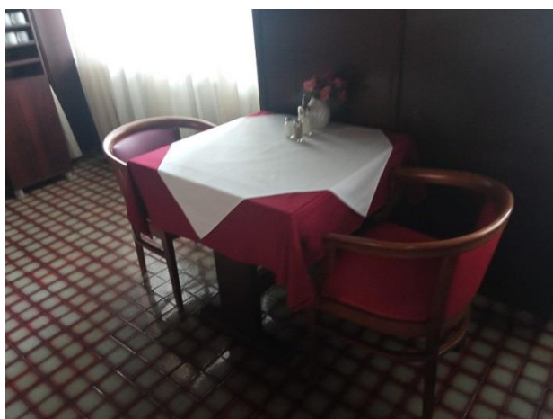
41. Stol i stolice