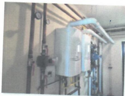
10_OPREMA ZA CENTRALNO GRIJANJE-VODOTERM_02