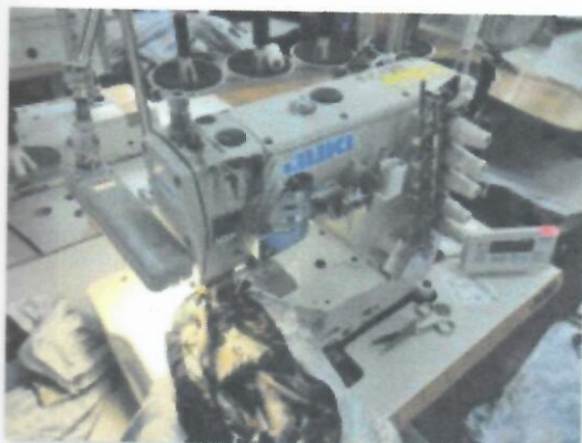
1_IBERDEK JUKI MF7523U11B56UT37_07