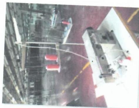
9_DVOIGLA NECHI I_05