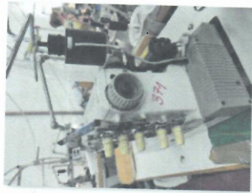
2_ŠIVAĆI STROJ IBERDEK TROIGLA SIRUBA XH3_03