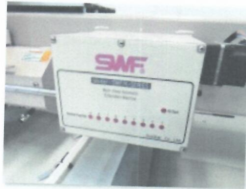
7_ŠTIKERICA SWF K-WH908-75_04