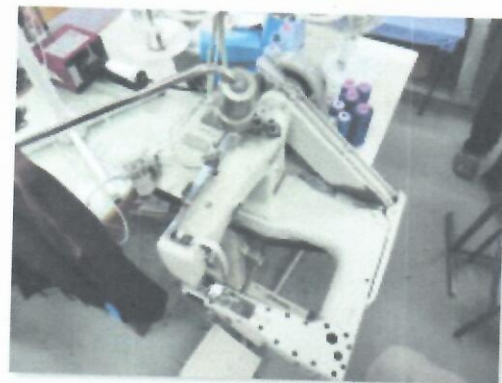
6_KAP-NAT BROTHER XI-1_02