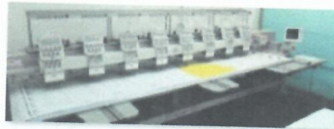
7_ŠTIKERICA SWF K-WH908-75_02