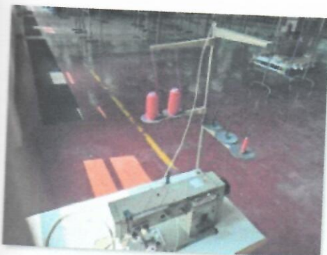
9_DVOIGLA NECHI I_04