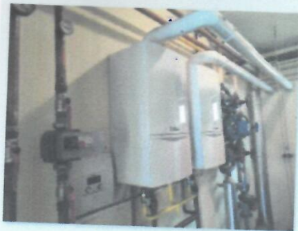
10_OPREMA ZA CENTRALNO GRIJANJE-VODOTERM_01