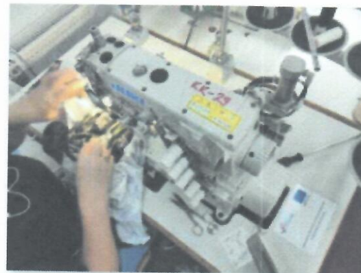
1_IBERDEK JUKI MF7523U11B56UT37_04