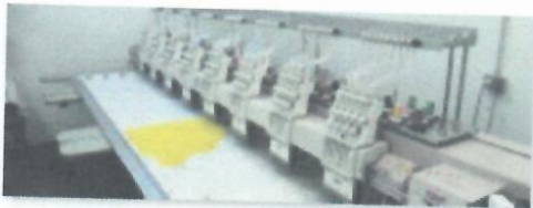
7_ŠTIKERICA SWF K-WH908-75_01