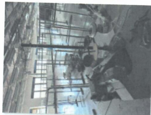
8_FLATLOK MAUSER SPECIAL 46411 K-9_02