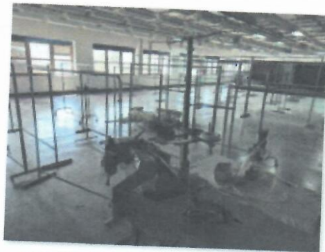
8_FLATLOK MAUSER SPECIAL 46411 K-9_04