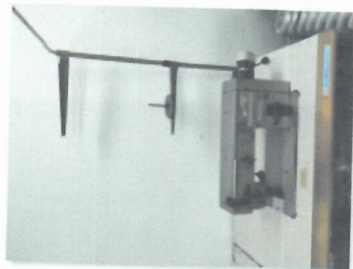
5_ŠTIRCERICA NECHI I-73_03