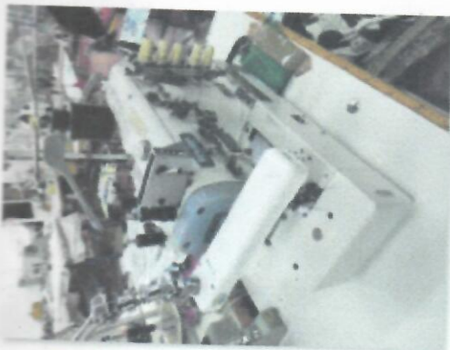
2_ŠIVAĆI STROJ IBERDEK TROIGLA SIRUBA XH3_04