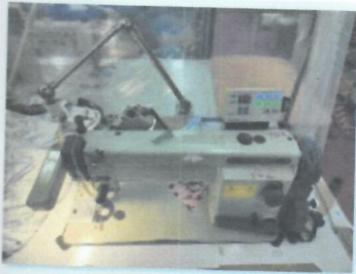
4_ŠIVAĆI STROJ MITSUBISHI XL_02