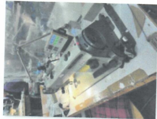
4_ŠIVAĆI STROJ MITSUBISHI XL_03