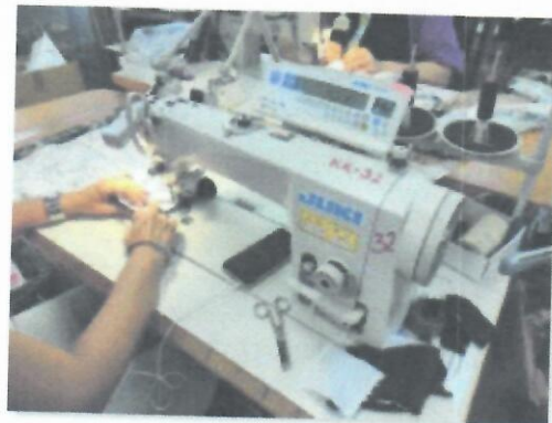
3_ŠIVAĆI STROJ JUKI DDL9000BSS_01