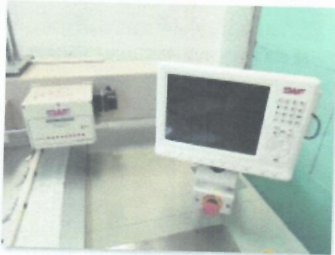
7_ŠTIKERICA SWF K-WH908-75_03