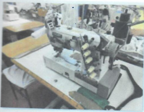
2_ŠIVAĆI STROJ IBERDEK TROIGLA SIRUBA XH3_02