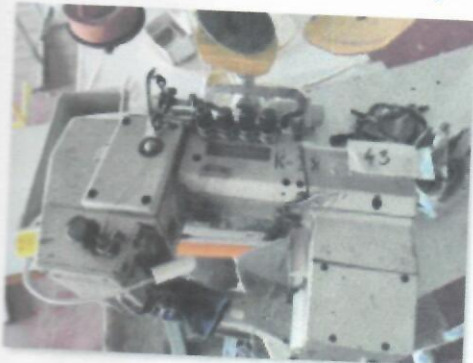
8_FLATLOK MAUSER SPECIAL 46411 K-9_05