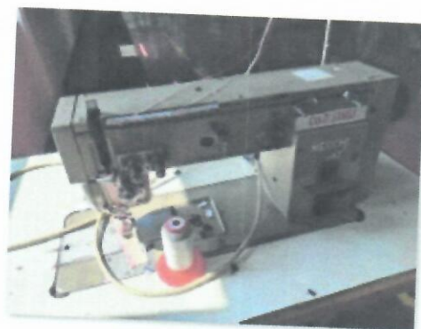
9_DVOIGLA NECHI I_03