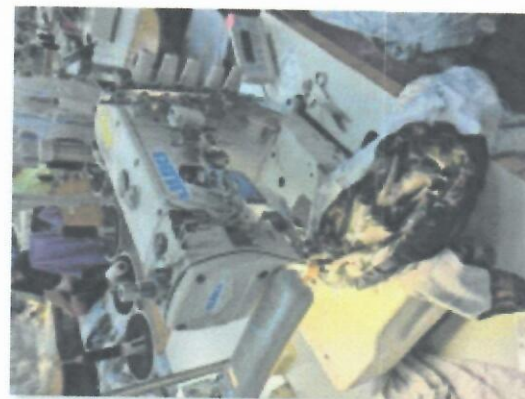
1_IBERDEK JUKI MF7523U11B56UT37_06