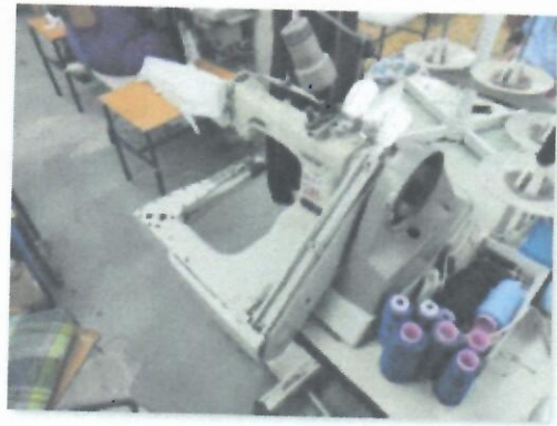
6_KAP-NAT BROTHER XI-1_04