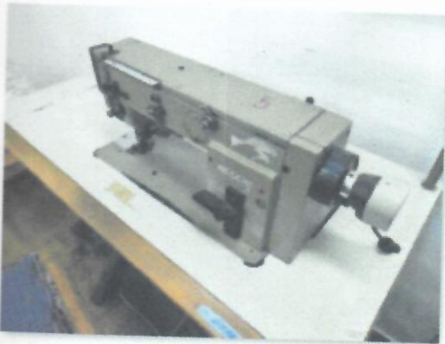
5_ŠTIRCERICA NECHI I-73_02