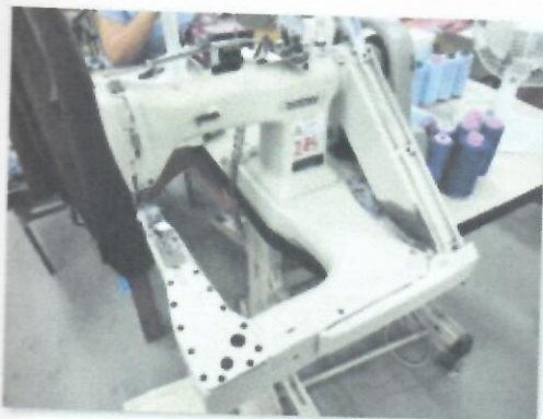
6_KAP-NAT BROTHER XI-1_01