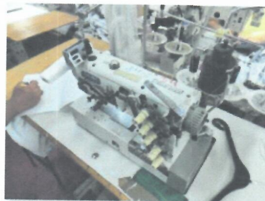
2_ŠIVAČI STROJ IBERDEK TROIGLA SIRUBA XH3 01