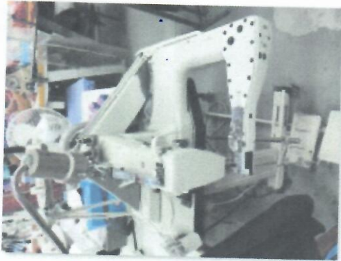
6_KAP-NAT BROTHER XI-1_03