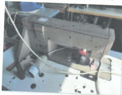
9_DVOIGLA NECHI I_01