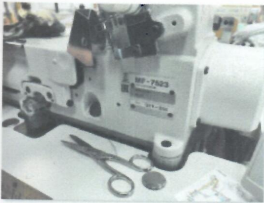
1_IBERDEK JUKI MF7523U11B56UT37_01