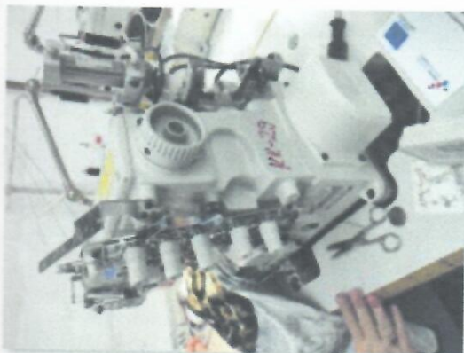
1_IBERDEK JUKI MF7523U11B56UT37_05