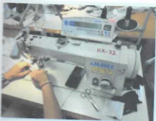
3_ŠIVAĆI STROJ JUKI DDL9000BSS_02