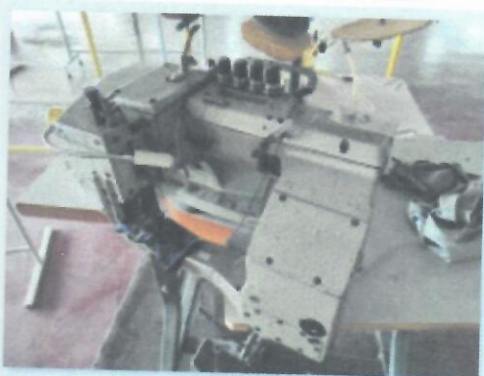
8_FLATLOK MAUSER SPECIAL 46411 K-9_01