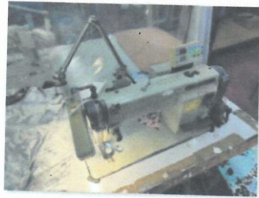
4_ŠIVAĆI STROJ MITSUBISHI XL_01