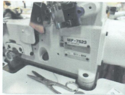
1_IBERDEK JUKI MF7523U11B56UT37_02