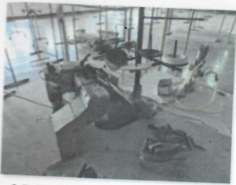
8_FLATLOK MAUSER SPECIAL 46411 K-9_03