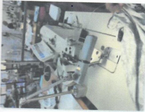
3_ŠIVAĆI STROJ JUKI DDL9000BSS_04