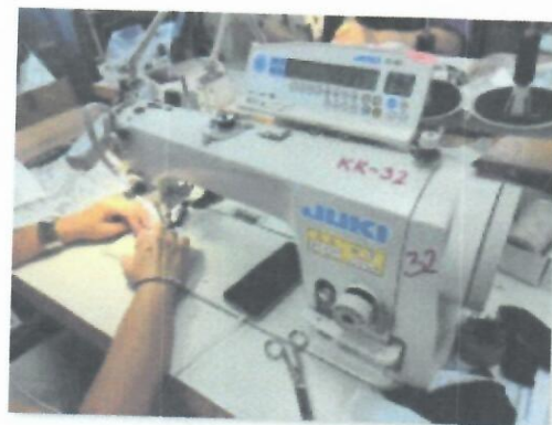
3_ŠIVAĆI STROJ JUKI DDL9000BSS_03