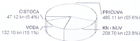
*Udio u cjelokupnom iznosu mjesečnog računa

PRIČUVA: 485,11 kn KOMUNALNA NAKNADA I NAKNADA ZA UREĐENJE VODA: 208,70 kn VODA: 132,10 kn ČISTOČA: 47,12 kn SVEUKUPNO: 873,03 kn