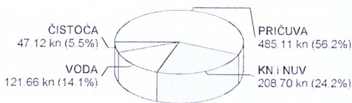
*Udio u cjelokupnom iznosu mjesečnog računa

PRIČUVA: 485,11 kn KOMUNALNA NAKNADA I NAKNADA ZA UREĐENJE VODA: 208,70 kn VODA: 121,66 kn ČISTOĆA: 47,12 kn SVEUKUPNO: 862,59 kn