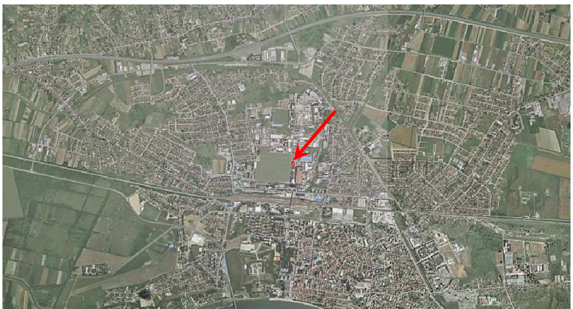
POLOŽAJ PREDMETNE NEKRETNINE

Predmetna nekretnina nalazi se u gradu Slavonskom Brodu u ulici dr. Mile Budaka u industrijskoj zoni Đure Đakovića. Ulica dr. Mile Budaka prolazi s južne strane gospodarsko poslovne zone Đuro Đaković, te istu povezuje s glavnim gradskim prometnicama.