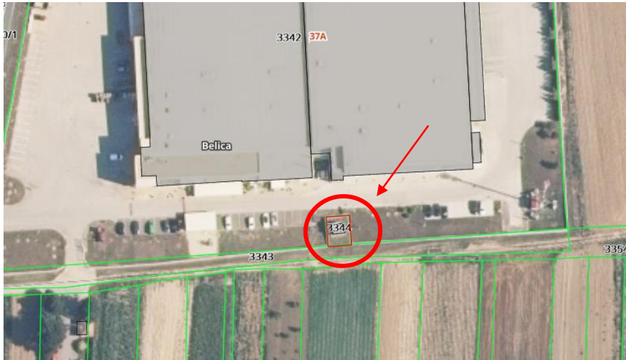
Slika: Ortofoto snimak područja nekretnina

Lokacija: Predmetna nekretnina nalazi se u Međimurskoj županiji, u katastarskoj općini Belica. Katastarska čestica k.č.br. 3344 k.o. Belica.