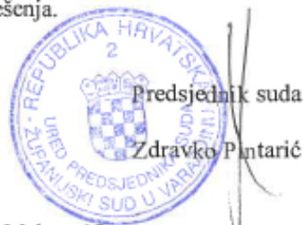
Predsjednik suda Zdravko Pantarić

Budući da je do pogreške u pisanju došlo omaškom jer je imenovani stalni sudski vještak podnio zahtjev za ponovno imenovanje stalnim sudskim vještakom za područje graditeljstva i za procjenu nekretnina sukladno ranijem imenovanju rješenjem poslovnog broja 4 Su-542/2016-4 od 4. siječnja 2017., valjalo je temeljem čl. 104. st. 1. Zakona o općem upravnom postupku odlučiti kao u izreci rješenja.