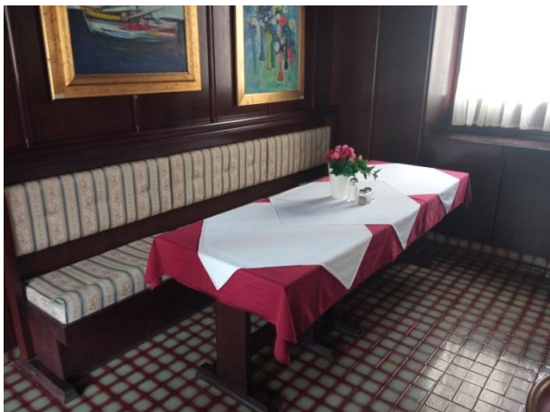
39. Separei i inventar