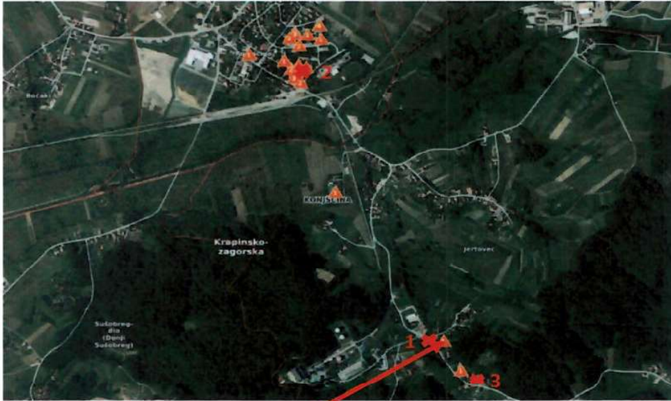
Lokacija procenjivane nekretnine