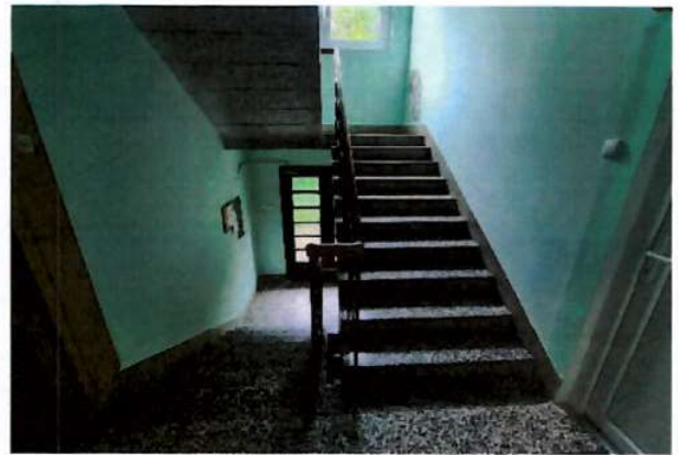
zajedničko stubište zgrade