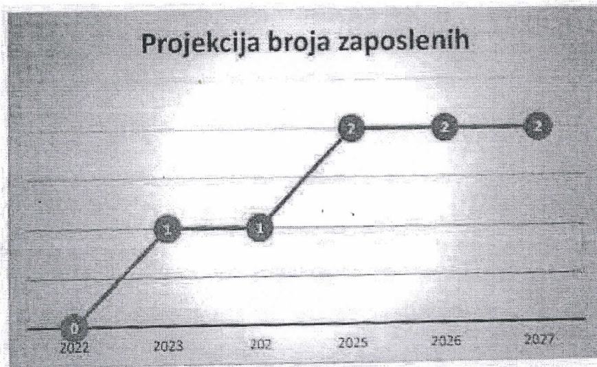
Grafički prikaz: Plan kretanja broja zaposlenih po godinama

Planirano kretanje broja zaposlenih prikazano je grafičkim prikazom u nastavku, a odnosi se na period od 2022. g. - 2027. g. Grafički prikaz prikazuje povećanje broja zaposlenih u odnosu na prethodne godine (prosječan broj zaposlenih) što je rezultat restrukturiranja tvrtke i povećanja prodaje do kojeg je došlo kroz projekciju budućeg poslovanja tvrtke.