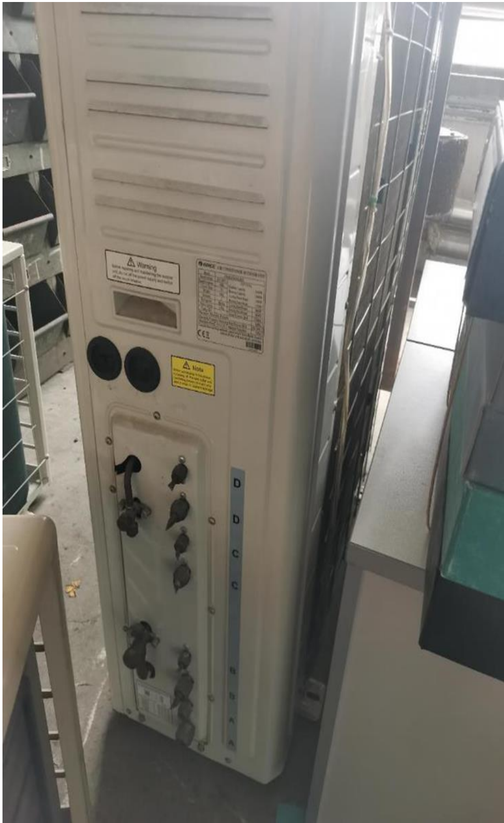
MC servis d.o.o. u stečaju