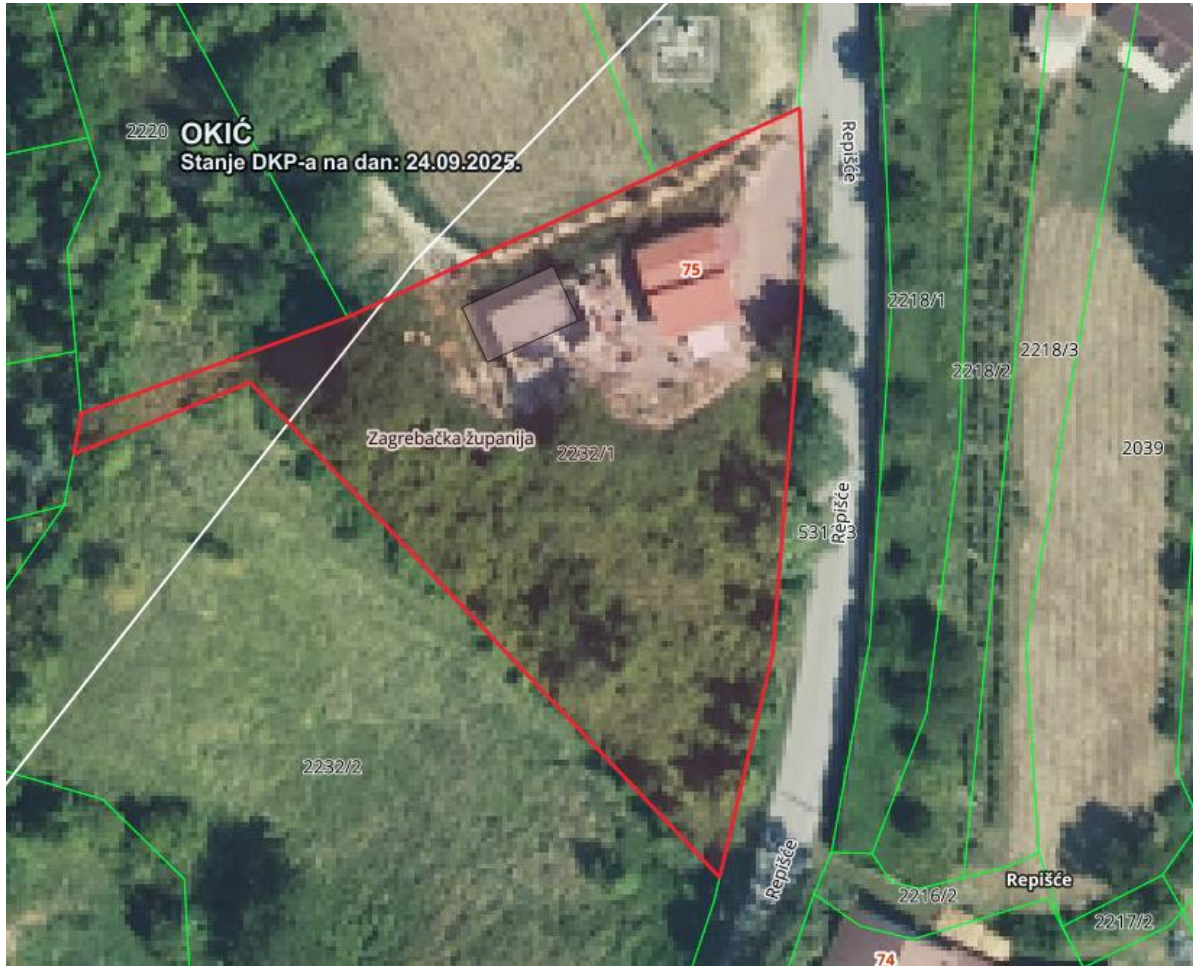
Slika: Ortofoto snimak područja nekretnina

Lokacija: Predmetna nekretnina nalazi se u Zagrebačkoj županiji, općini Klinča Sela, u naselju Repišće, katastarska općina Okić, katastarska čestica br. 2232/1 k.o. Okić