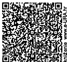
QR kod za automatsko

FERROSTIL MONT d.o.o. Zadarska 77 10000 ZAGREB