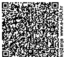
QR kod za automatsko

FERROSTIL MONT d.o.o. Zadarska 77 10000 ZAGREB