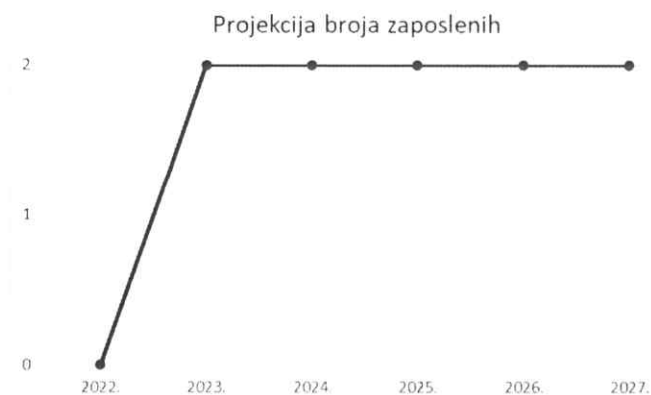
Grafikon 1 Plan kretanja broja zaposlenih po godinama

Planirano kretanje broja zaposlenih prikazano je grafičkim prikazom u nastavku, a odnosi se na period od 2022. g. - 2027. g. Grafički prikaz prikazuje povećanje broja zaposlenih u odnosu na prethodne godine (prosječan broj zaposlenih) što je rezultat restrukturiranja tvrtke i povećanja prodaje do kojeg je došlo kroz projekciju budućeg poslovanja tvrtke.