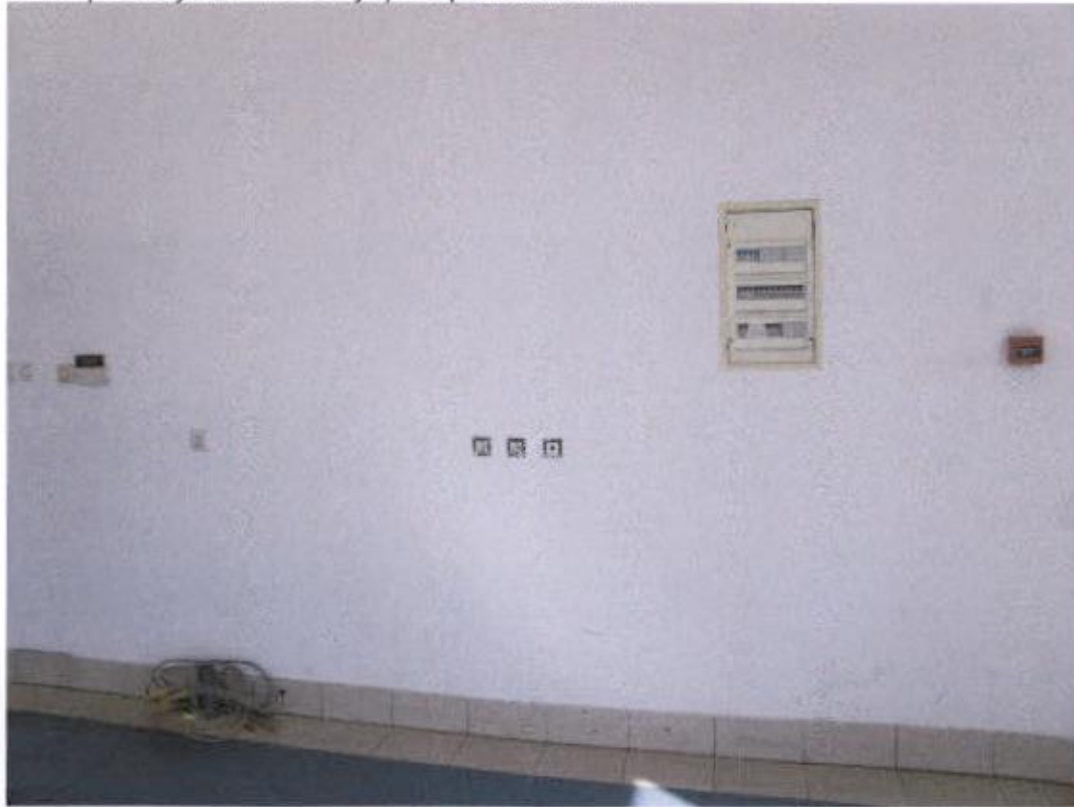
Ulazni prostor južni – nedostaju plafonjere na rasvjetlim tijelima