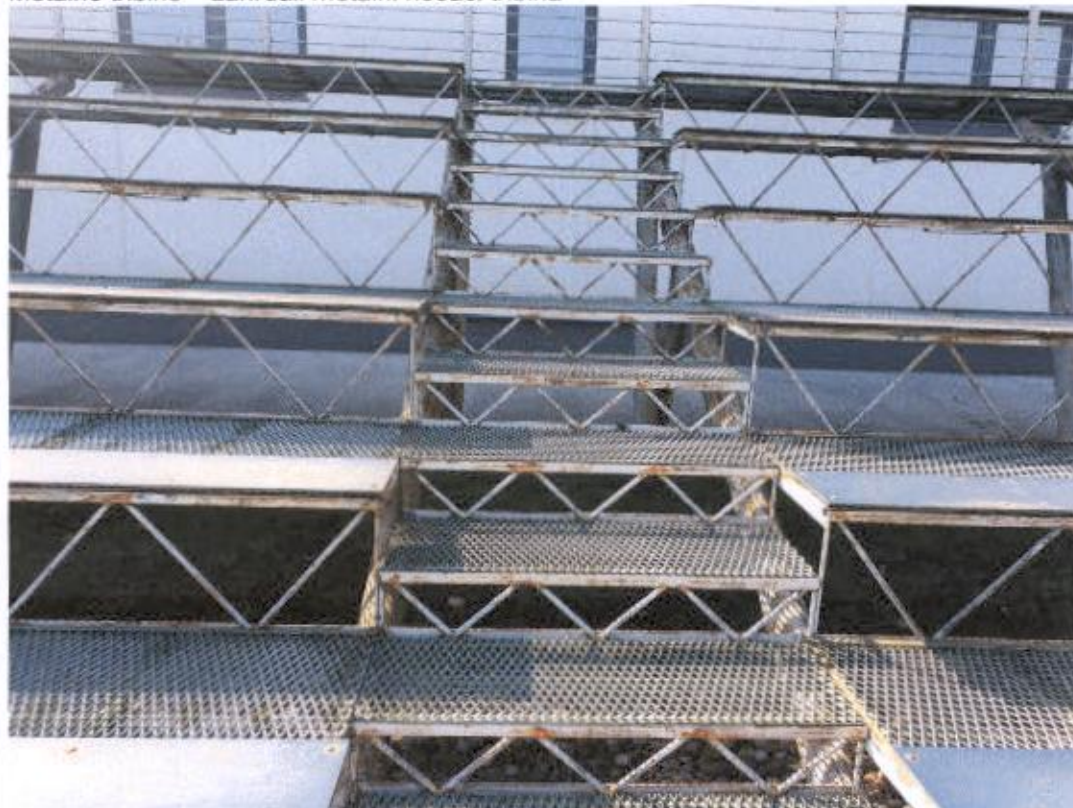
Metalne tribine – zahrđali metalni nosači tribina