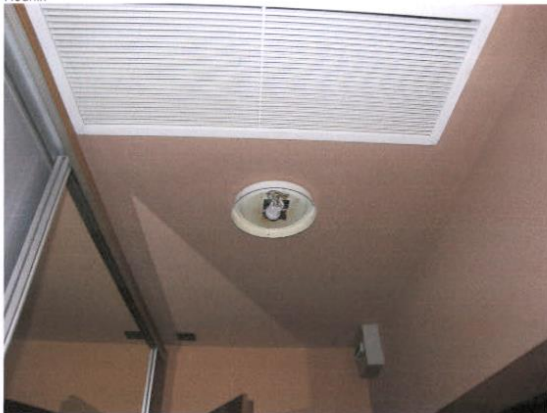
Hodnik popucala žbuka na zidu između soba 121 - 119