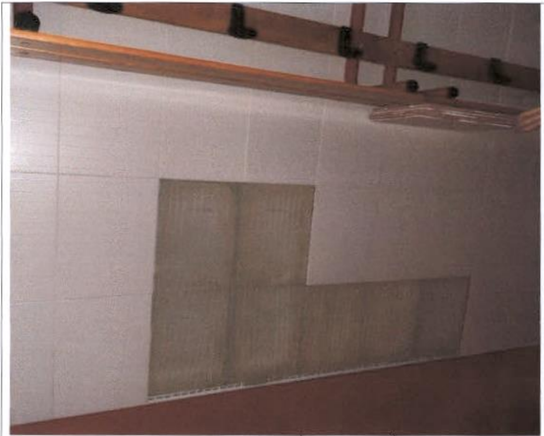
Svlačionica – limaći – otpale keramičke pločice na zidu