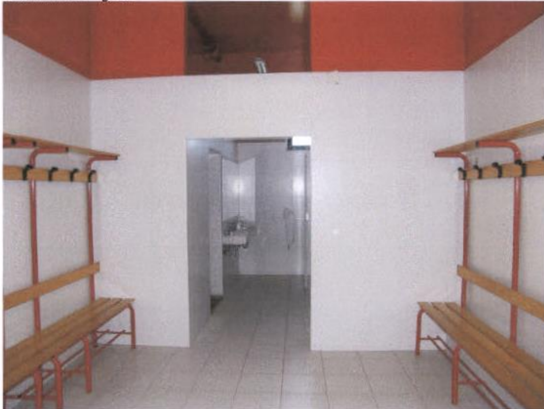
Svlačionica 10 – gosti – nedostaju ruže na tuševima