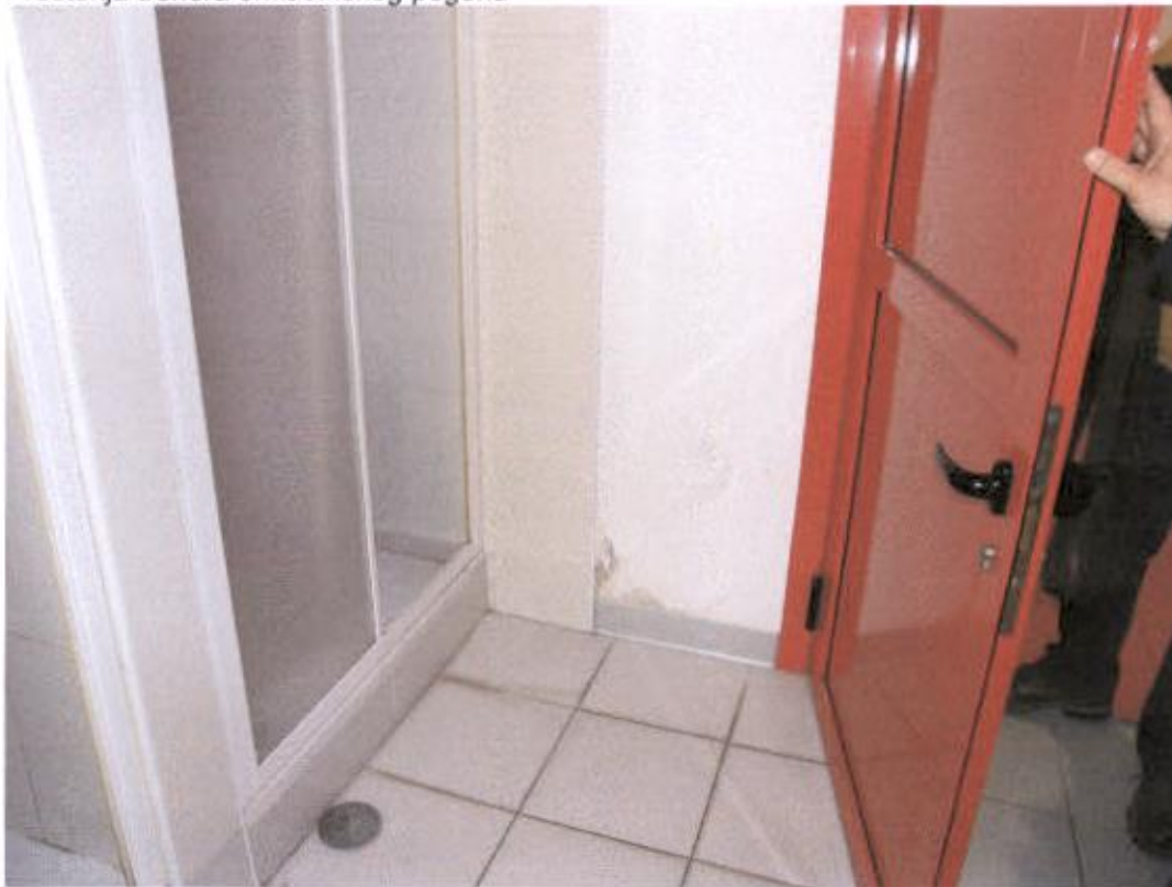
Prostorija trenera omladinskog pogona nema rozete na tušu