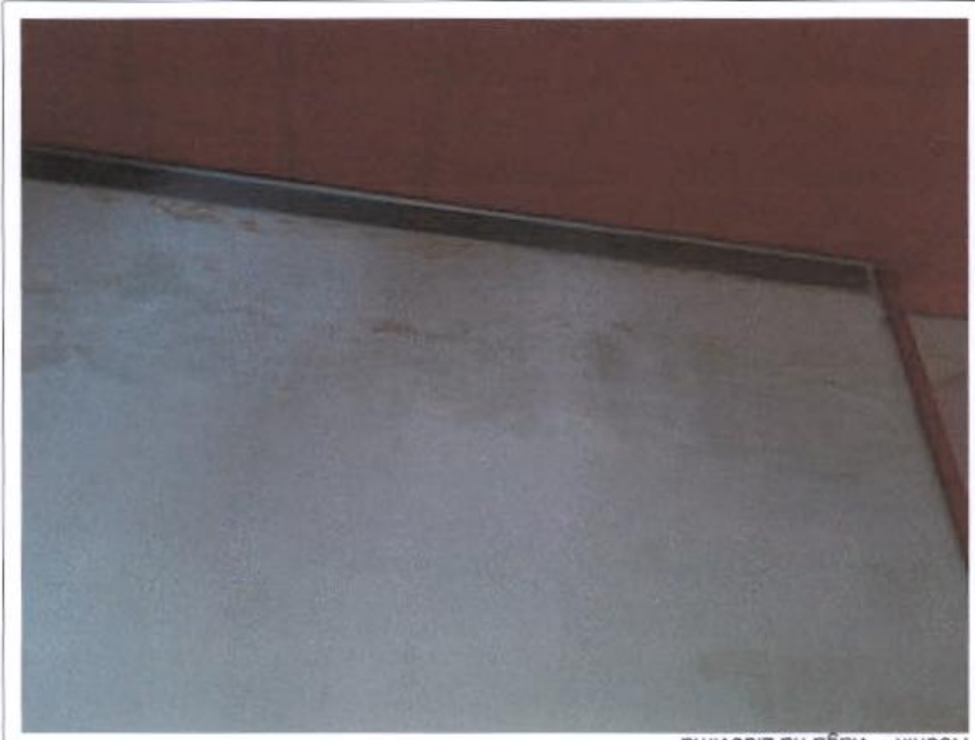
Hodnik – vlaga na zidovima