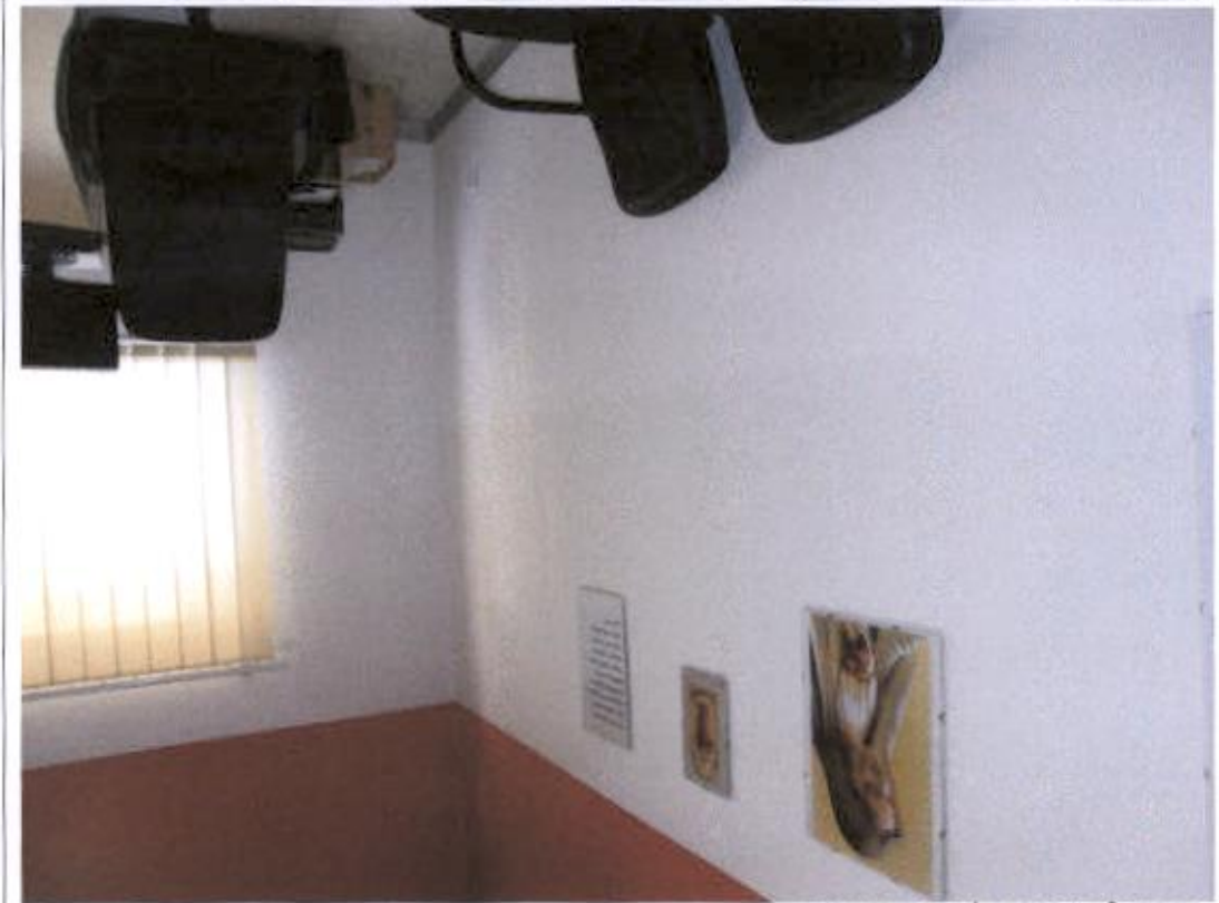
Prostorija trenera prve momčadi