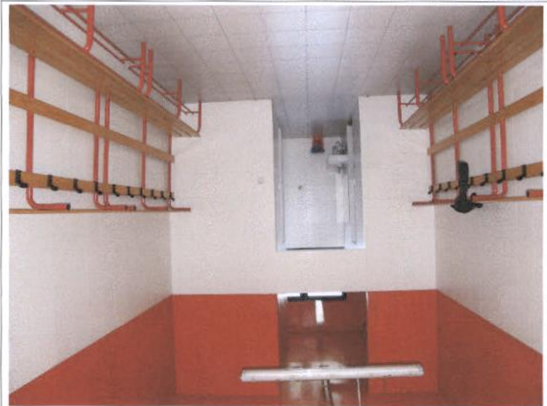
Svlačionica – limaći