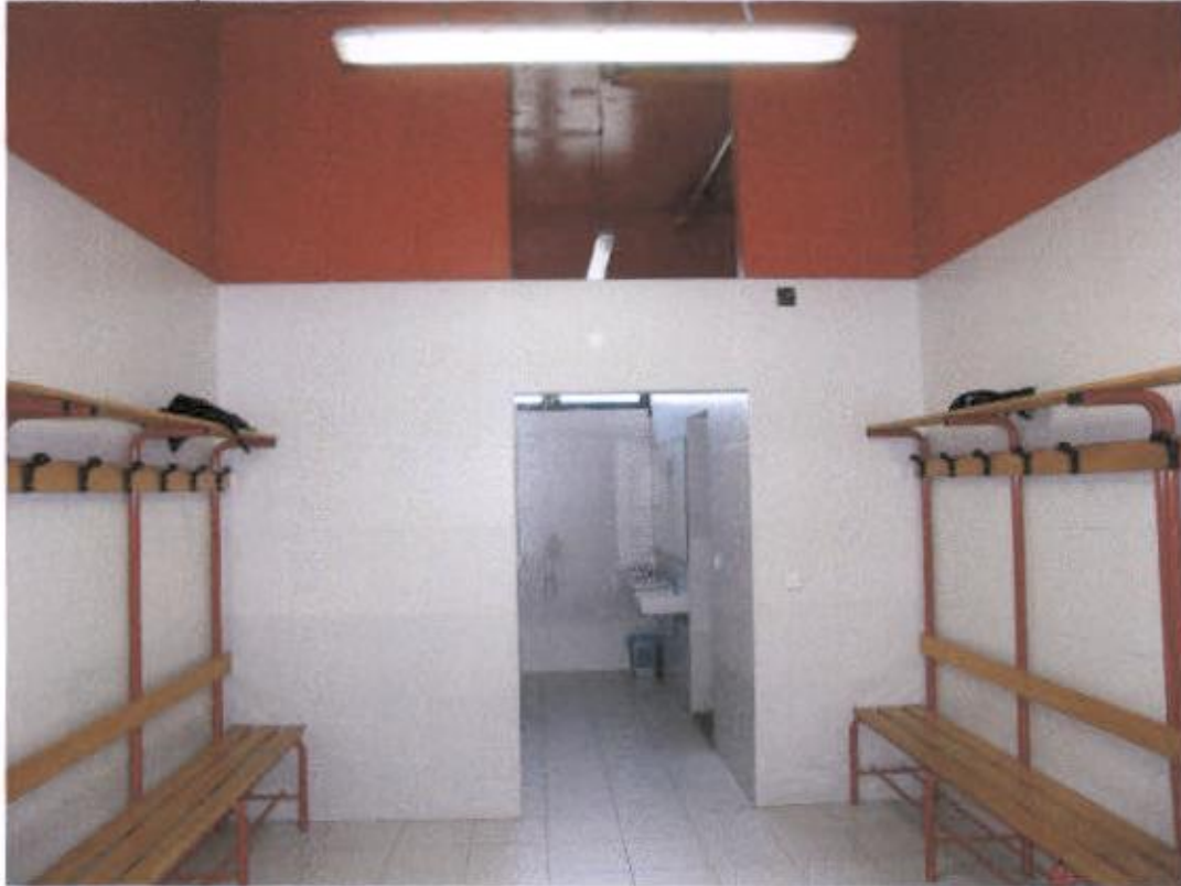
Svlačionica – pioniri – nedostaju ruže na tuševima