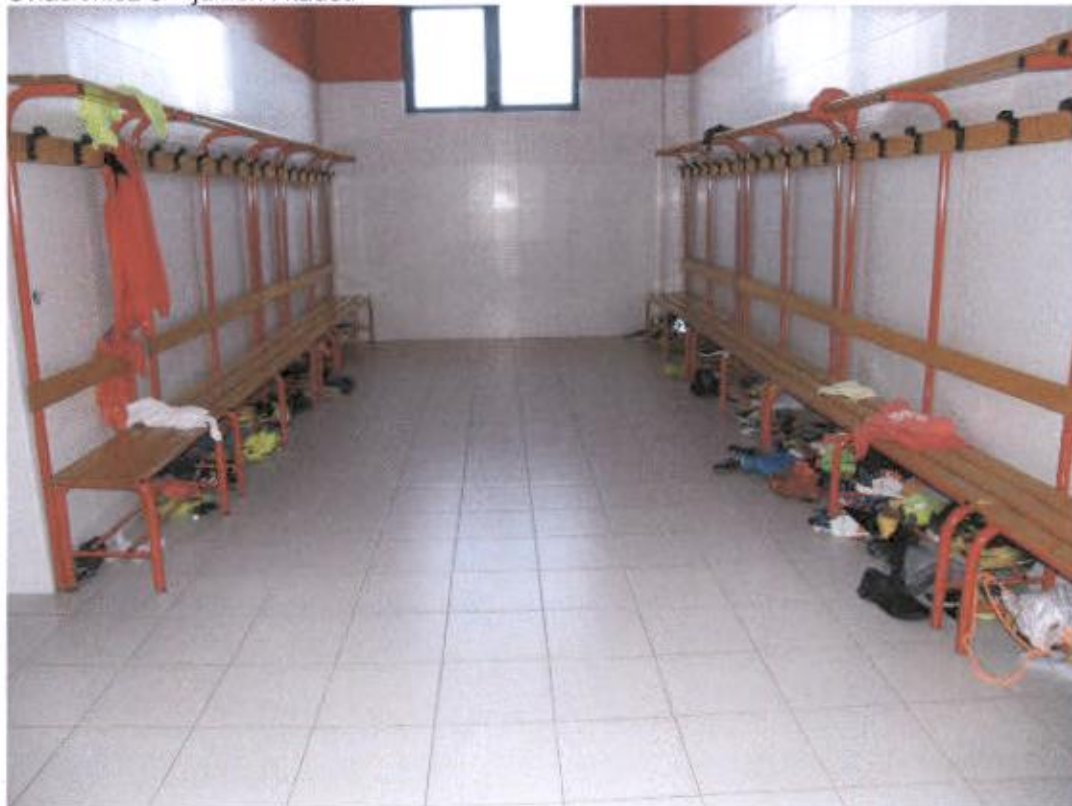
Svlačionica 6 – juniori i kadeti – nedostaju ruže na tuševima