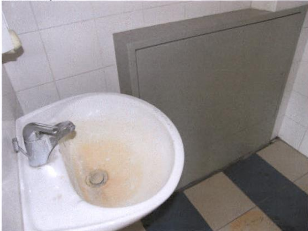
Sanitarni čvor južni – vlaga u blizini električnih instalacija