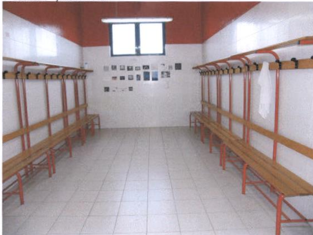
Svlačionica 5 – juniori i kadeti – nedostaju ruže na tuševima