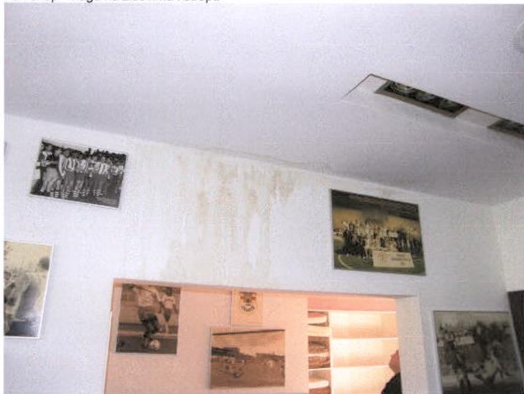
Fan shop - vlaga na zidovima i stropu