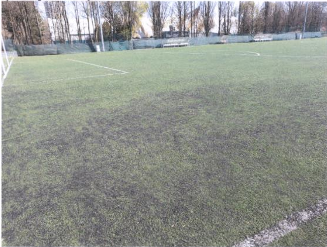
Sjeverno igralište sa umjetnom travom – nezaštićena betonska ograda