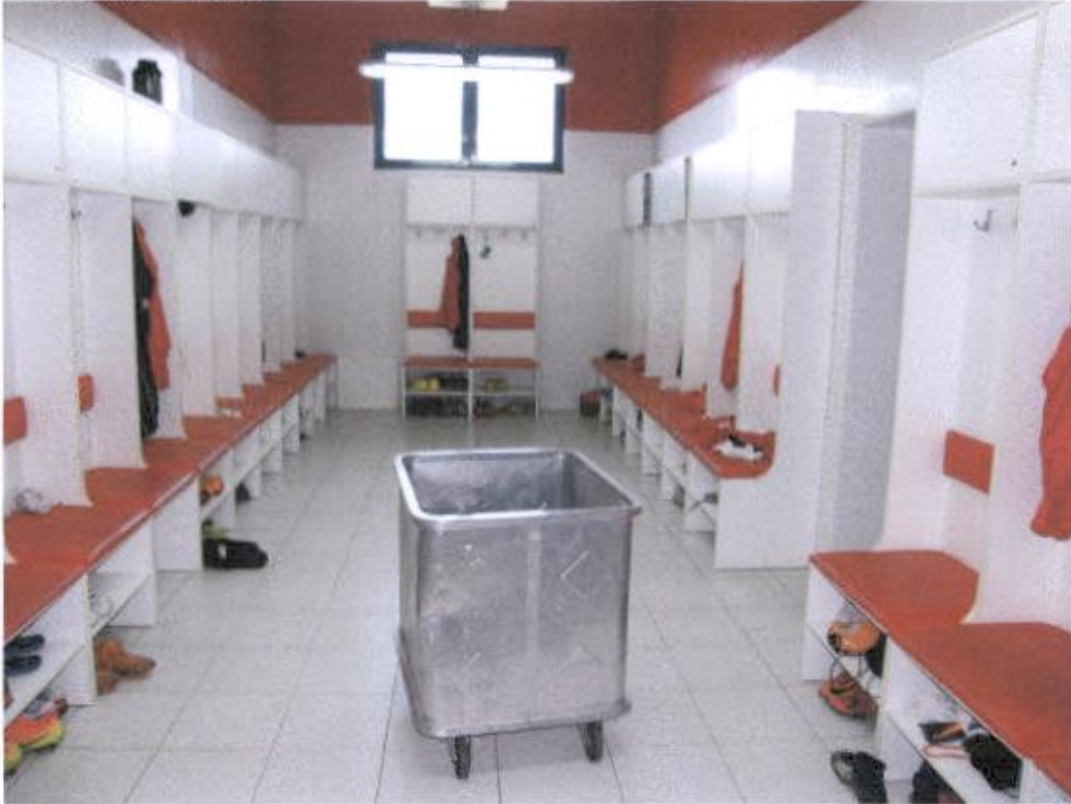
Svlačionica 7 seniori nedostaju ruže na tuševima