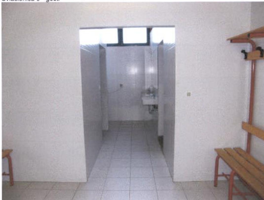
Svlačionica 9 – gosti – nedostaju ruže na tuševima