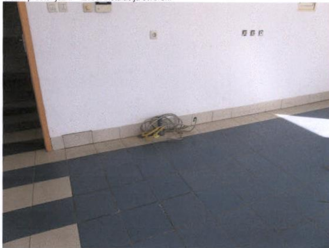
Ulazni prostor južni – izvodi instalacija otvoreni