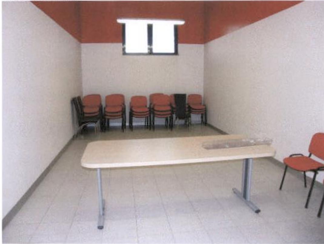
Svlačionica 8 – seniori- vlaga na donjem dijelu zida