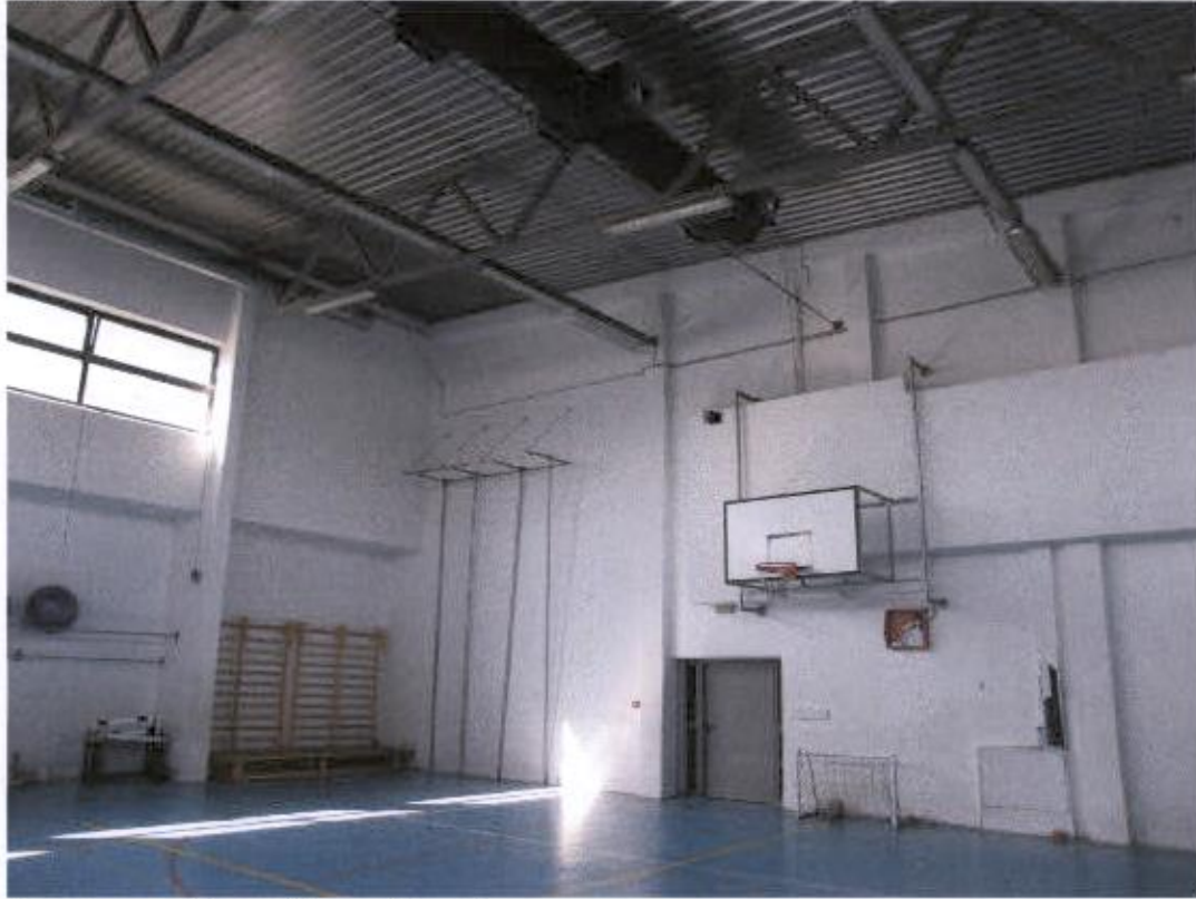
dvorana – razbijena obloga od knaufa