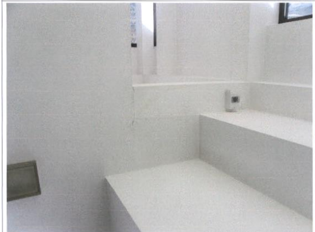
Sjeverno stubište – popucao zid