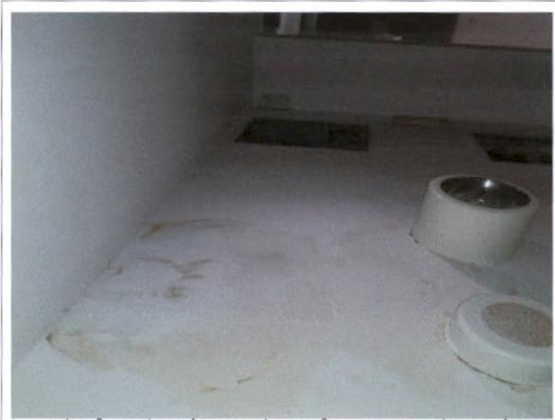
Prostorija trenera prve momčadi – vlaga na stropu i nedostaje dio spušteneog stropa