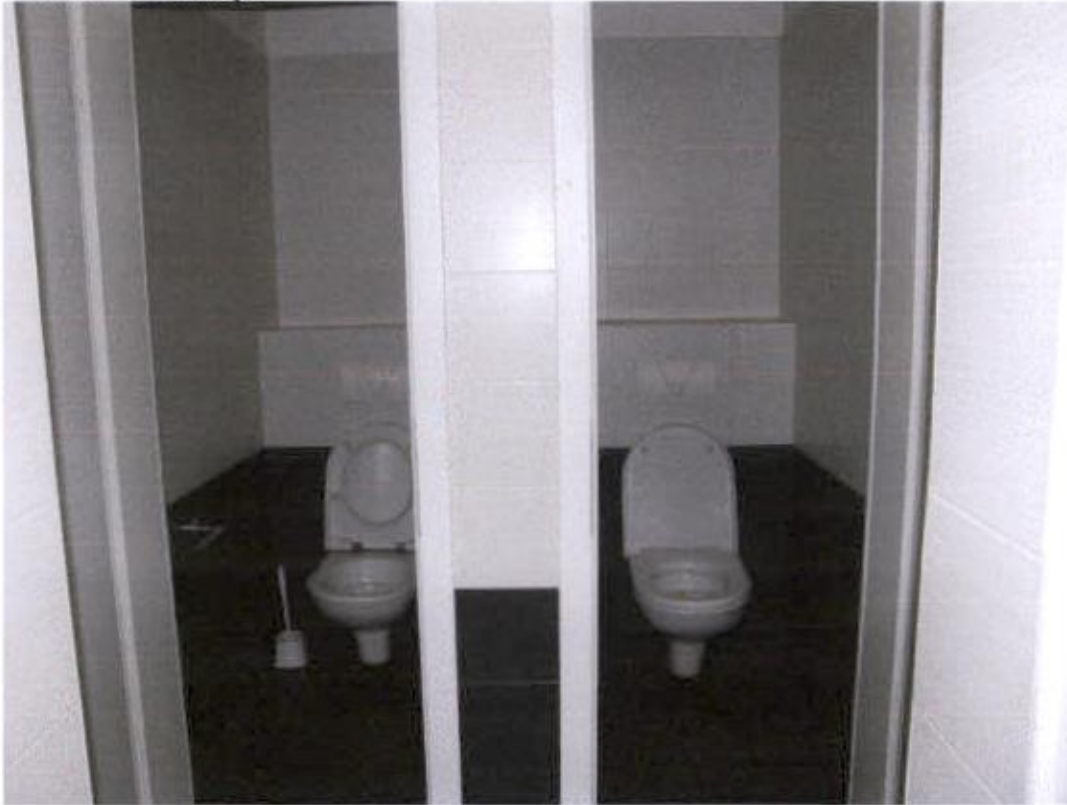
Sanitarni čvor kuhinje – izvod struje nije osiguran