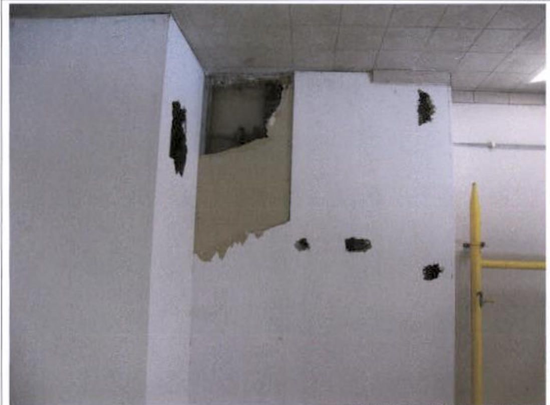
Kotlovnica – razbijen zid od knaufa