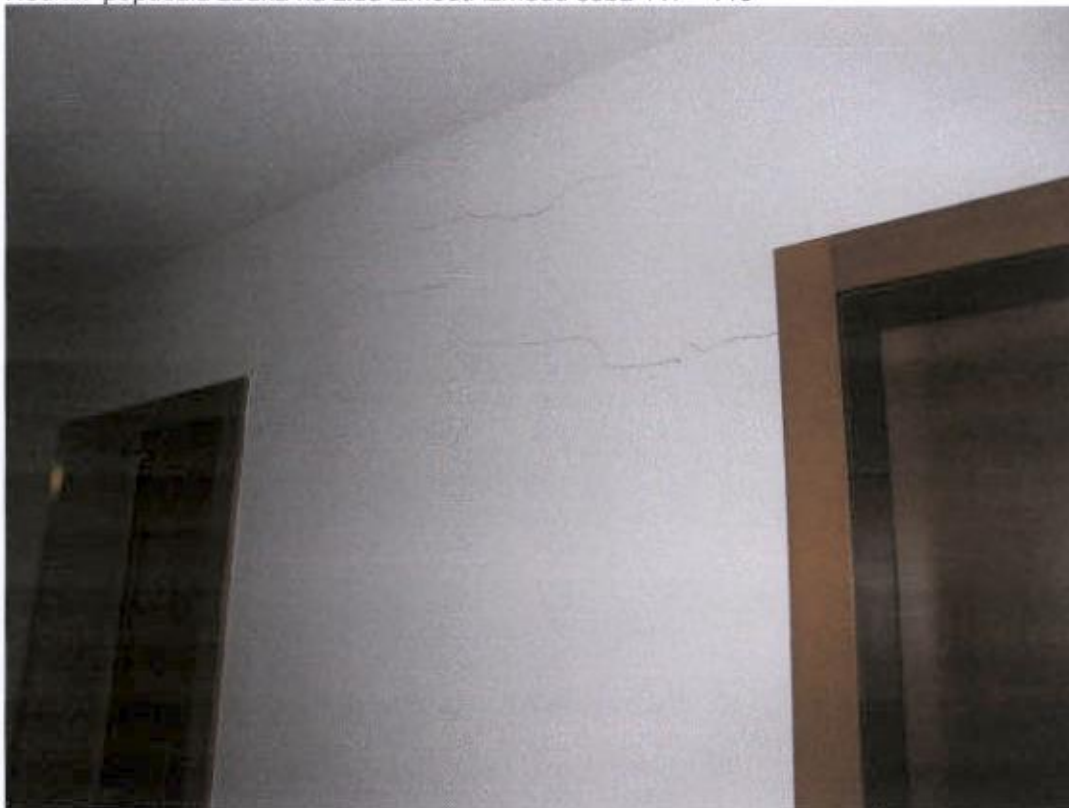
Hodnik popucala žbuka na zidu između soba 113 - 111