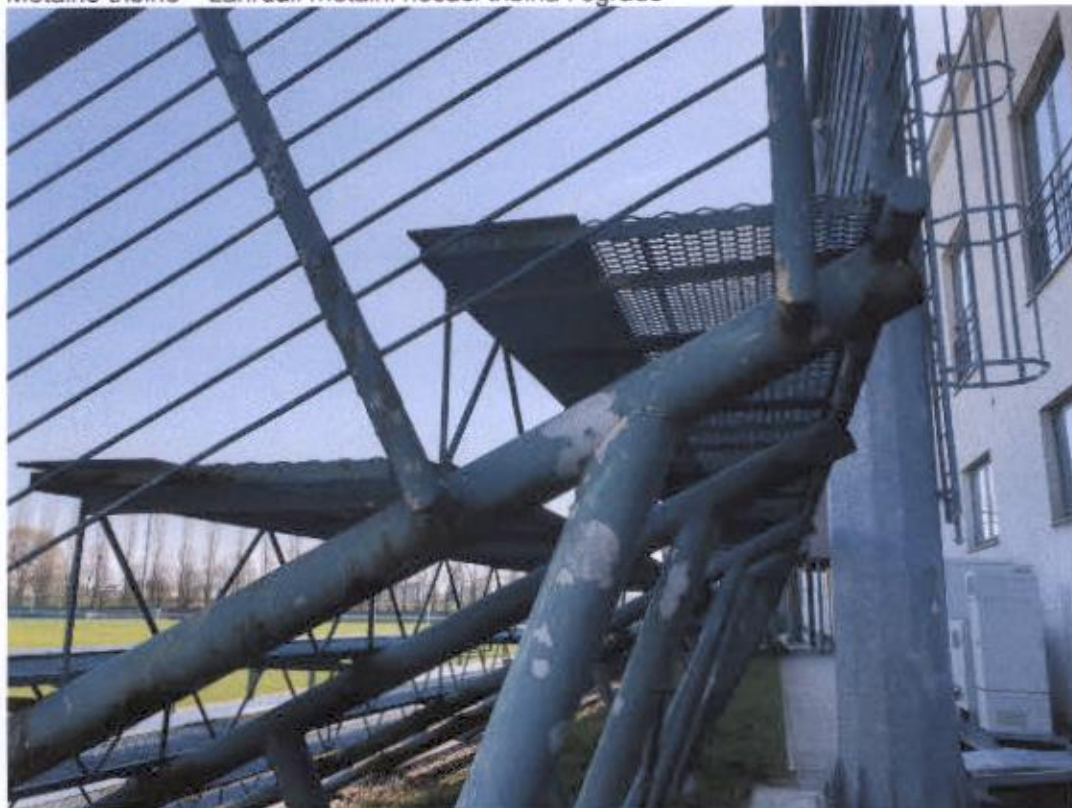
Metalne tribine – zahrđali metalni nosači tribina i ograde