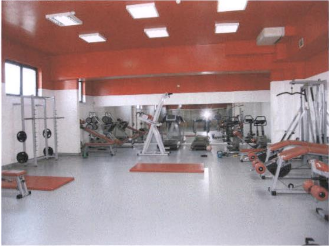
Fitness dvorana – nema poklopca spuštenog stropa kod ventilacije