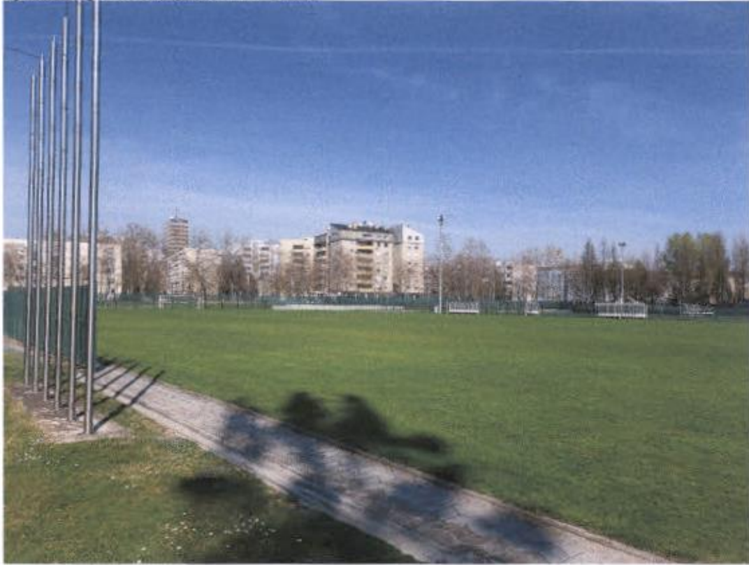
Sjeverno igralište sa prirodnom travom