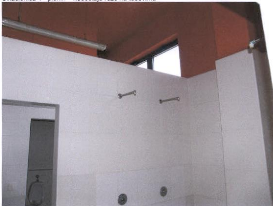
Svlačionica 4 – pioniri – odljepljene keramičke pločice na zidu