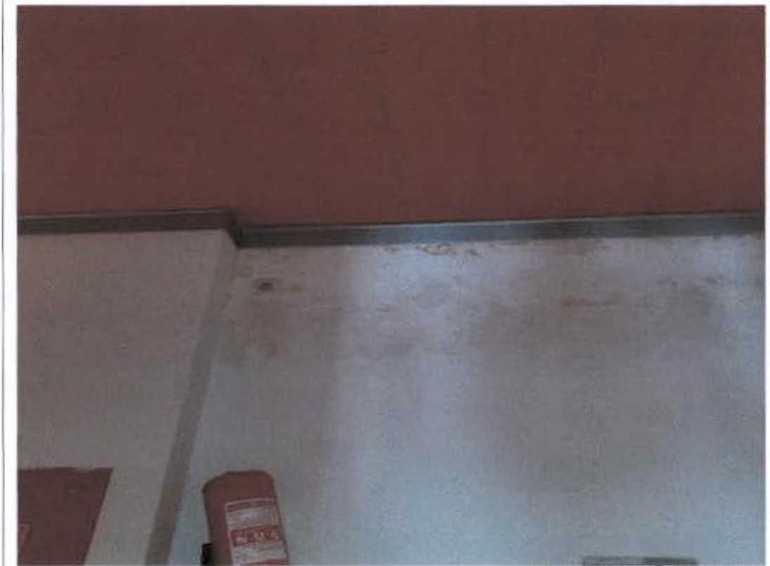
Hodnik – vlaga na zidovima