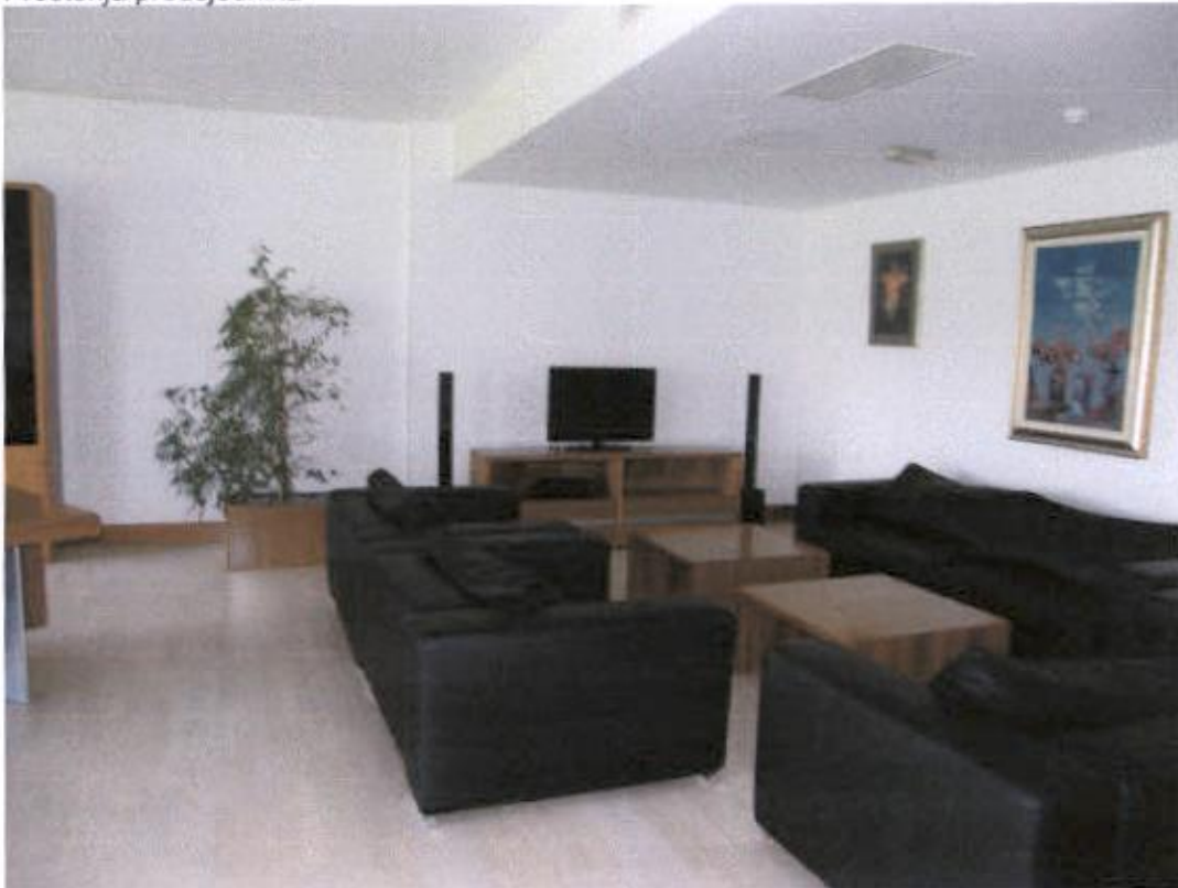
Prostorija tajnika, marketinga i financija – vlaga na stropu