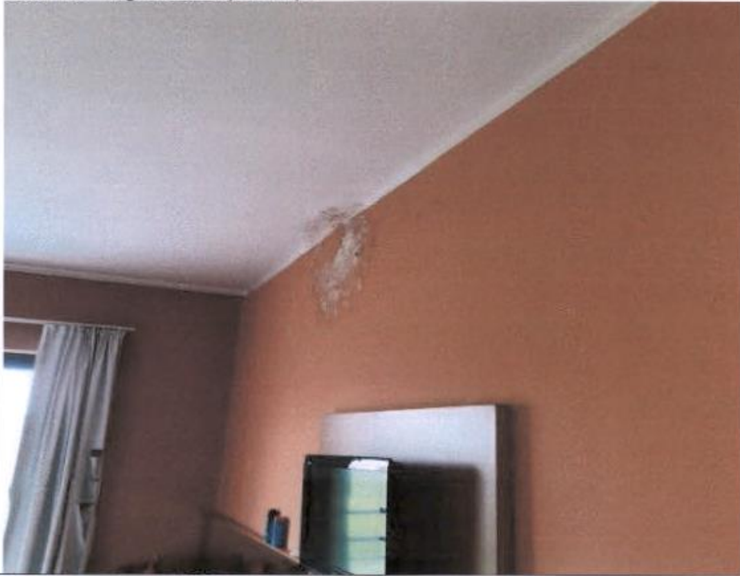
Soba 113 – vlaga na zidu ispod stropa