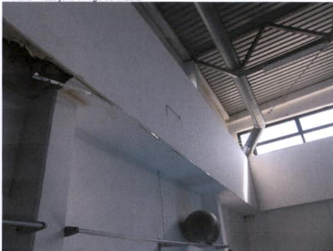
dvorana – razbijena obloga od knaufa