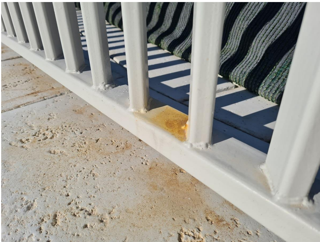
Slika br. 4