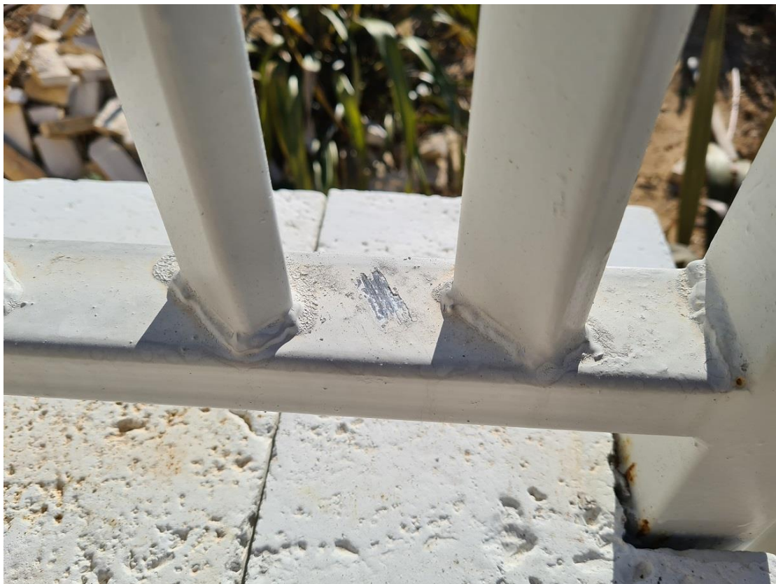
Slika br. 7