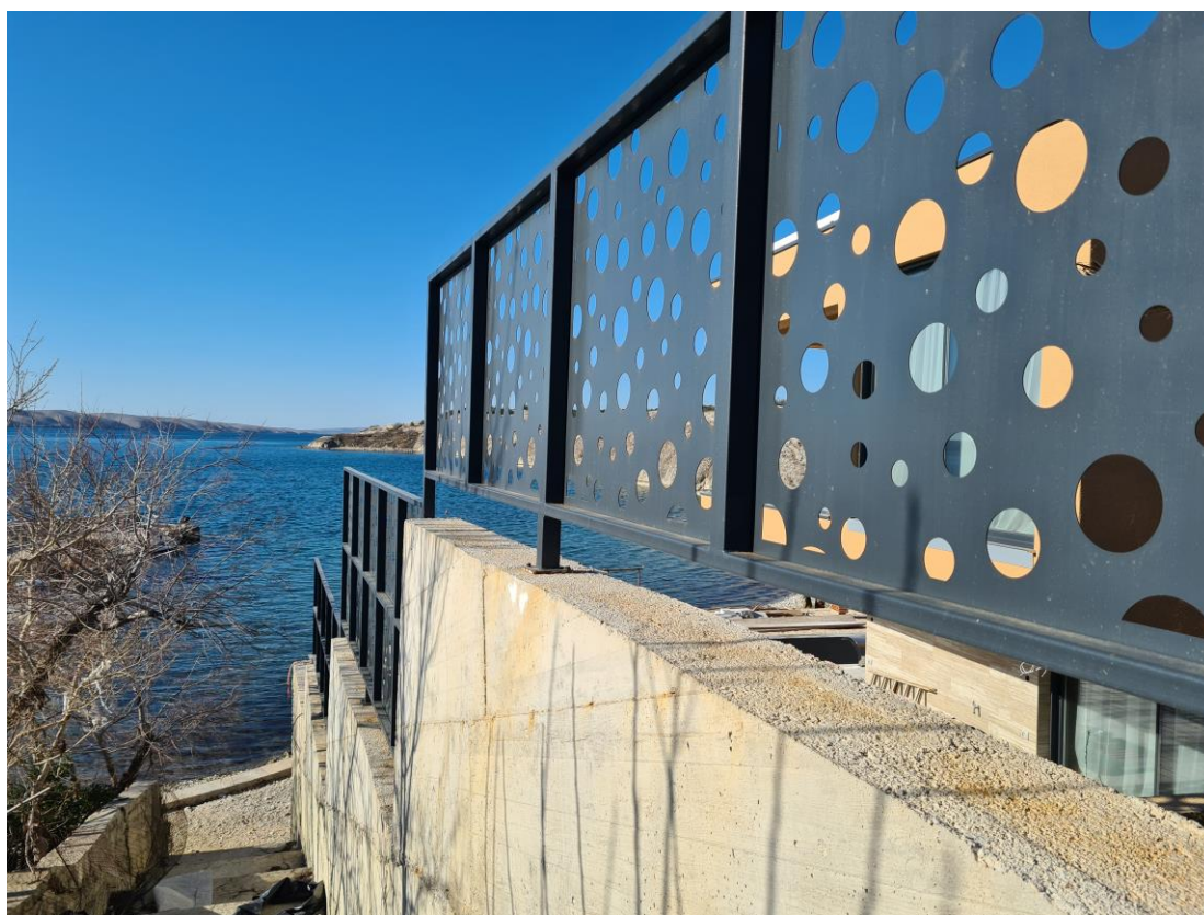
Slika br. 9