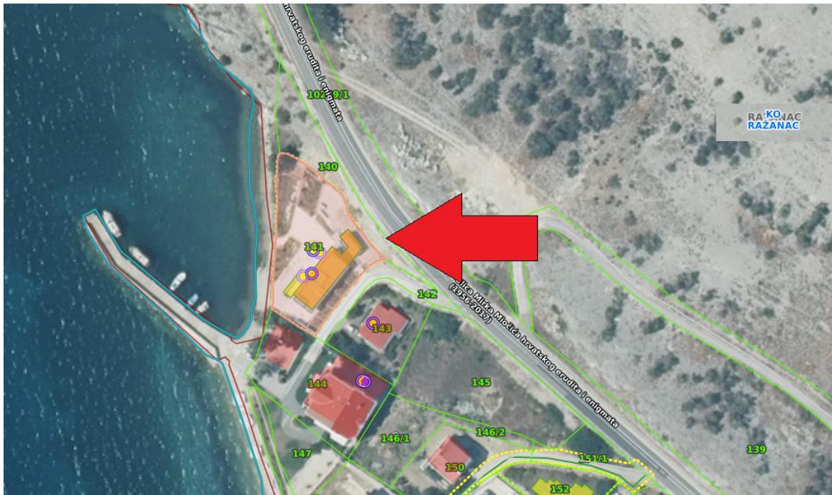
Lokacija predmetne nekretnine označena na digitalnom katastarskom planu

Lokacija promatrane nekretnine k.č.br. 141 k.o. Ražanac je u naselju Rtina-Miletići, u krajnje sjevernom dijelu naselja zapadno od državne ceste koja prolazi kroz Rtinu, na adresi -dio Ulice Mirka Miočića na adresi Rtina-Miletići bb.