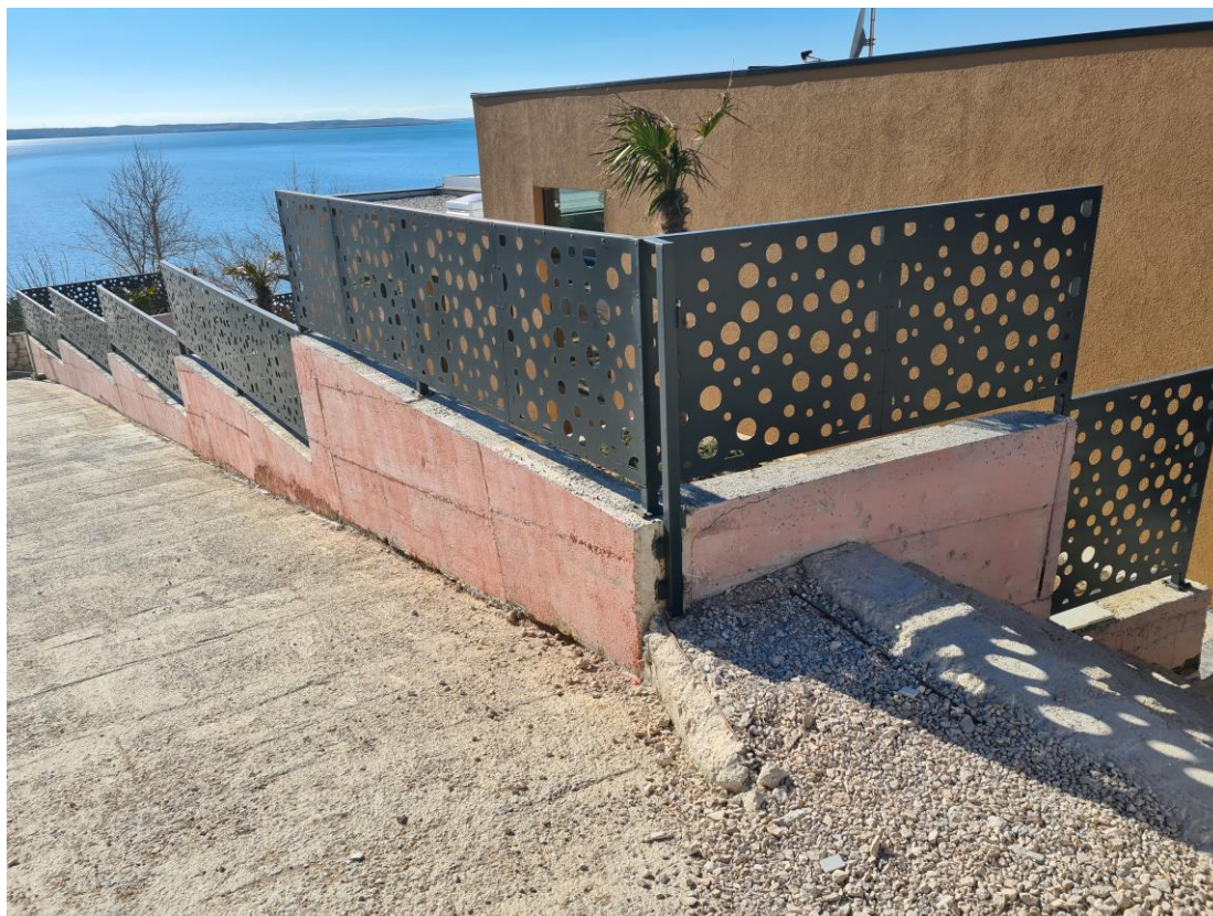
Slika br. 8