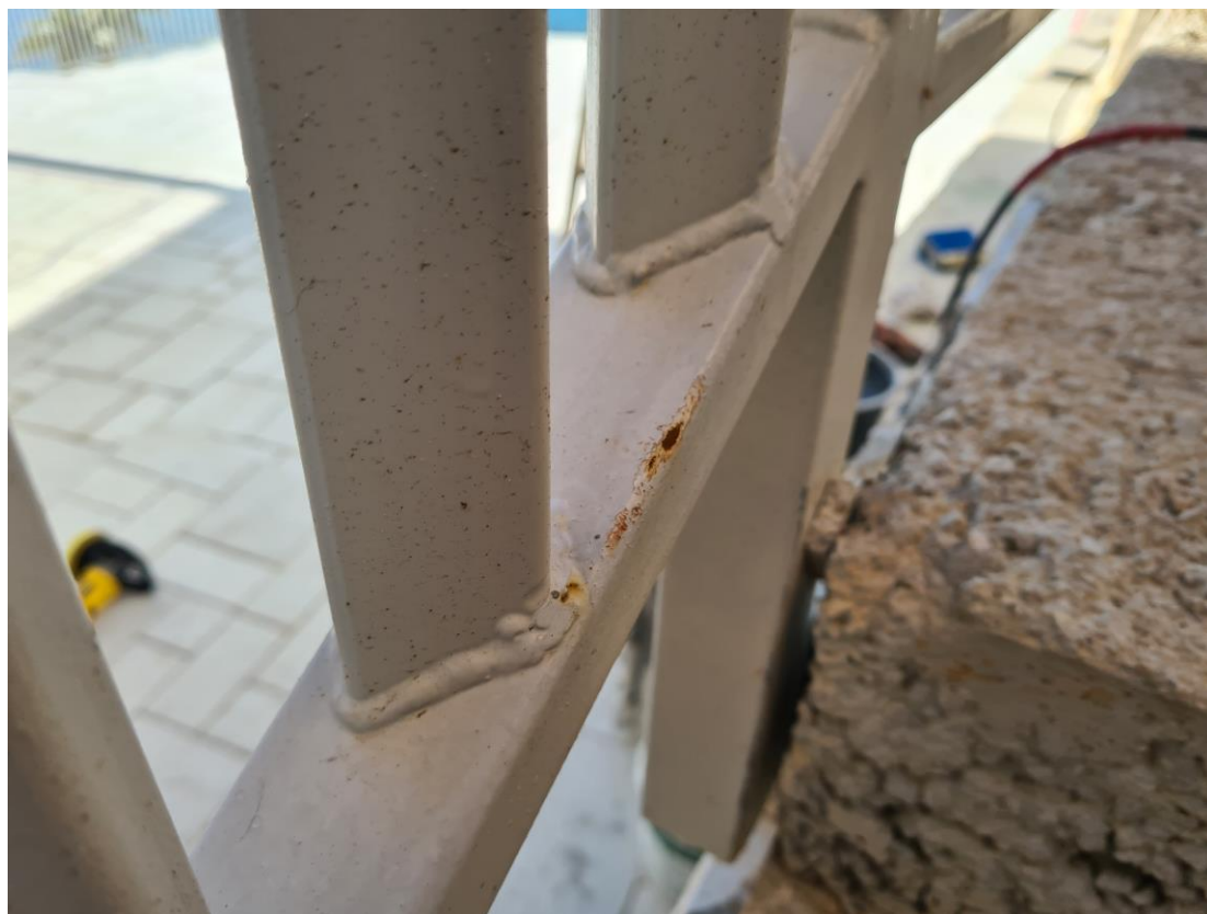
Slika br. 5