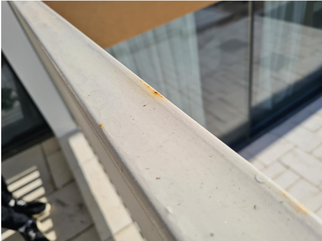
Slika br. 6