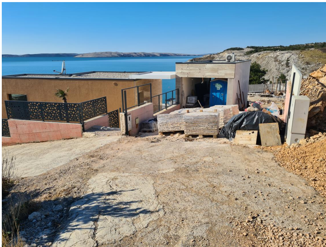
Slika br. 1

Pristup na k.č.br. 141 k.o. Ražanac je strmim putem sa jugoistočne strane. Vizualnim pregledom je utvrđeno da nisu izvedeni radovi dopreme i montaže kapije. Nije montirana dvorišna kapija na ulazu u građevnu česticu u dužini 6,5 m. Nije montirana pješačka kapija u dužini 2,3 m. Na mjestu dvorišne kapije se u trenutku očevida nalaze odložene palete građevinskog materijala (Slika br. 1).