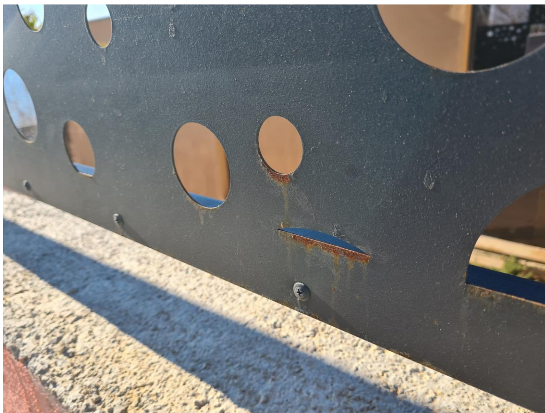
Slika br. 11