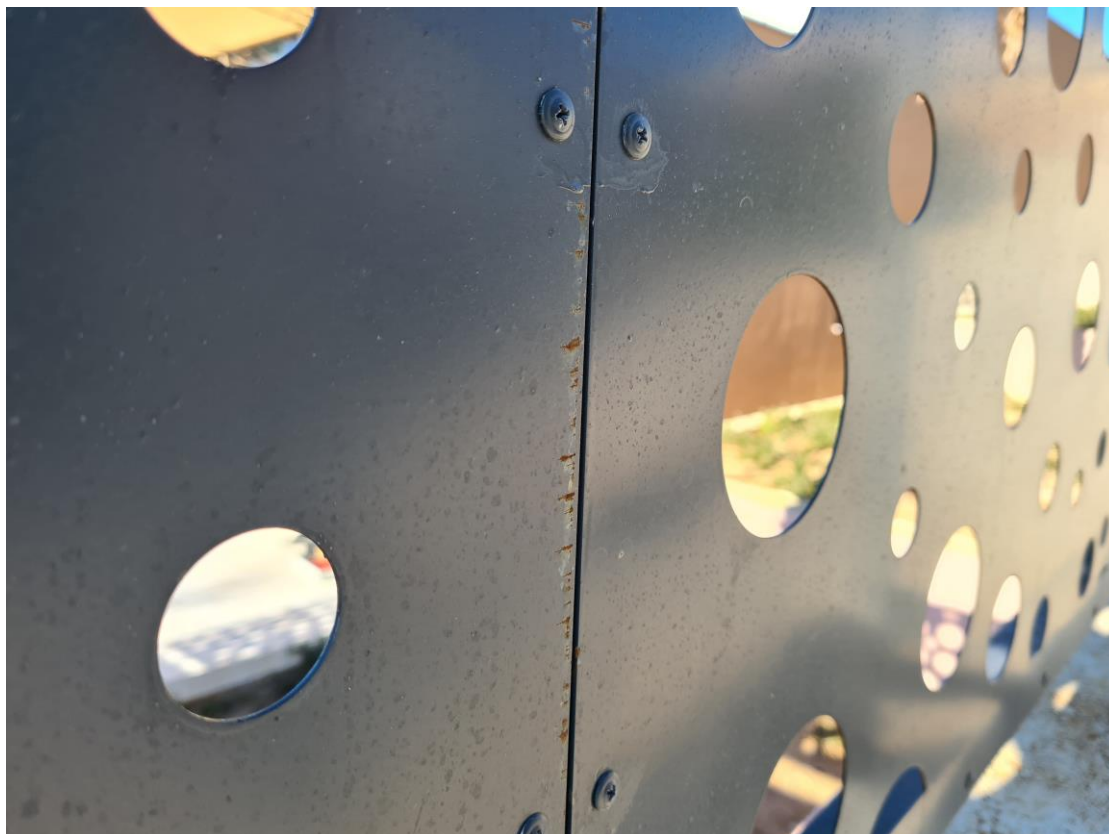
Slika br. 10