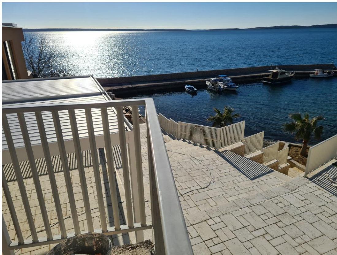
Slika br. 2