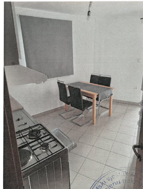
kuhinja i blagovaona