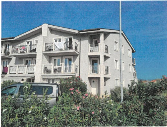
stambena zgrada I. Meštrovića 21A