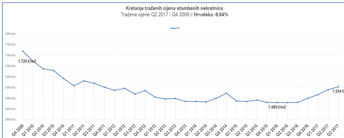
Graf 1. Prikaz kretanja traženih cijena stambenih nekretnina

Također bismo istaknuli kako nisu svi dijelovi Hrvatske na jednak način ušli u krizu, niti su tijekom krize bili toliko podložni tim promjenama. Uglavnom je to bilo uvjetovano količinom zaliha neprodanih stanova po regijama ulaskom u krizu što je znatno utjecalo na kretanje cijena. Ipak, svima se ukazao isti zajednički problem, a to je pad volumena prodaje te duži period prodaje nekretnina po projektima.