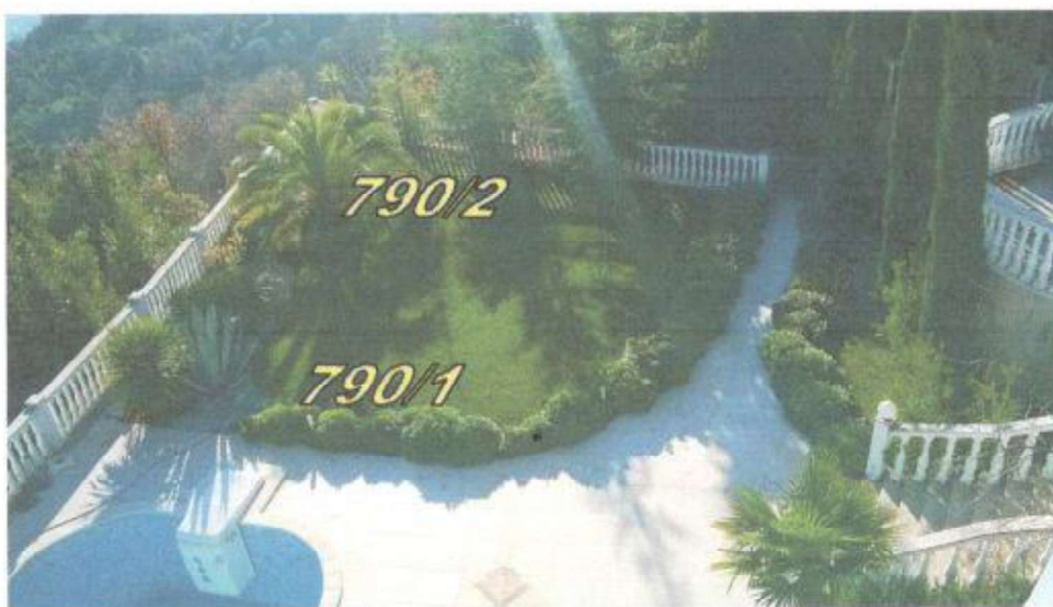
1. Pogled prema jugu na predmetnu nekretninu. Južna i istočna međa k.č.790/1 definirane betonskom ogradom

Napomena: Katastarske međe su približno točno ucrtane crvenom crtkanom linijom