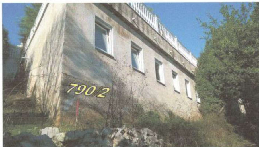
4. Južni (lijevo) i istočni zid (desno) zgrade (teretana) sagrađene dijelom na k.č.790/1, dijelom na k.č.790/2