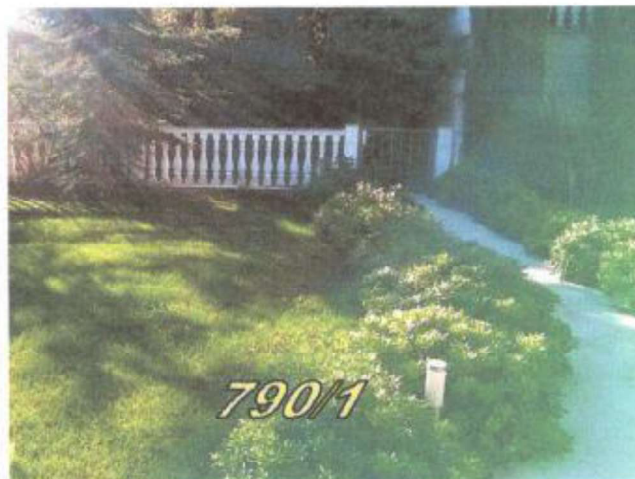
3. Južna strana nekretnine. Vrata u ogradi