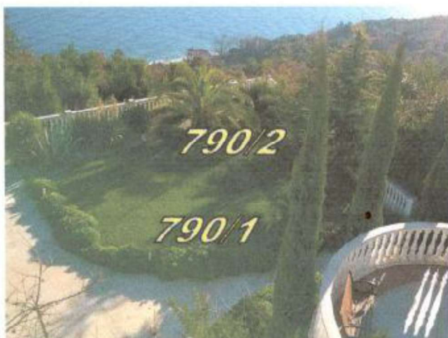
2. Pogled prema jugoistoku na predmetnu nekretninu