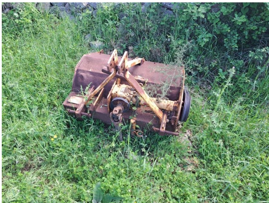
Sl. 76 Malčer Bertl BF095