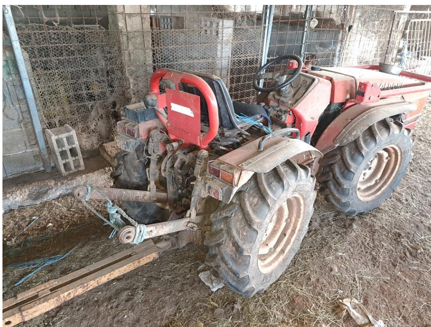
Sl. 71 Traktor GOLDONI MAXTER 60 SN