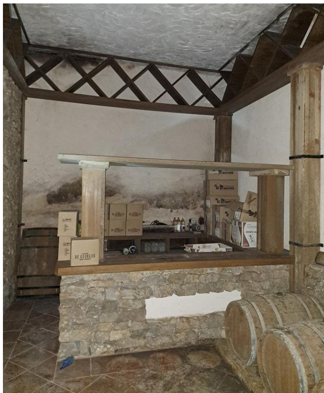
Sl. 15 Komplet oprema-kušaona vina, šank vanjski dio