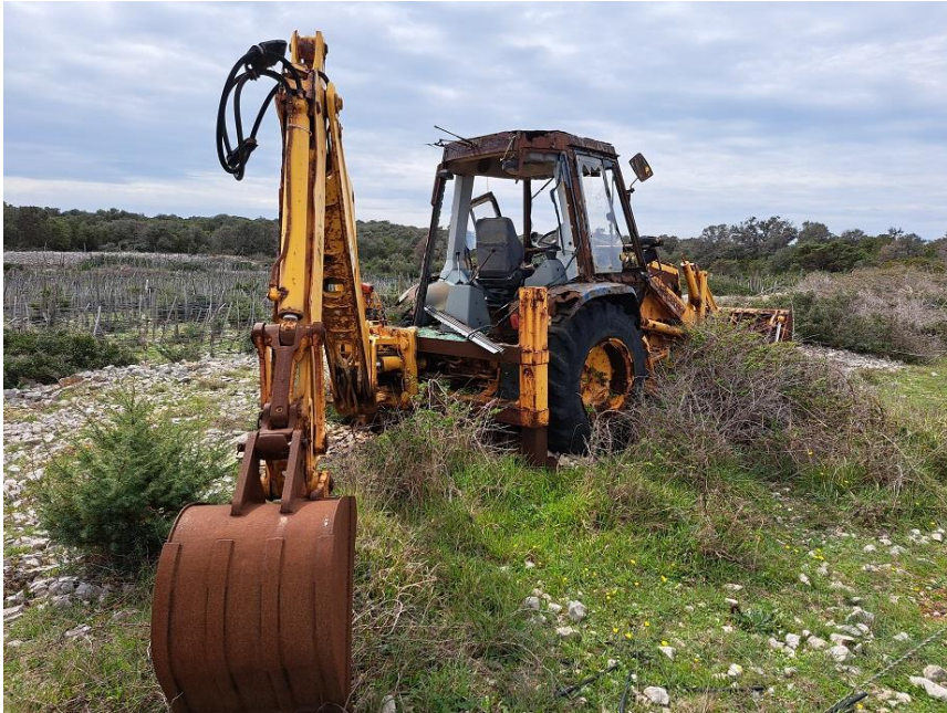
Sl. 78 Radni stroj CASE POCLAIN 580K Turbo, 1995.g.