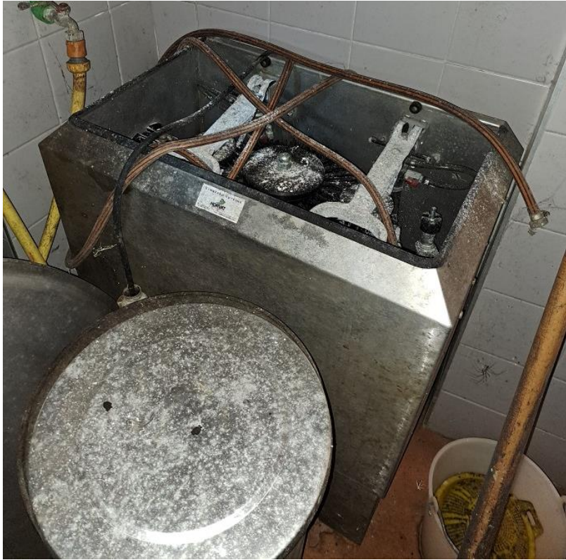
Sl. 21 Peračica boca -Pralomat TYP PS400, Horvat