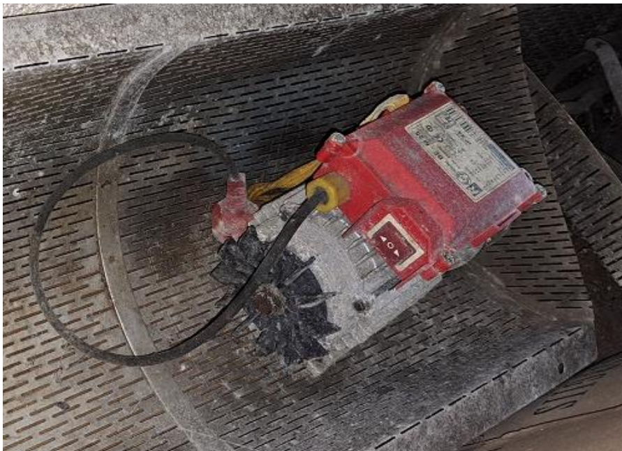
Sl. 25 Pumpa Zambelli T-40 električna , zatečena Rover pomp, BE-M25 bez kućišta impelera