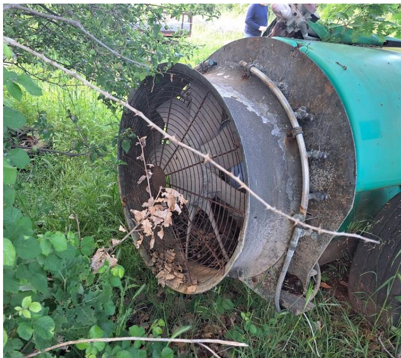
Sl. 67 Atomizer 1000 lit.