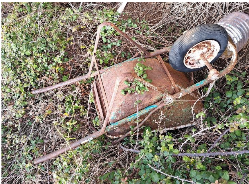
Sl. 27 Karijola