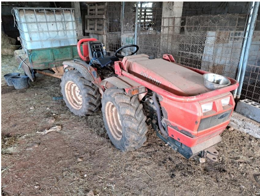
Sl. 70 Traktor GOLDONI MAXTER 60 SN