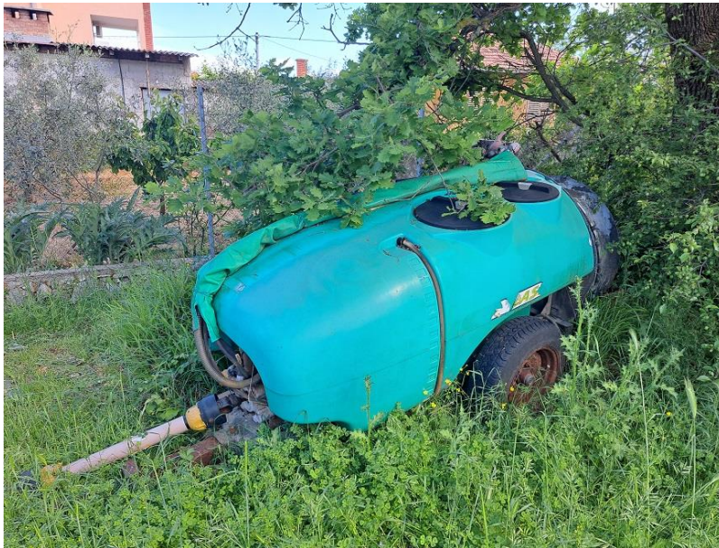
Sl. 66 Atomizer 1000 lit.