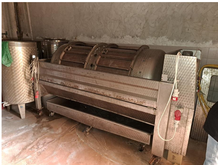
Sl. 7 Presa za grožđe 2200 lit. automatska