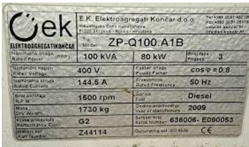
Sl. 2 Pločica, Agregat Iveco EO 80162- ZPQ100.AQ1B, 80kW