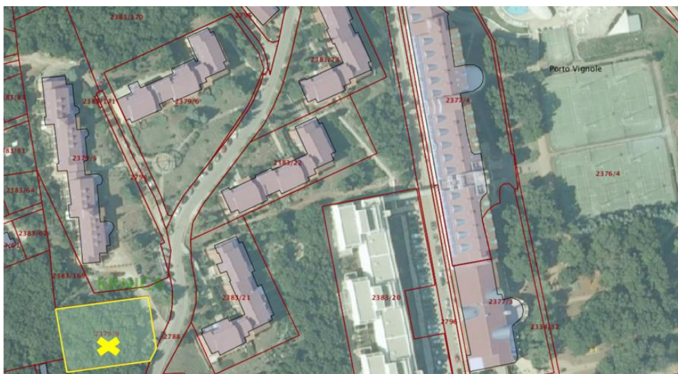
Slika 4 zk ul 5375 kčbr 2379/9

Uvidom u zemljišne knjige pregled katastraskog operatera na Slici 1 razvidno je kako kčbr 2376/4 sadrži može se pretpostaviti dva sportska terena, što se isto tako može pretpostaviti da je slično opisu u stavci Duga Uvala, zemljište (tereni, parking, PZR, kažun, recepcija) zkul 5375,7262 ko Krnica . Na slici 4 razvidno je da zk.ul 5375 sadrži šumu (isto je navedeno i u Opisu imovine, obveze i kapitala). Stoga se može pretpostaviti da se opisi „tereni, parking, PZR, kažun i recepcija“ odnose na zk.ul 7262 koji nije naveden na Opisu imovine, obveze i kapitala,