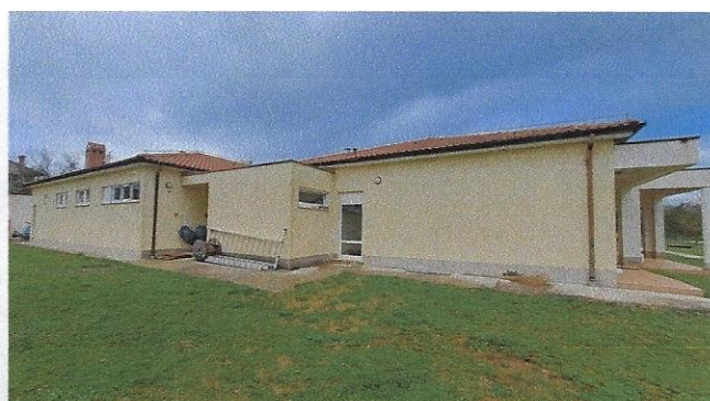
Slika 4 – zapadno pročelje