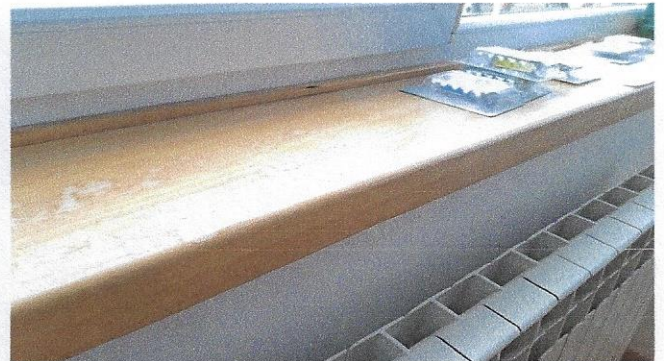
Slika 27 – drvo