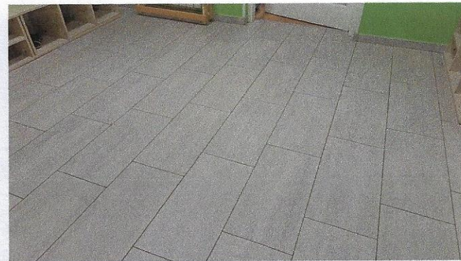
Slika 19 – keramičke pločice