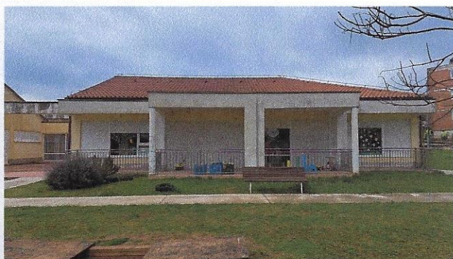
Slika 6 – južno pročelje