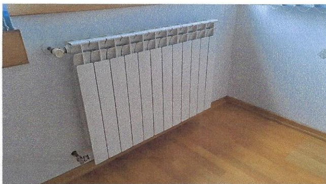
Slika 32 – radijator u uredu