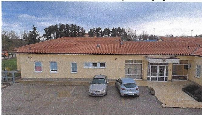
Slika 1 – sjeverno pročelje