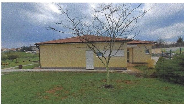
Slika 3 – istočno pročelje