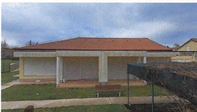
Slika 5 – južno pročelje