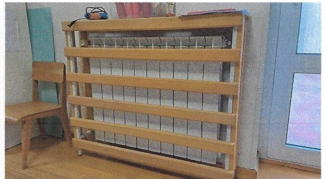
Slika 31 – radijator u vrtičkoj skupini