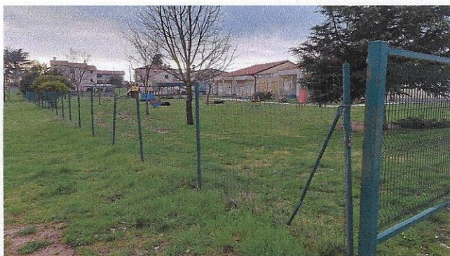
Slika 36 – panel ograda