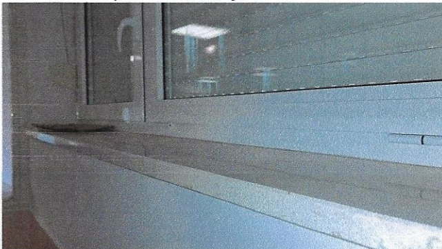
Slika 26 – kamen