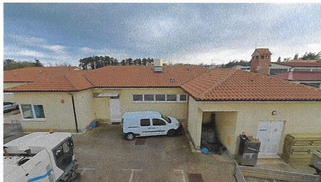
Slika 2 – sjeverno pročelje