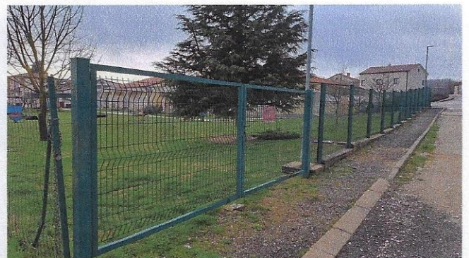
Slika 37 – panel ograda