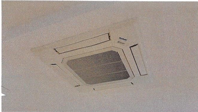
Slika 30 – klima uređaj