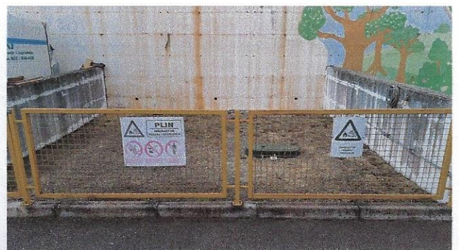
Slika 33 – spremnik za plin