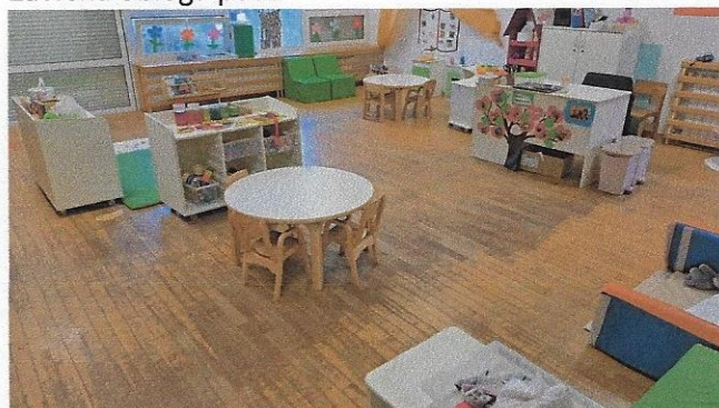
Slika 18 – parket