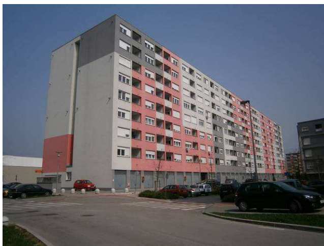
Foto 1: Zgrada u kojoj se nalazi garažno parkirno mjesto P-38 (lipanj 2014.)