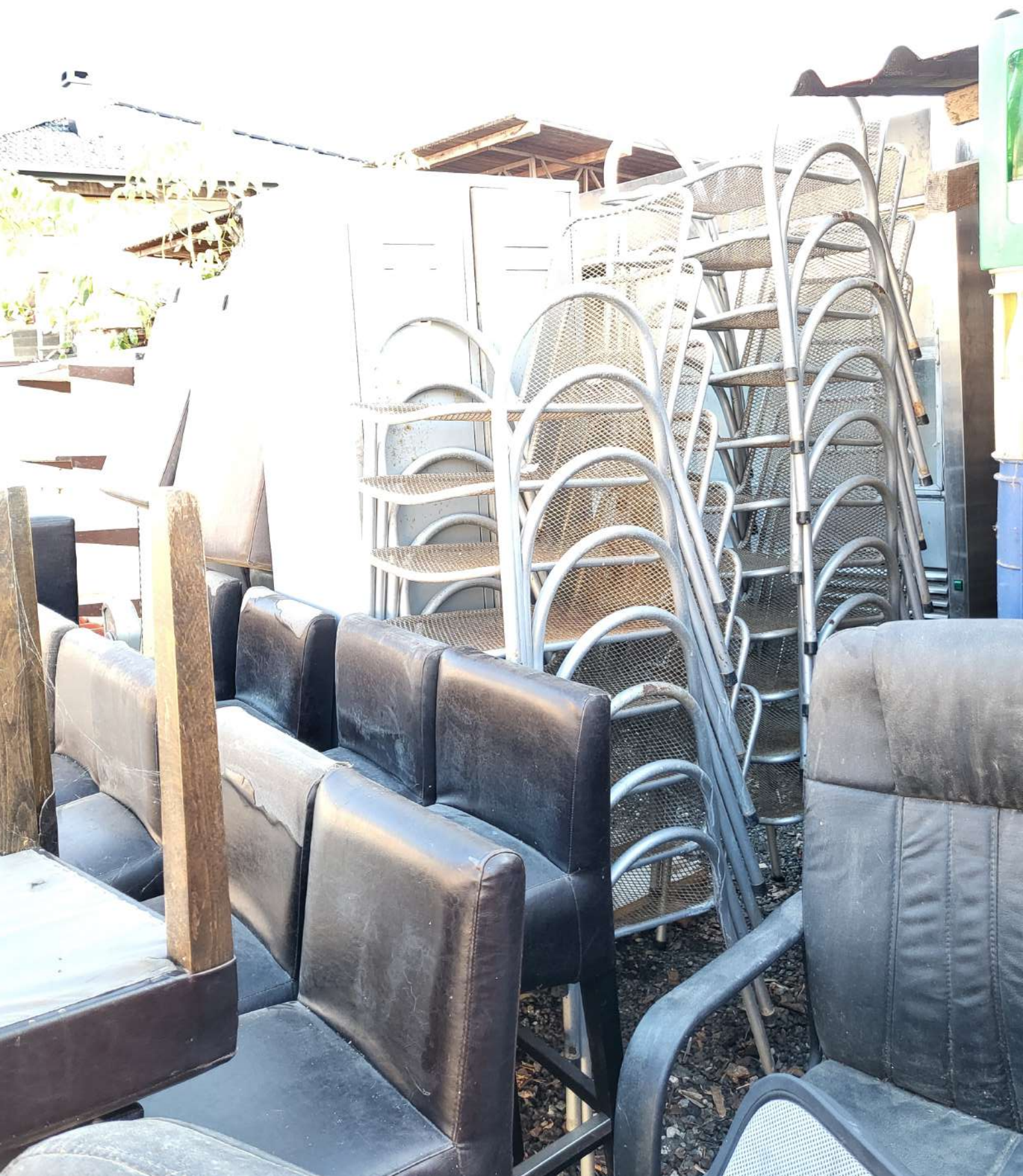
3. Metalne stolice 20 komada (3.000,0 KN=398,17 EUR)