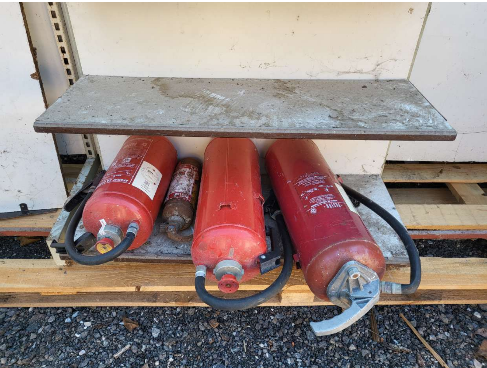
1. Metalna polica gondola 3m (3.000,00 KN=398,17 EUR )