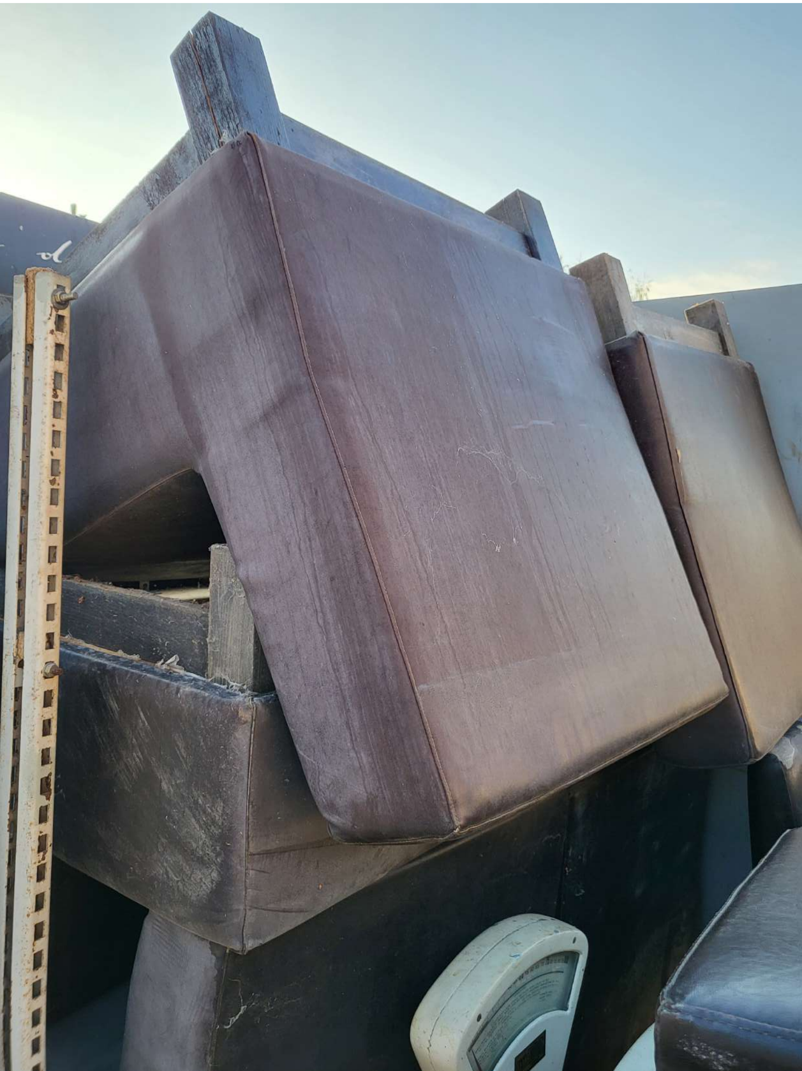
5. Klupe tapcirane 6 kom (2.000,00 KN=265,45 EUR)