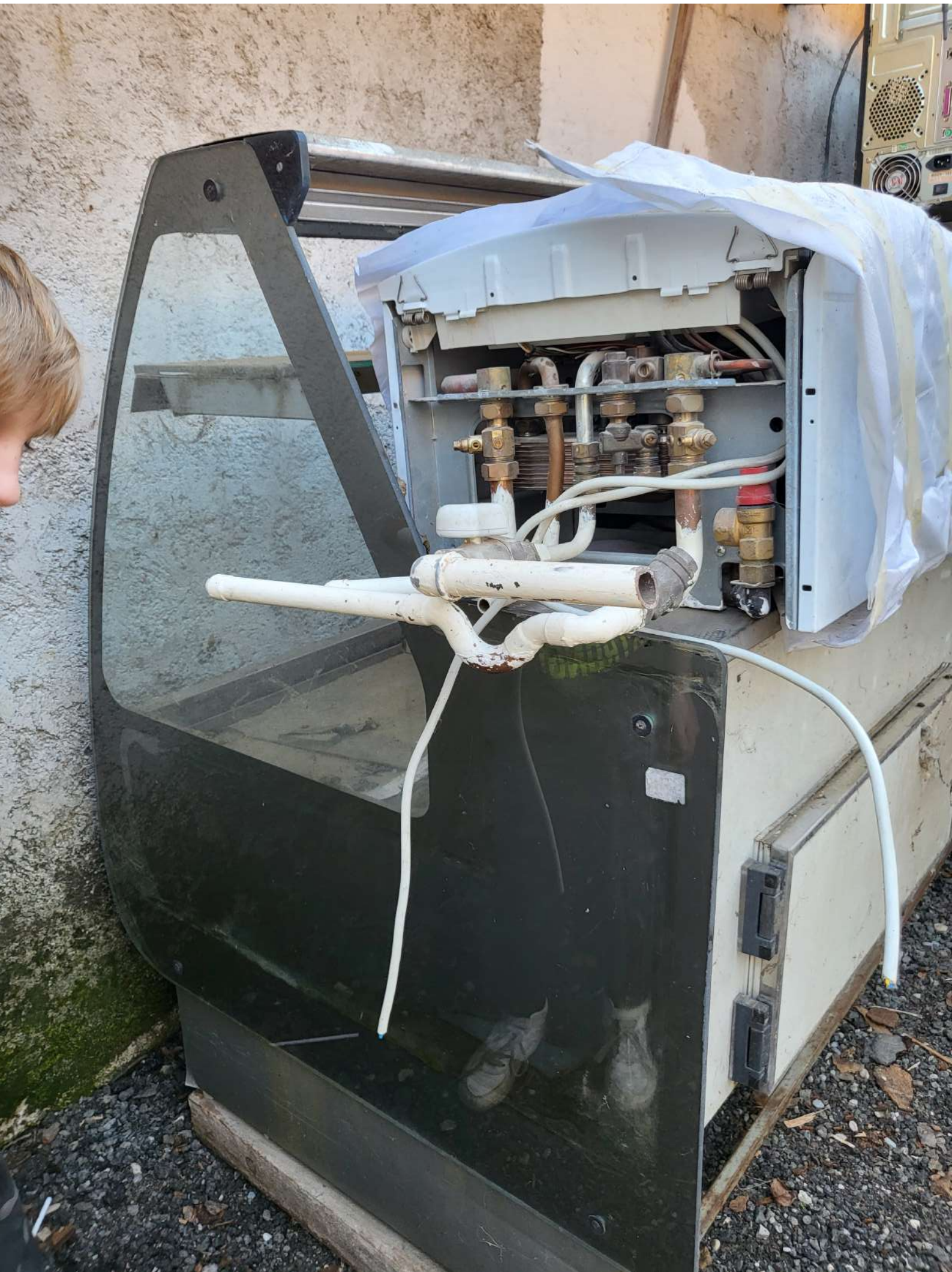
17. Rashladna vitrina 2,5 M (3.000,00 KN=398,17 EUR)