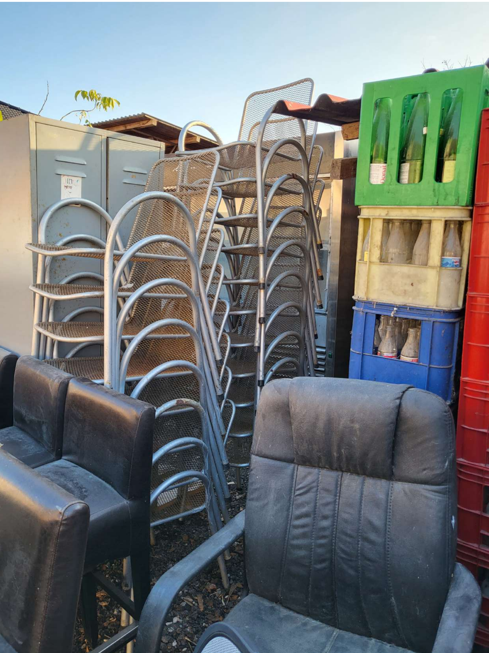
6. Metalni garderobni ormar 1 kom (1.000,00 KN=132,72 EUR)