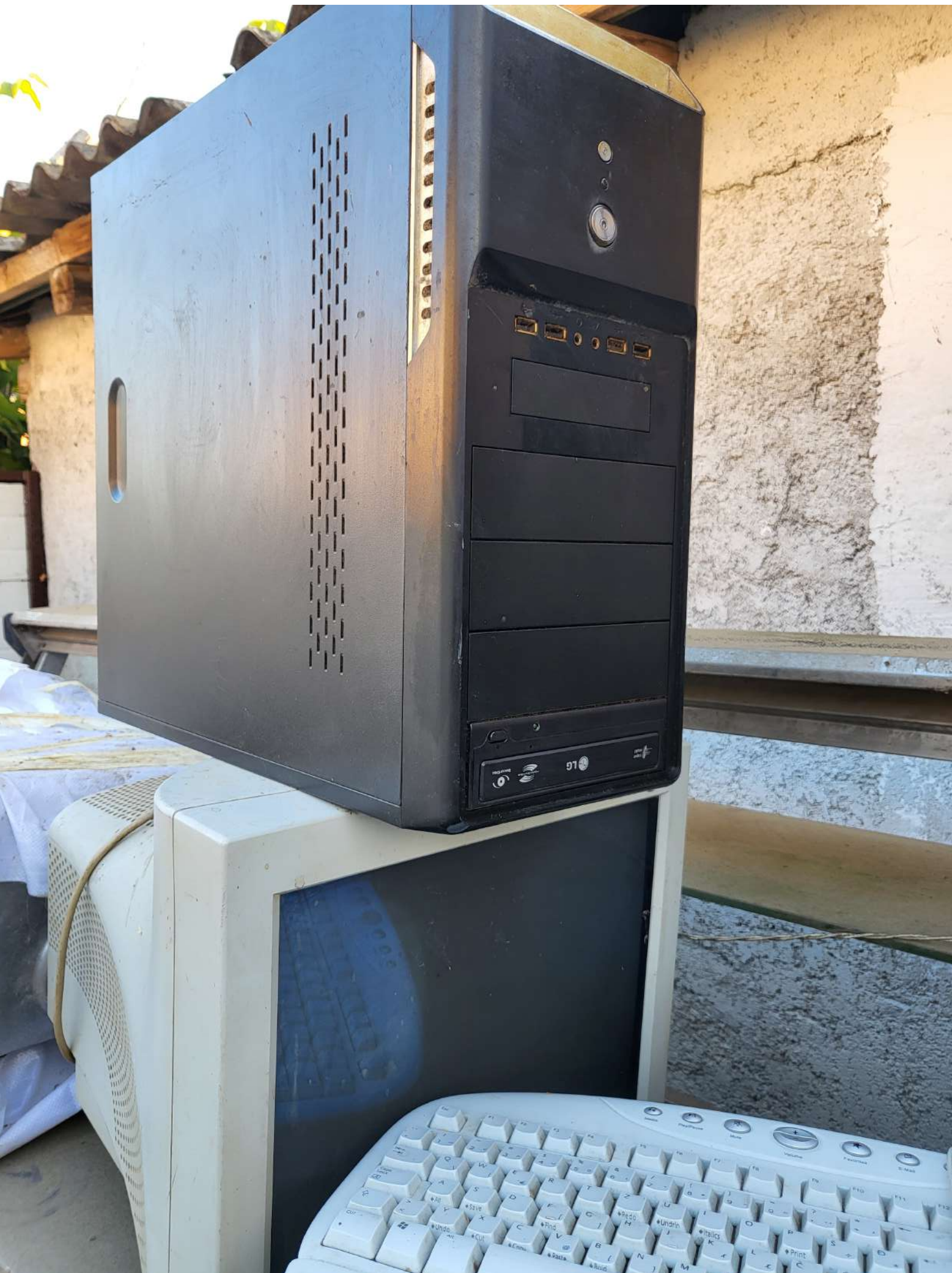
10. Kasa (računalo, tipkovnica, monitor) (2.000,00 KN=265,45 EUR)