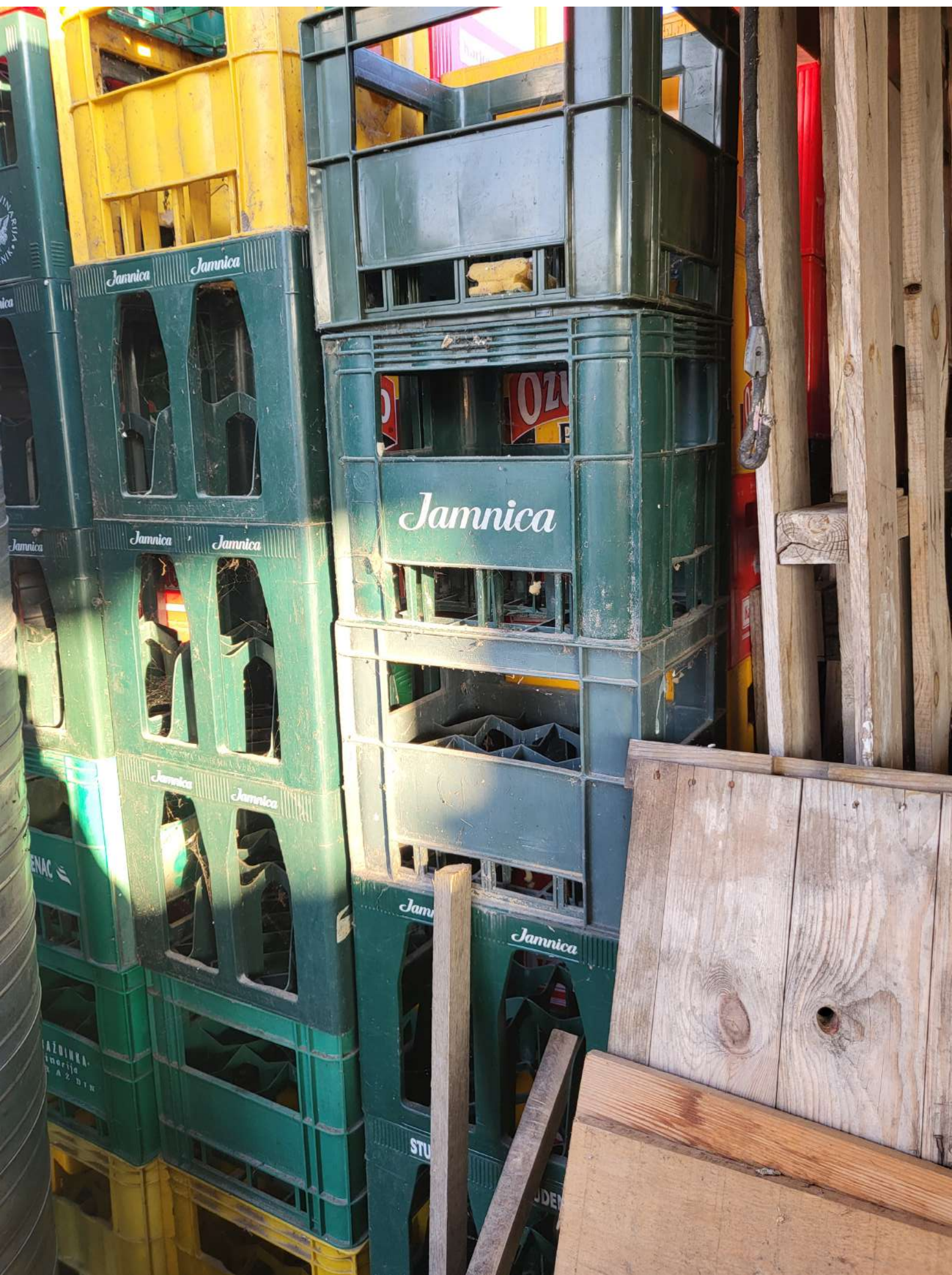
9. Ambalaža PVC - bez boca (1.000,00 KN=132,72 EUR)