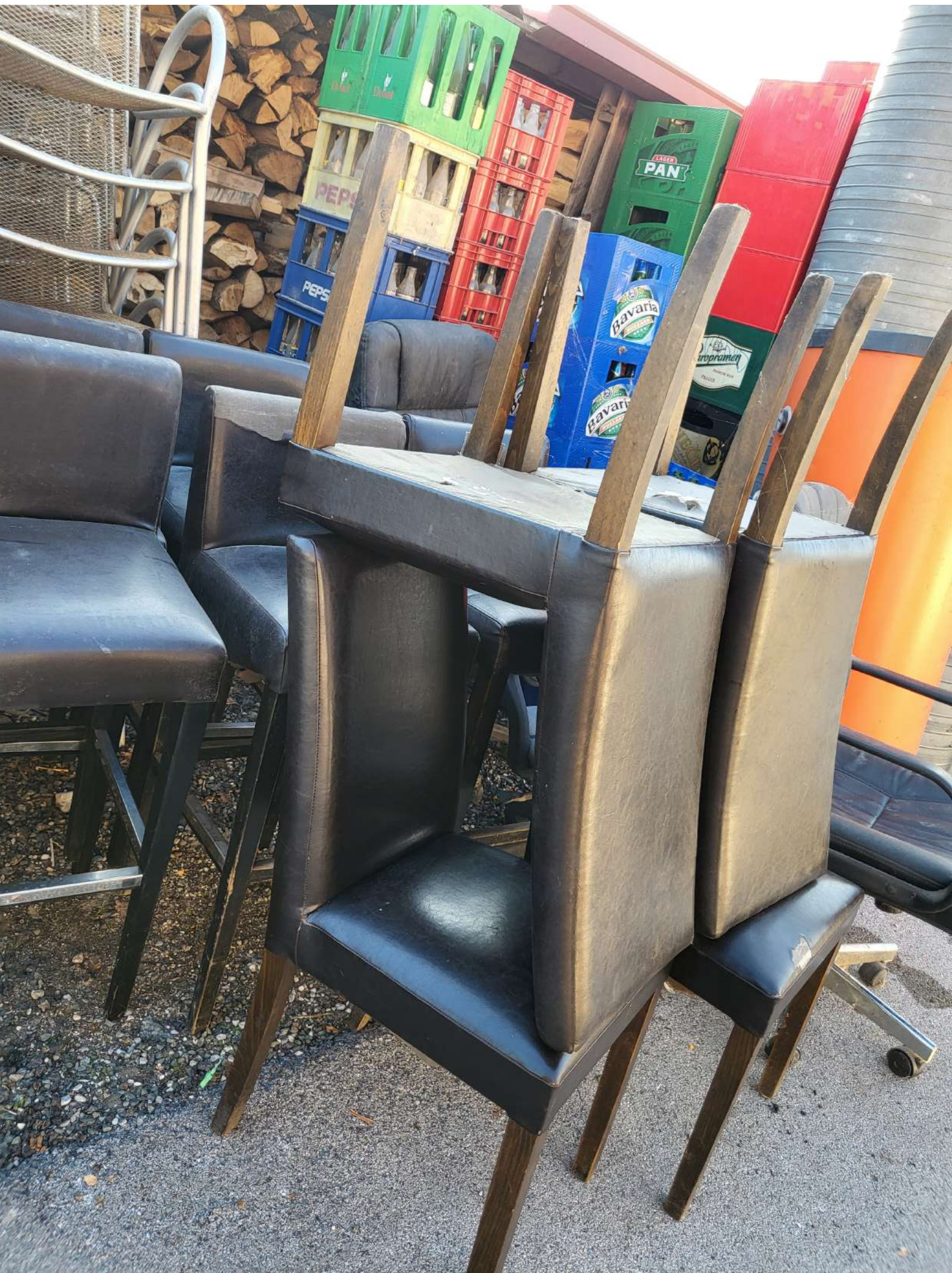
11. Fotelja ugostiteljska (2.400,00 KN=318,53 EUR)