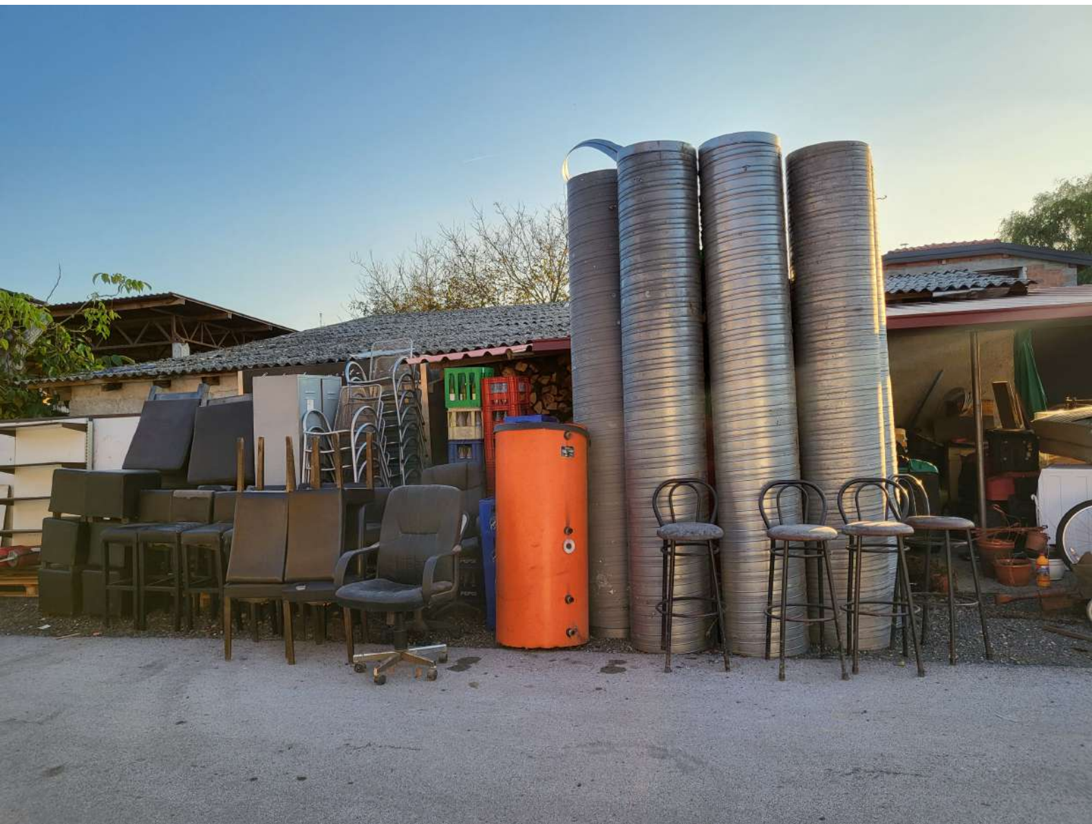
14. Ventilacijske cijevi (2.000,00 KN=265,45 EUR)