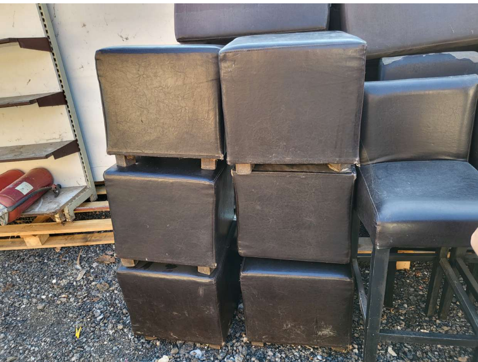
4. Drvene barske stolice - 10 stolica + 6 taburea (4.000,00 KN=530,89 EUR)