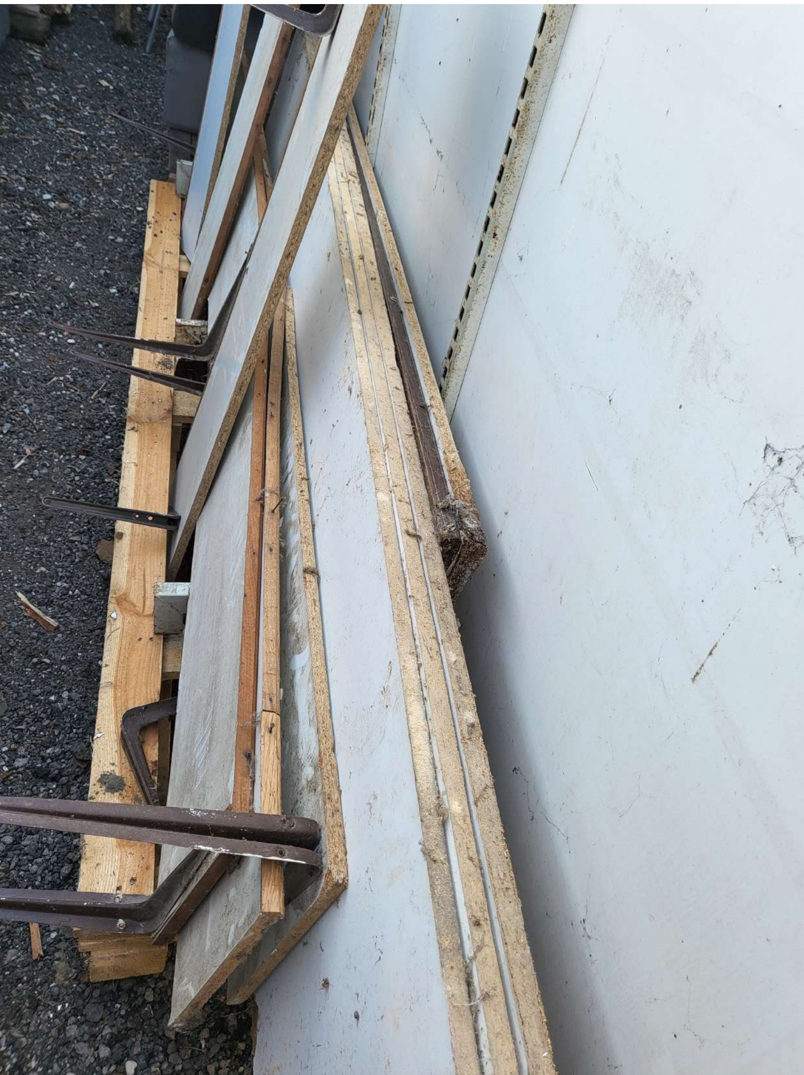
2. Drvene police zidne 10 m (5.000,00 KN=663,61 EUR)