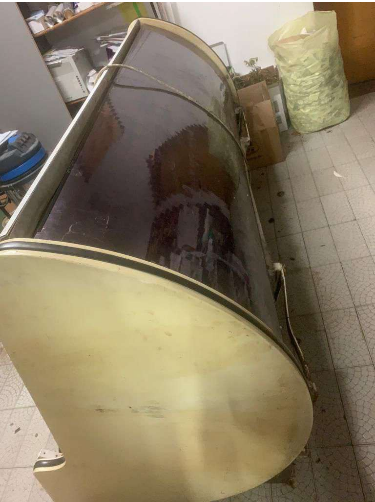
18. Rashladni frižider za suhomesnato 3M (4.000,00 KN=530,89 EUR)