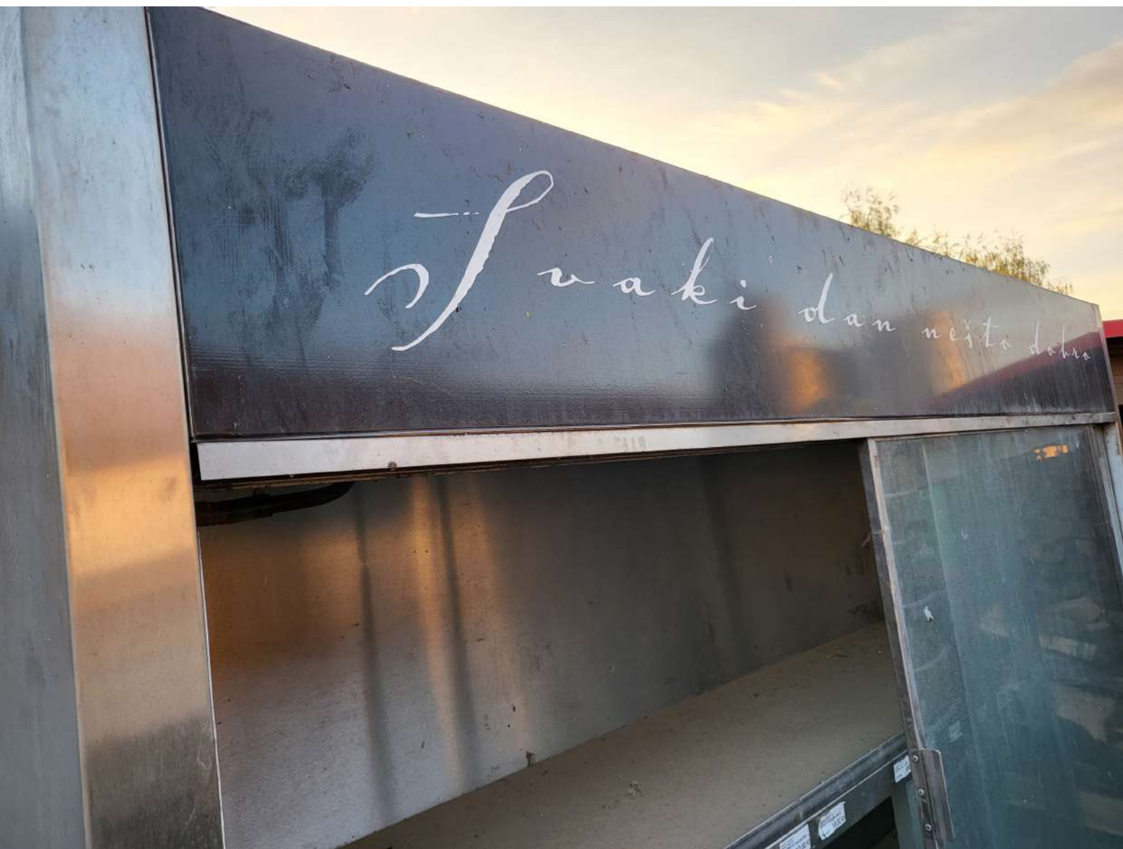
19. Zidni rashladni ormar (6.000,00 KN=796,34 EUR)