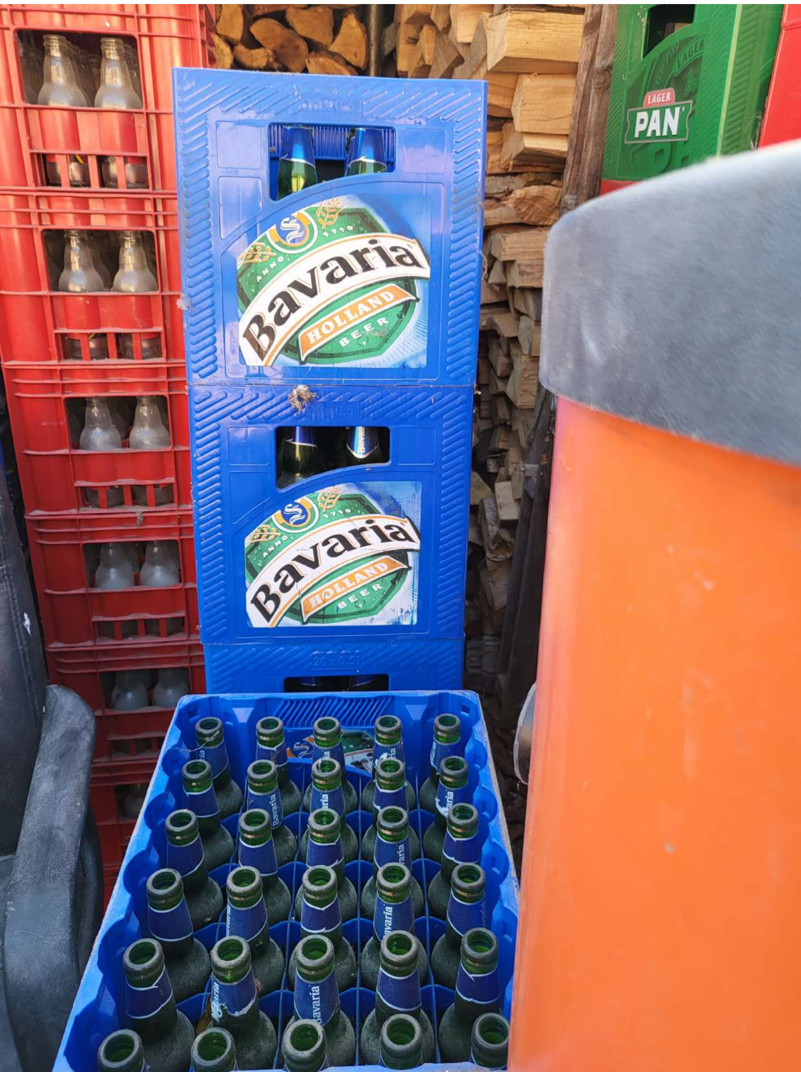
8. Ambalaža s bocama - 50 kom (1.500,00 KN=199,08 EUR)