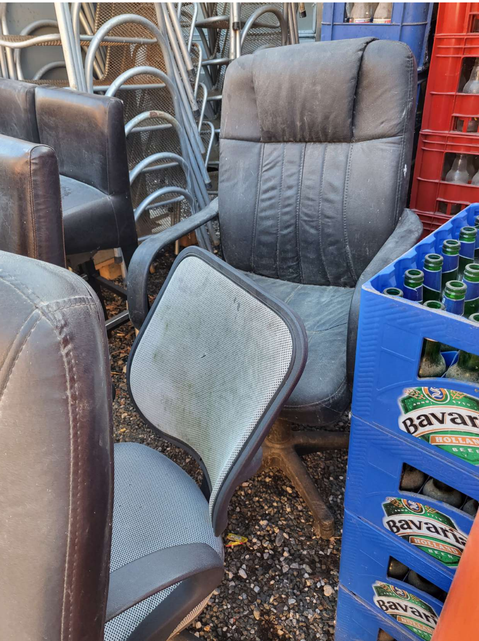
20. Uredske stolice (600,00 KN=79,63 EUR)